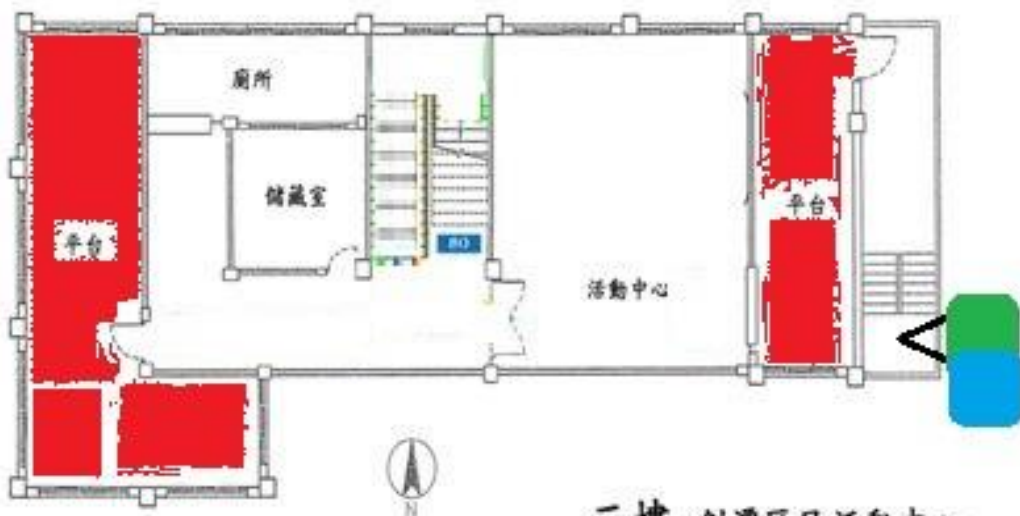
三樓 劍潭區民活動中心