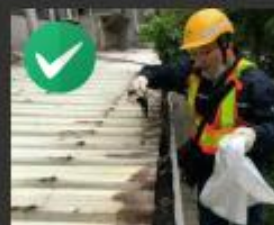
定期清理阻塞的天溝， 保持暢通，避免積水