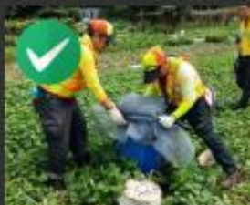
不用時將容器倒置， 或加裝紗網、加蓋， 避免病媒蚊飛入產卵