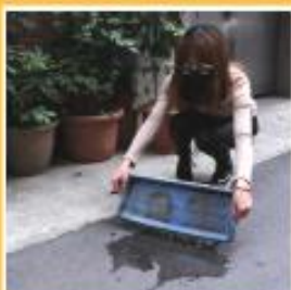
倒除積水，及積水容器倒置