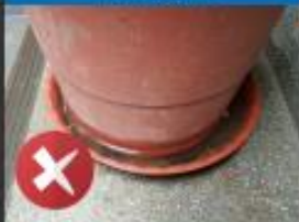
戶外盆栽底盤積水