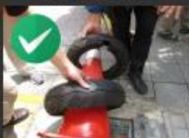
輪胎打洞使內部積水流 出，或是避免使用輪胎