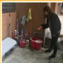
定期巡檢，避免室內外容器積水