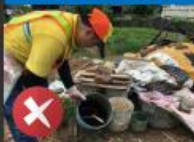
儲水容器成為積水 容器