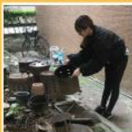
環境整理，清理不用的容器並予以回收