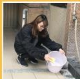
定期刷洗容器內側邊壁，避免蚊卵附著