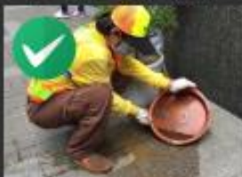
戶外盆栽底盤以不使用為原則，或定期檢查清理刷洗