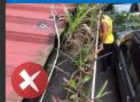
屋簷的排水槽年久淤積 堵塞，容易產生積水