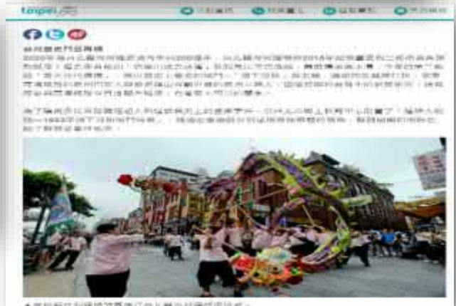
【台北畫刊 5 月刊/台北旅遊網】