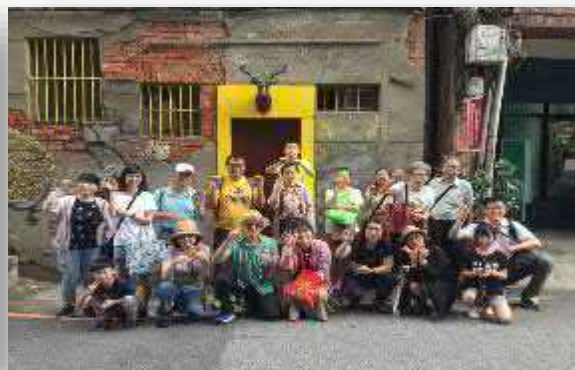
【朝陽尋寶趣+皮革手作DIY】