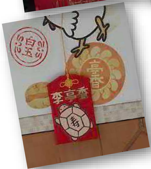
【店家特色香火袋裝置藝術】