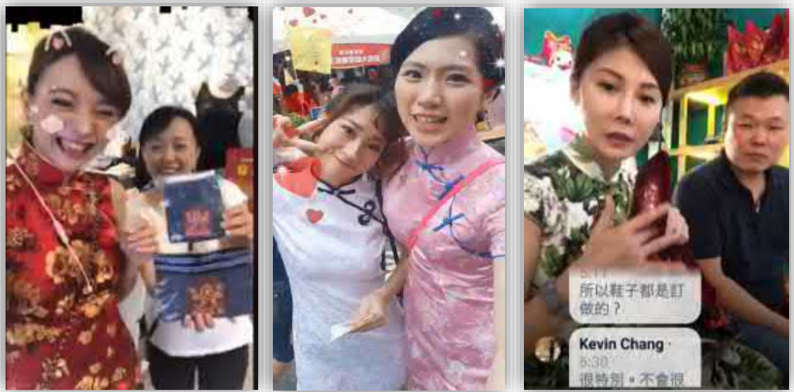
【城隍生日趴網紅直播影片】