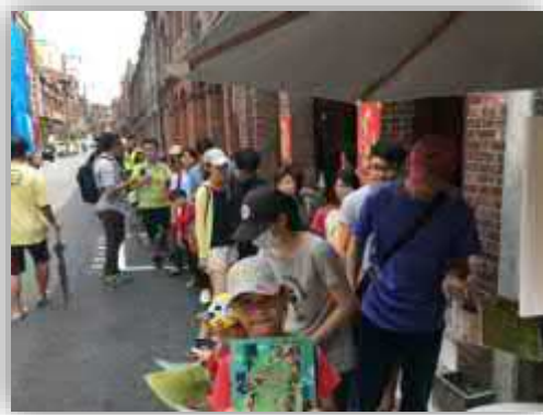
【十路口比訊有款詢處(今醫疾士培、齡培及試少