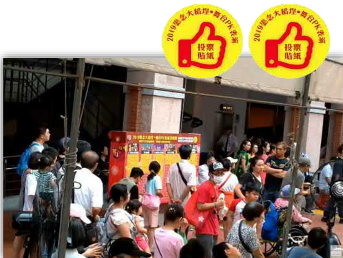
【頂下郊拼 PK 賽投票版/「按讚」貼紙】