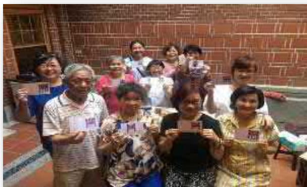
【您所不知道的大稻埕】