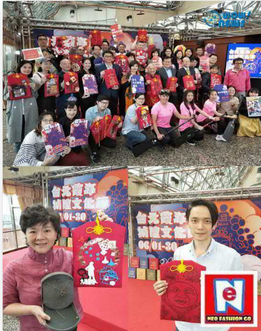
【台北霞海城隍文化節記者會店家香火袋合影】