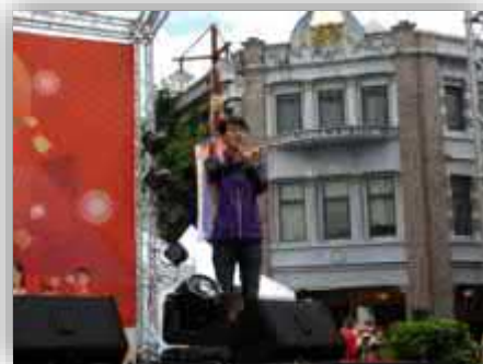
【協請臺北市政府社會局派手語服務員，打造活動友善無障礙】