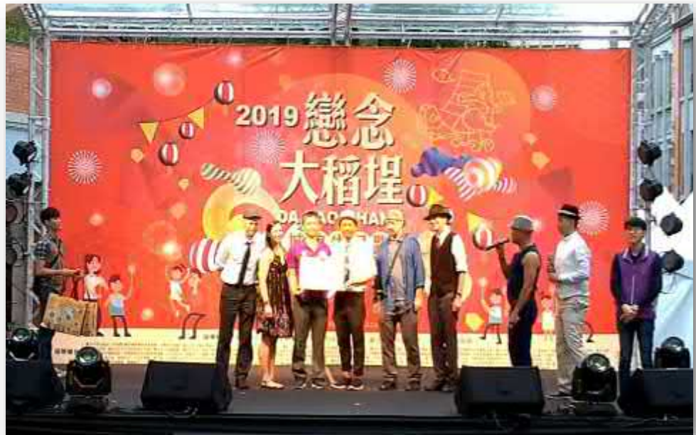
【泥灘地浪人榮獲頂下郊拚 PK 賽冠軍】

(6) 頂下郊拚 PK 賽+市民票選活動 ：城隍生日趴邀請了 6 組團體以古、今、中、外藝文鬥陣手法呈現頂下郊拚的歷史意象。頂下郊拚 PK 表演有：太平國小醒獅團 VS 拉丁鼓團(啲哩啲哩非洲鼓團、拍樂趣非洲鼓團)，永樂國小舞蹈團(民俗舞) VS SWING 舞團(搖擺舞)，泥灘地浪人(爵士樂) VS 稻埕偶戲團(北管樂)。接著 PK 團體再透過民眾票選，民眾使用「按讚」貼紙貼在心目中最棒的團體 PK 立牌上，由獲得最多「讚」的團體獲勝，而本次城隍生日趴頂下郊拚 PK 賽是由「泥灘地浪人」國外合聲樂團獲得最多「讚」聲，榮獲 PK 賽冠軍。