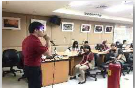
【安全管理人員教育訓