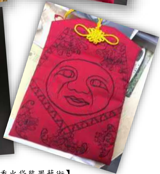
【店家特色香火袋裝置藝術】