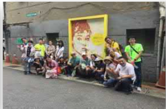
奧黛莉赫本地標合影