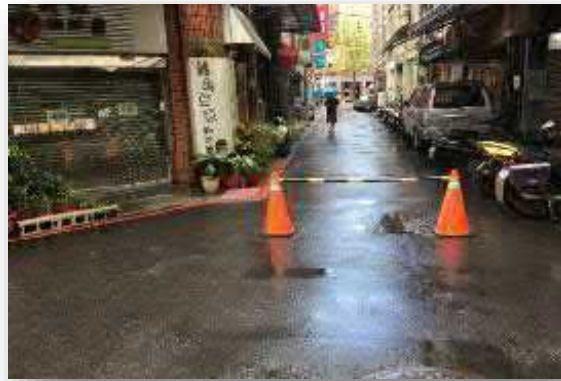
【交通要道設置交通錐及連桿管制車輛進入】