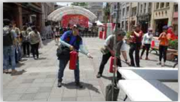
【活動前消防演練及設置緊急應變中心因應緊急事故】