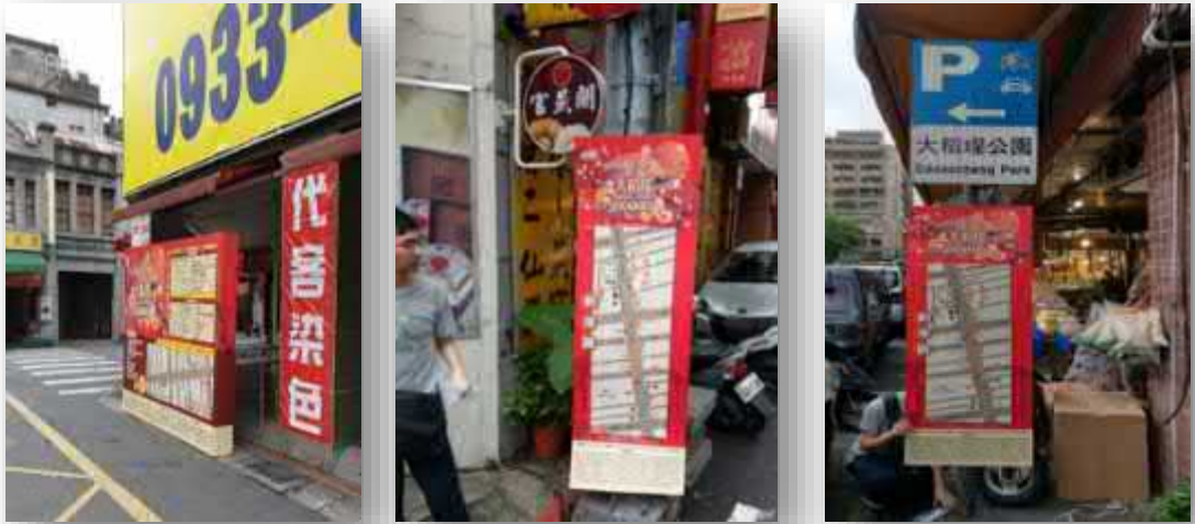
【活動範圍內各路口設置活動資訊及疏散路 線】