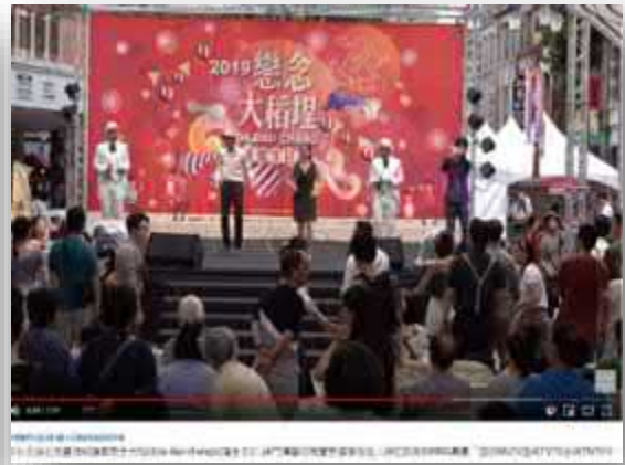
【台網 TNTV 中網 CTTV 華網 TTVT 中華網 TVC】