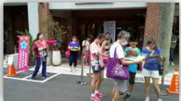
【設置紅龍控管人流及動線】