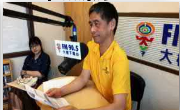
【台北廣播電台及大樹下廣播電台宣傳】