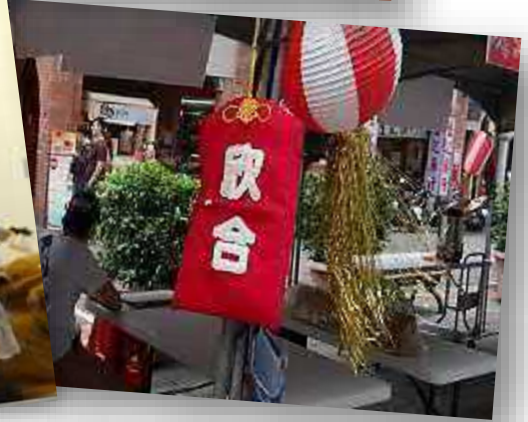
【店家特色香火袋裝置藝術】