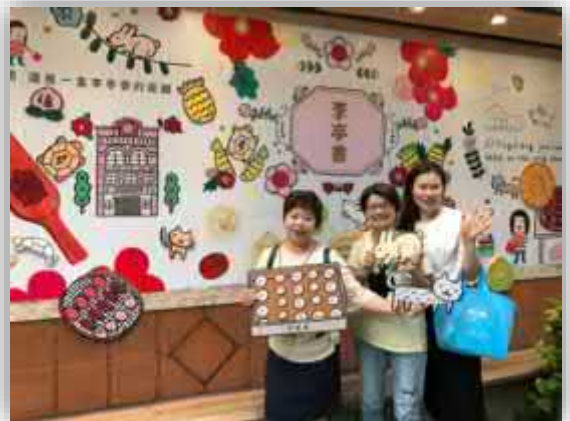
圖片由 李亭香 提供