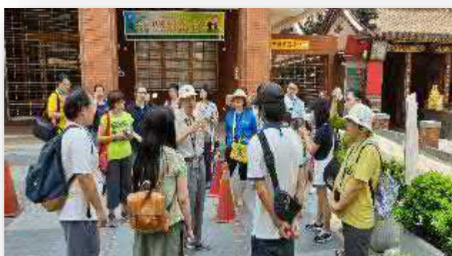
【莊協發港町文史講亭】