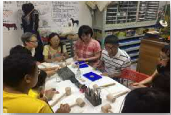
王老闆指導與講解，皮革手作DIY