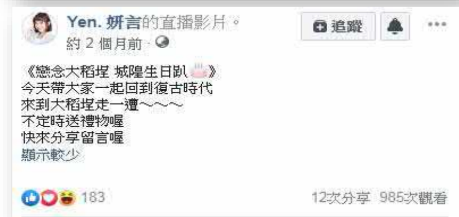
【網紅直播預告城隍生日趴活動】