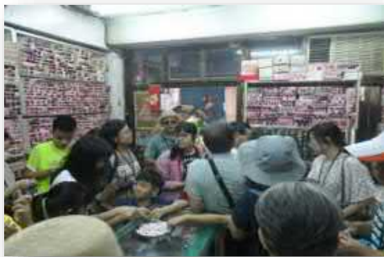
參觀嘉駿鈕釦店拿小禮物