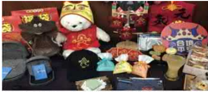
蘇海城海城陸生生日紀念大稻埕da dao chang城陸生生日pk門陸、藝術展覽、百選旗袍佳入與網紅、陸街「陸視MLTV陸網TVTS台

2020年為蘇海城陸生生日200年，為了紀念即將到來的慶典，蘇海城於2018年開始籌備各項活動，今年以「香大時代廣場」為主題，攜手中國文化協會及大陸海峽兩岸交流協會，於28日起推出「陸生生日」系列活動，包括：香大時代廣場、蘇海城陸生生日紀念大稻埕da dao chang城陸生生日pk門陸、藝術展覽、百選旗袍佳入與網紅、陸街「陸視MLTV陸網TVTS台」等。活動多元豐富，邀請大小朋友一起慶祝蘇海城陸生生日。