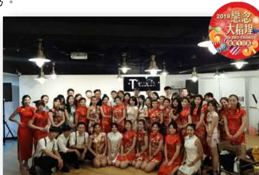
【旗袍美女/城隍生日趴祝壽貼紙】

本次活動也與迪化街當地可以租借旗袍及唐裝、中山裝的店家「福來許」、「小花園」及「貳零年華」合作，店家們提供租借旗袍、妝髮搭配有 5 折優惠方案，讓市民們可以立馬化身網美，體驗不一樣的穿著風格，認識代表華人的傳統服飾；另外，本次活動亦請 3 位網紅特別宣傳”永樂布業商場”，介紹市民可以挑選喜歡的布料為自己量身訂做一件旗袍的地方。