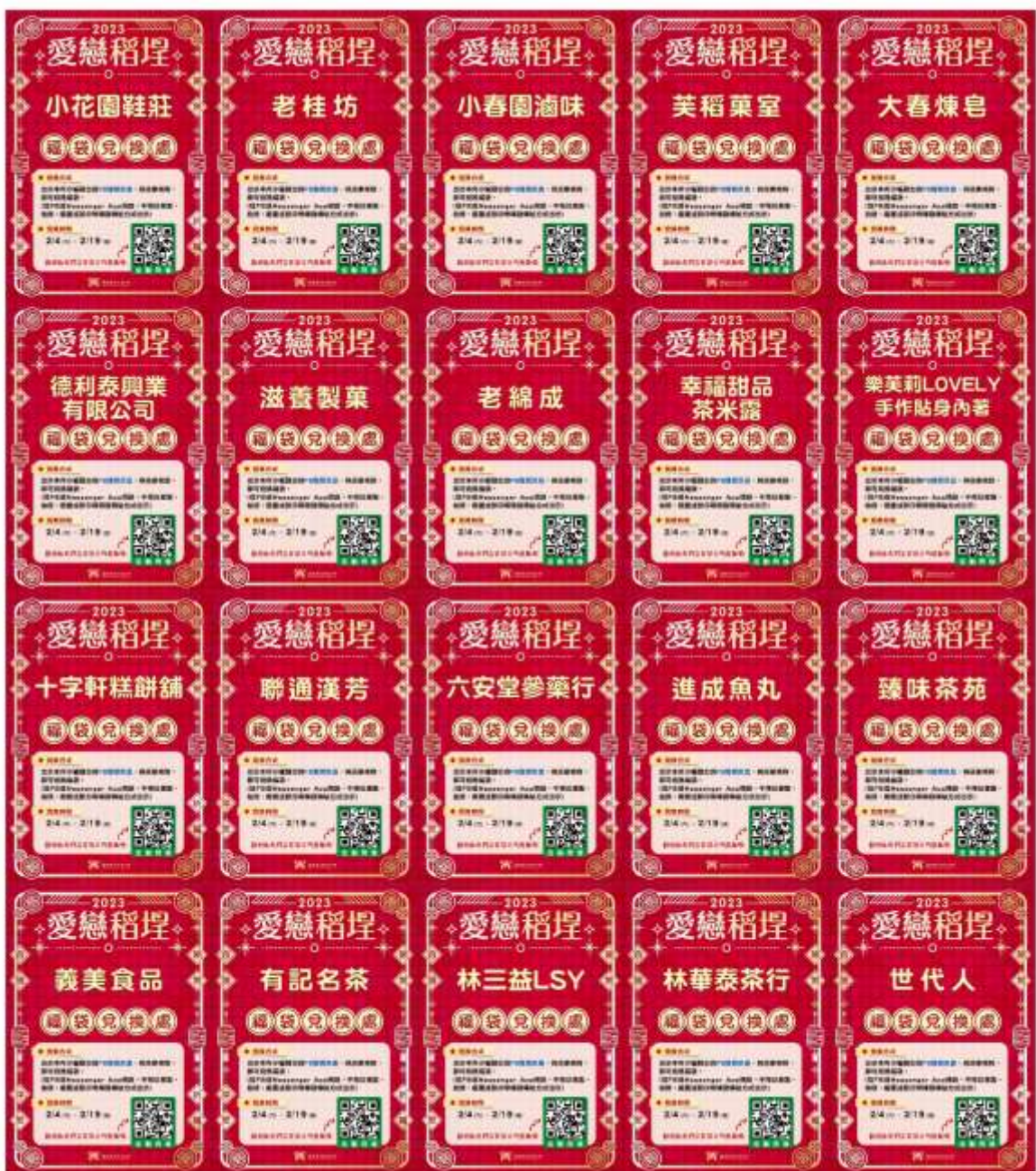
【店家兌換福袋宣傳立牌】