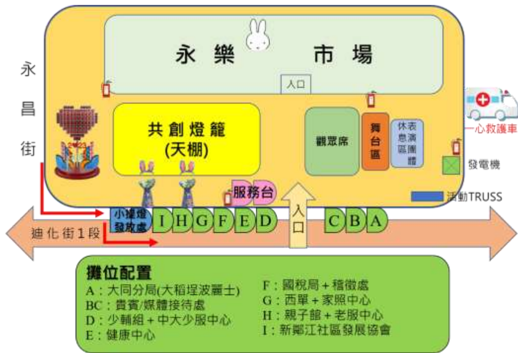
【永樂廣場平面配置圖】