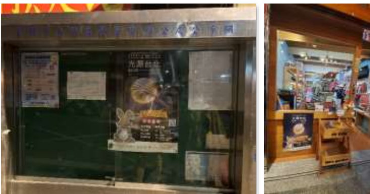
【里辦公處及店家協助張貼海報】