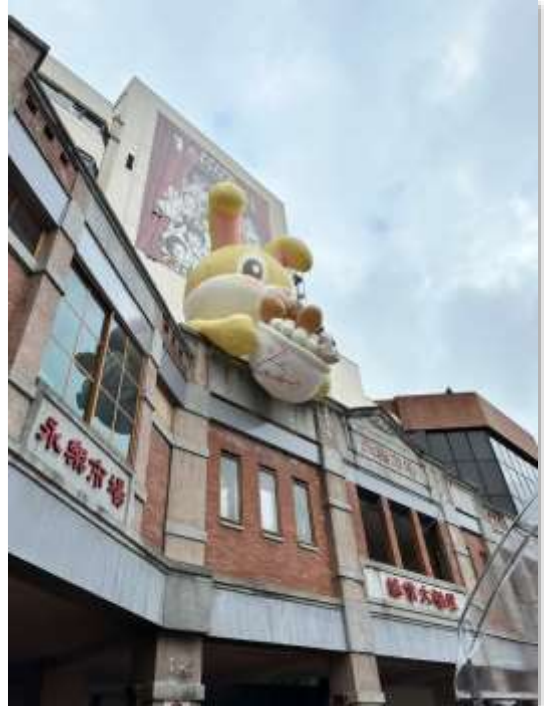
【共創燈籠/福氣萌兔】