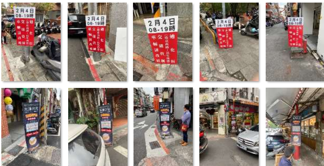
【上：交管告示牌/中：燈區指示牌/下：掛設情形】