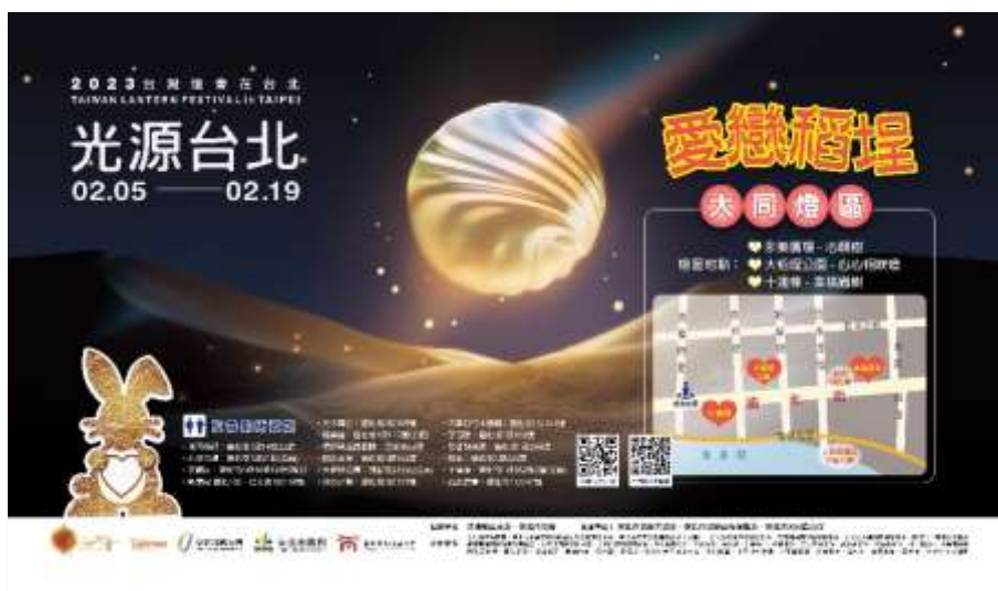
【TRUSS 帆布(上：永樂廣場/下：迪化民權西路口)】