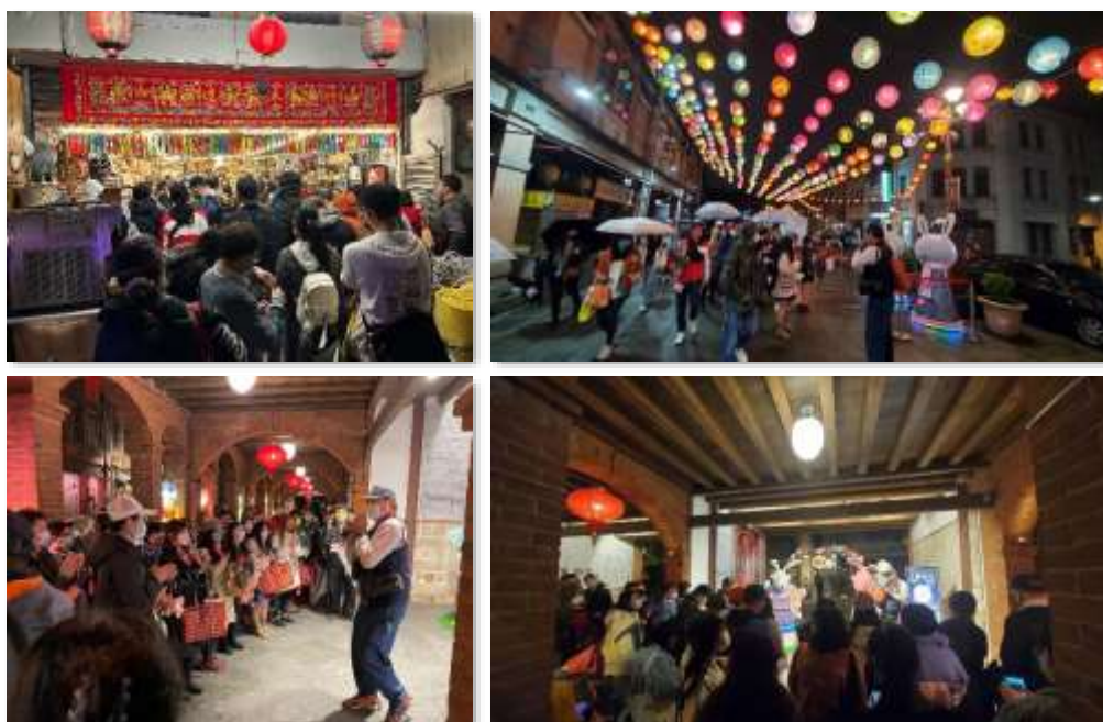
【霞海提燈夜遊大稻埕活動】