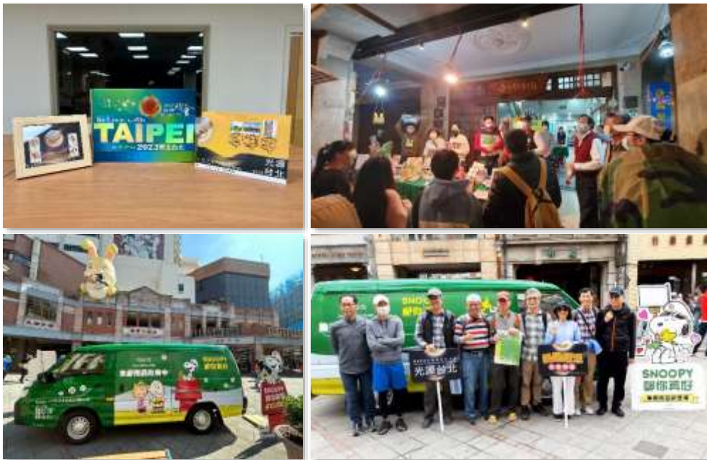
【臺北迪化郵局聯合行銷活動】