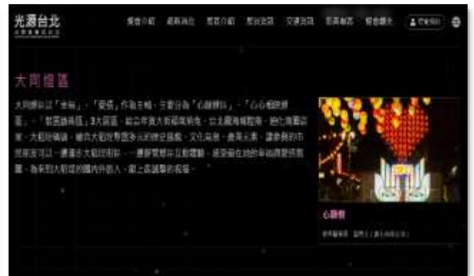
【光源台北官網宣傳】