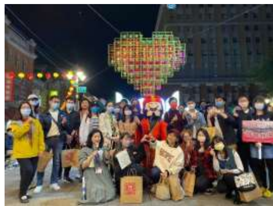
【大同區單身聯誼活動】