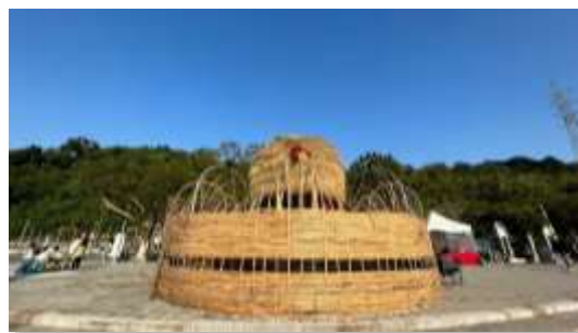
【「花之風帆」遊船體驗活動】