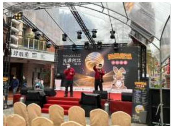
【延平分隊協助辦「自衛消防編組訓練」】