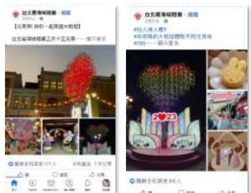
【台北霞海城隍廟宣傳】