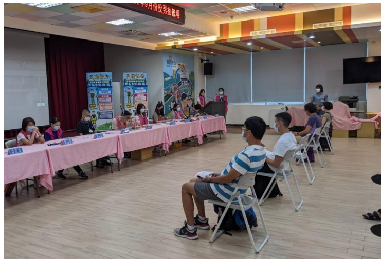
5. 111年民防團隊病媒蚊防治課程