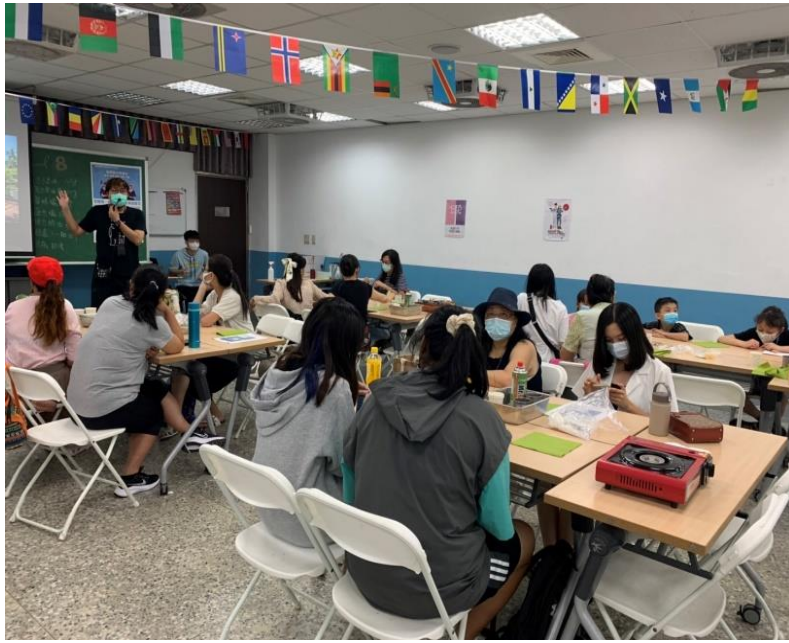
3. 新移民課程烹飪班