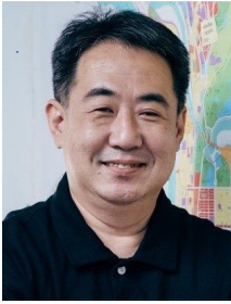
地政局局長 陳信良

【到職日】111年12月25日 【主要學歷】國立成功大學都市計劃學系研究所碩士、都市計劃學系畢業。 【主要經歷】臺北市政府都市發展局副總工程司、專門委員。臺北市都市更新處副處長。臺北市政府參議。臺北市都市更新處處長。臺北市政府副秘書長。 【考 試】99年薦任公務人員晉升簡任官等訓練。83年公務人員高等考試二級考試都市計畫類科。 【通訊處】臺北市市府路1號3樓西北區 【公務電話】27287312