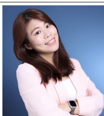
客委會 主任委員 周羿希

【到職日】111年12月25日 【主要學歷】國立政治大學民族學系碩士。國立臺北大學金融與合作經營學系畢業。 【主要經歷】臺北市政府原住民族事務委員會約僱人員、秘書。 【考試】 【通訊處】臺北市市府路1號探索館5樓 【公務電話】27205981