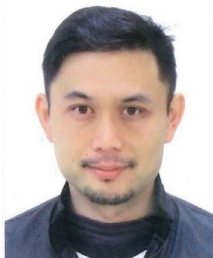
體育局局長 王泓翔

【到職日】111年12月25日 【主要學歷】國防大學戰爭學院89年班。陸軍軍官學校69年班。 【主要經歷】憲兵司令部上校計劃處長、上校副參謀長、上校督察長。憲兵203指揮部(中部地區)少將指揮官。 【考 試】 【通訊處】臺北市羅斯福路四段92號9樓 【公務電話】23684605