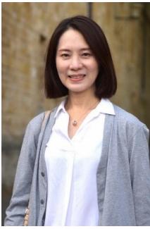
財政局局長 胡曉嵐