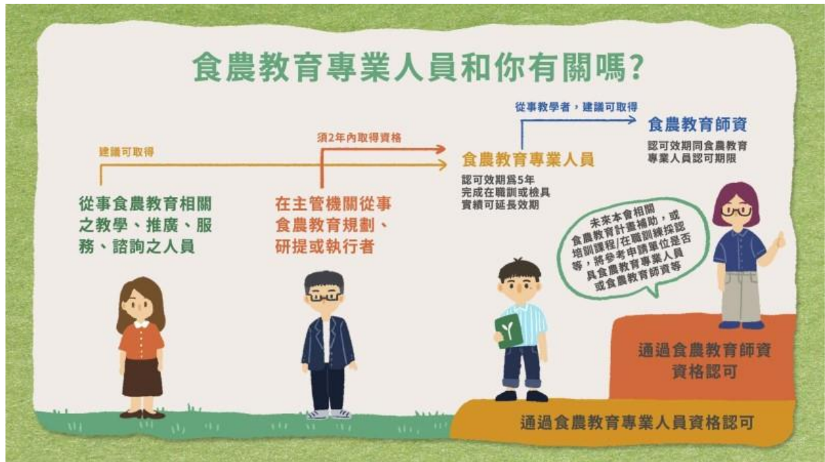
▼附圖 1. 食農教育專業人員資格採認說明