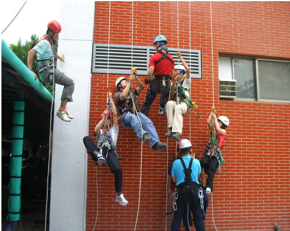
照片 6：高空繩索作業教育訓練

3、發行勞動安全電子報：透過每月定期發行勞動安全電子報及不定期之即時勞動安全電子報，建立勞工安全衛生工作管理人員、勞工與勞動檢查處間之夥伴關係，期許「勞動安全電子報」成為勞動檢查處、事業單位和安全衛生人員的一個資訊平台，提供交流互動與技術成長的媒介，共同提升安全衛生意識。自 97 年 1 月起至 99 年 4 月止共發行勞動安全電子報 28 期，發送 132,211 人次；即時勞動安全電子報 158 期，發送 867,335 人次。