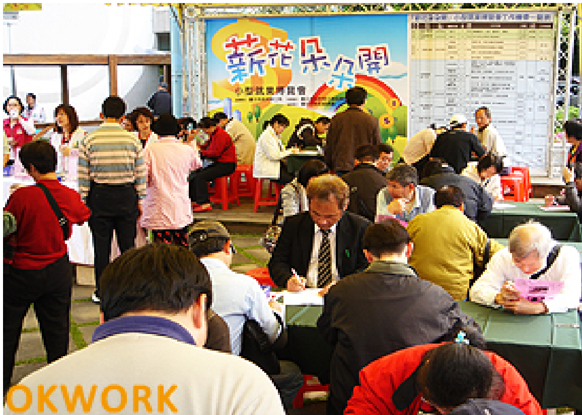
照片 3：99.3.12「“薪”花朵朵開」小型就業博覽會