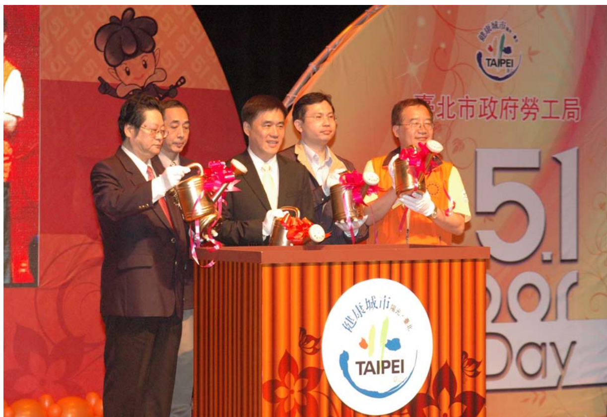
照片 2：99.4.22「臺北市 99 年度五一勞動節慶祝及表揚活動」揭幕式

位得獎者。會中安排精彩的表演活動與摸彩，會後舉辦勞工之夜餐敘，讓得獎者在輕鬆、愉悅的餐宴中交流彼此的工作經驗。(如照片 2)