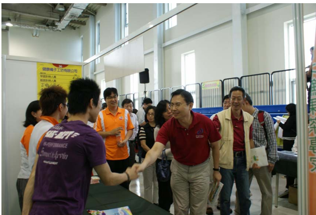
照片 4：99.3.20「啟動引擎 創”薪”價值」大型就業博覽會