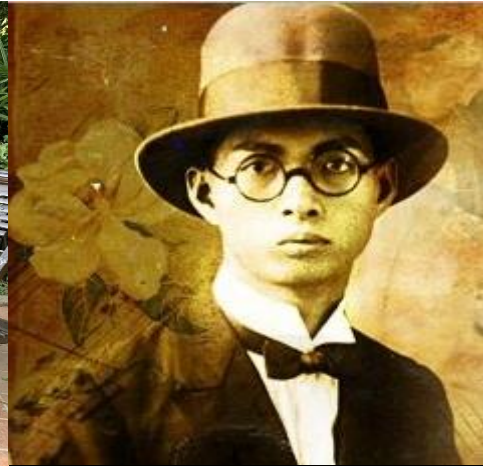
望春風作曲~鄧雨賢