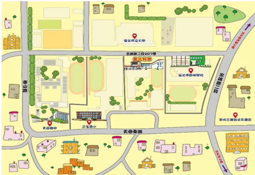
臺北市立臺北特殊教育學校交通路線圖

捷 運：芝山捷運站下車後，步行至忠誠路忠誠公園公車站，搭乘公車 203、279、606、616、685、紅 12、敦化幹線(原 285)至市立臺北特教學校站。