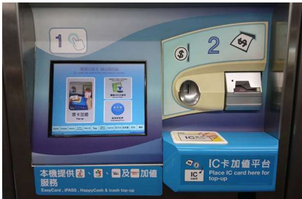
照片 1 捷運車站自動售票充值機提供 11 國語言服務