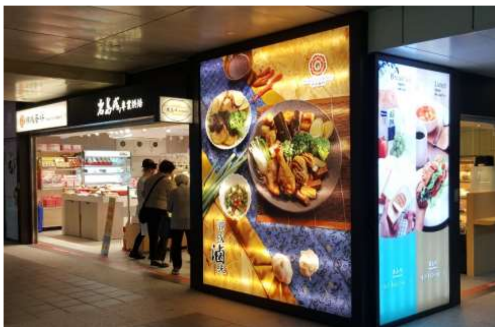
照片 2 臺北車站新設商業空間