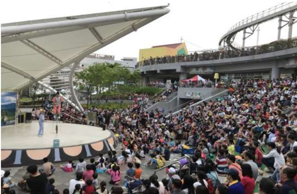
照片 5 兒童節慶祝活動