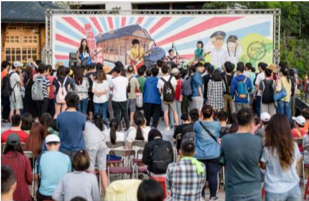
照片 4 北投主題音樂活動-春遊驛站鬧哄哄