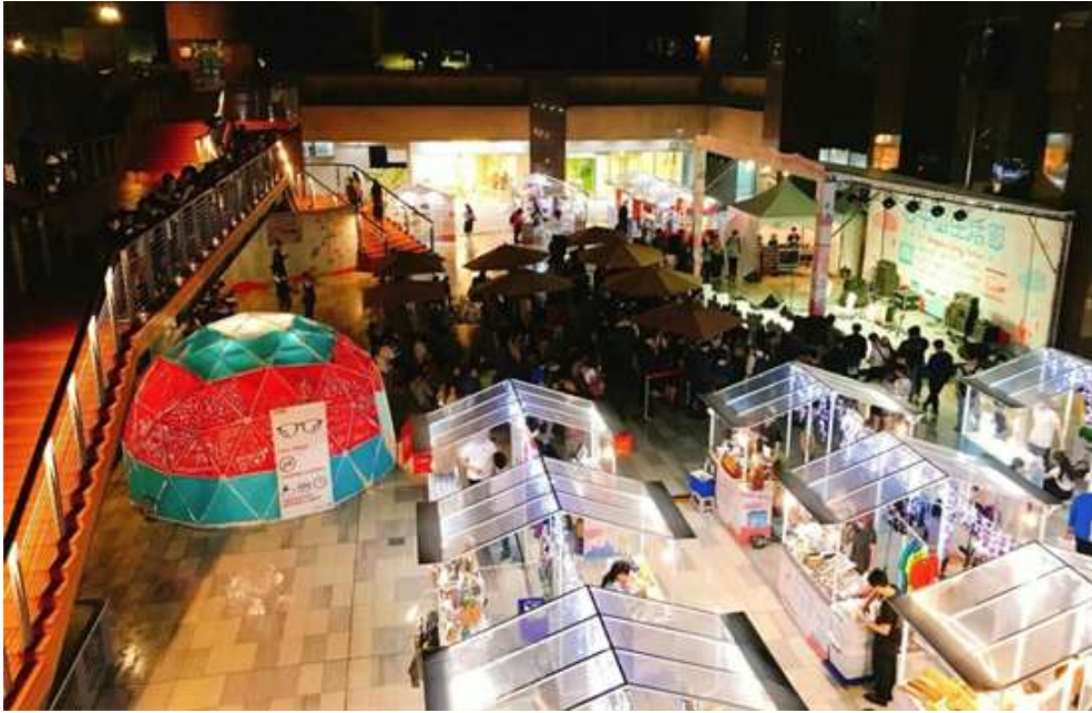
照片 3 心中山生活節