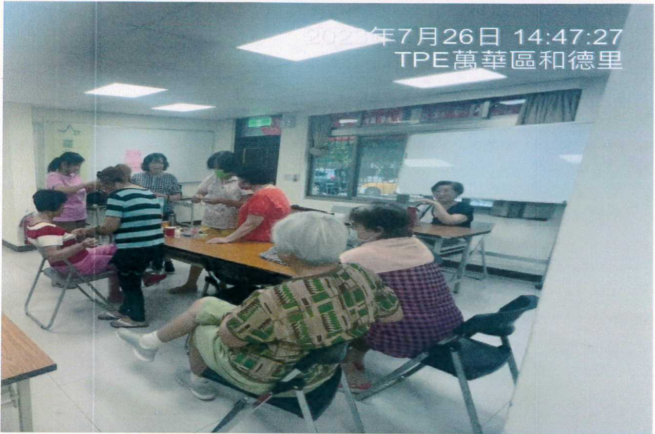
說明：教室1使用情形