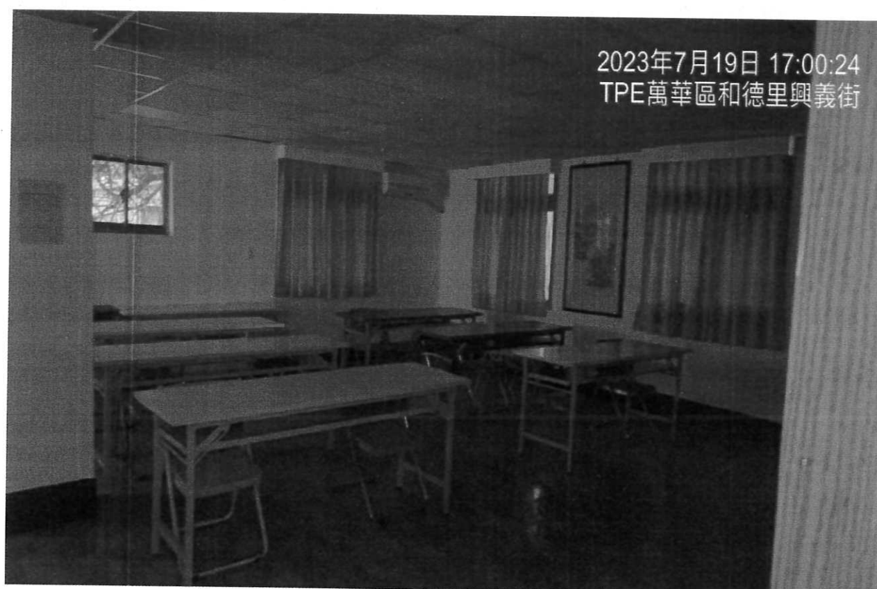
說明：教室2使用情形