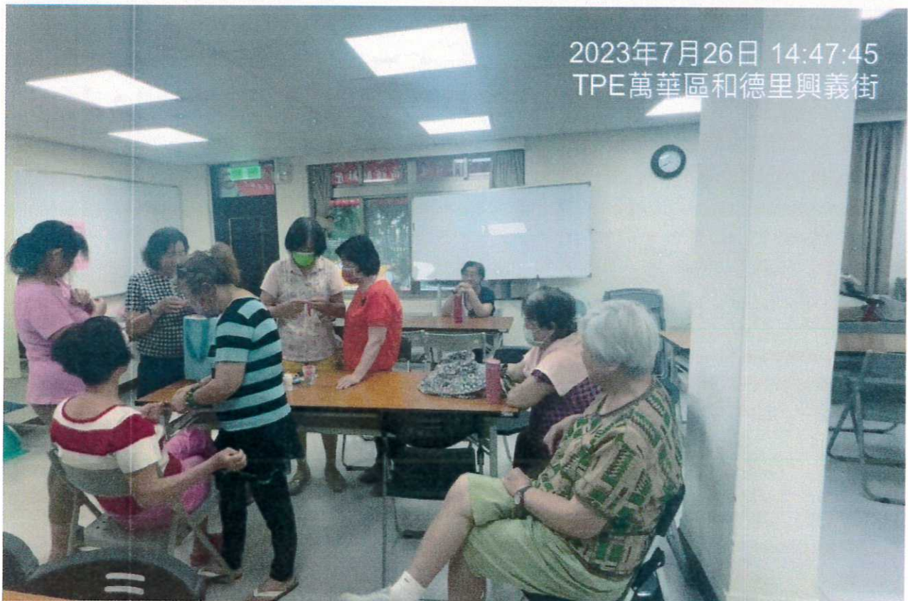
說明：教室1使用情形