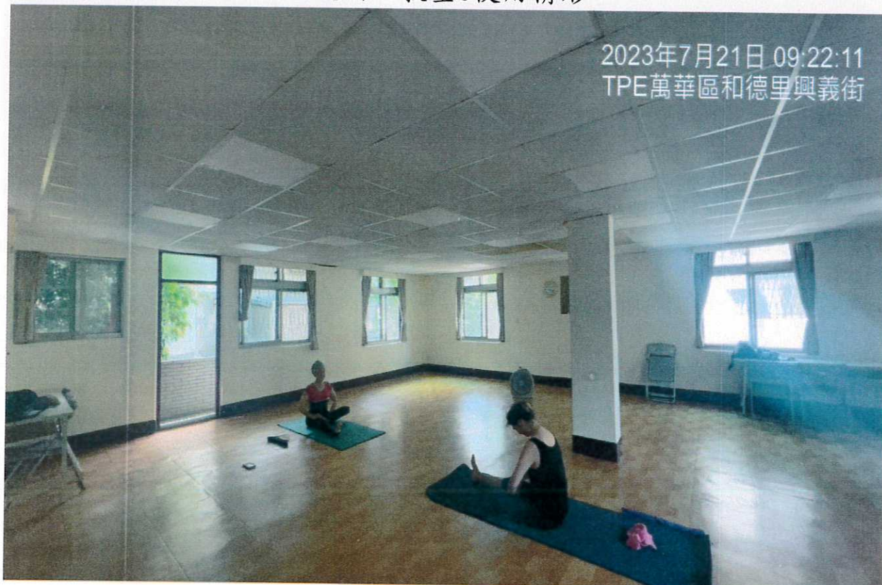
說明：教室3使用情形