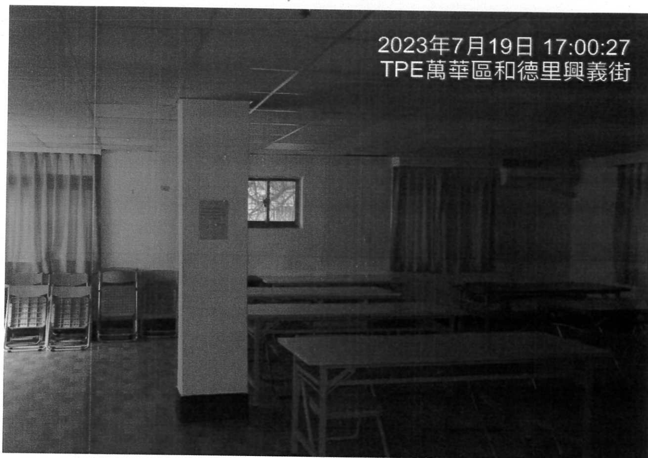
說明：教室2使用情形