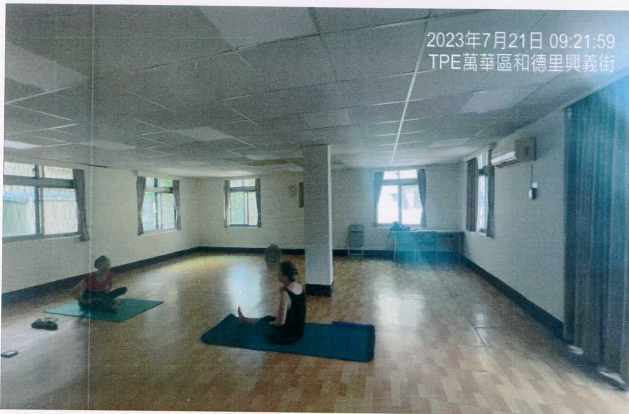
說明：教室3使用情形