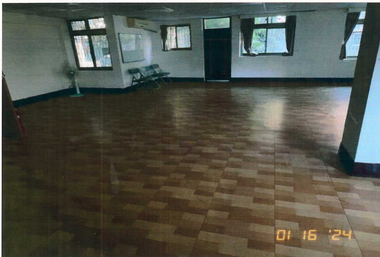
說明：教室3使用情形