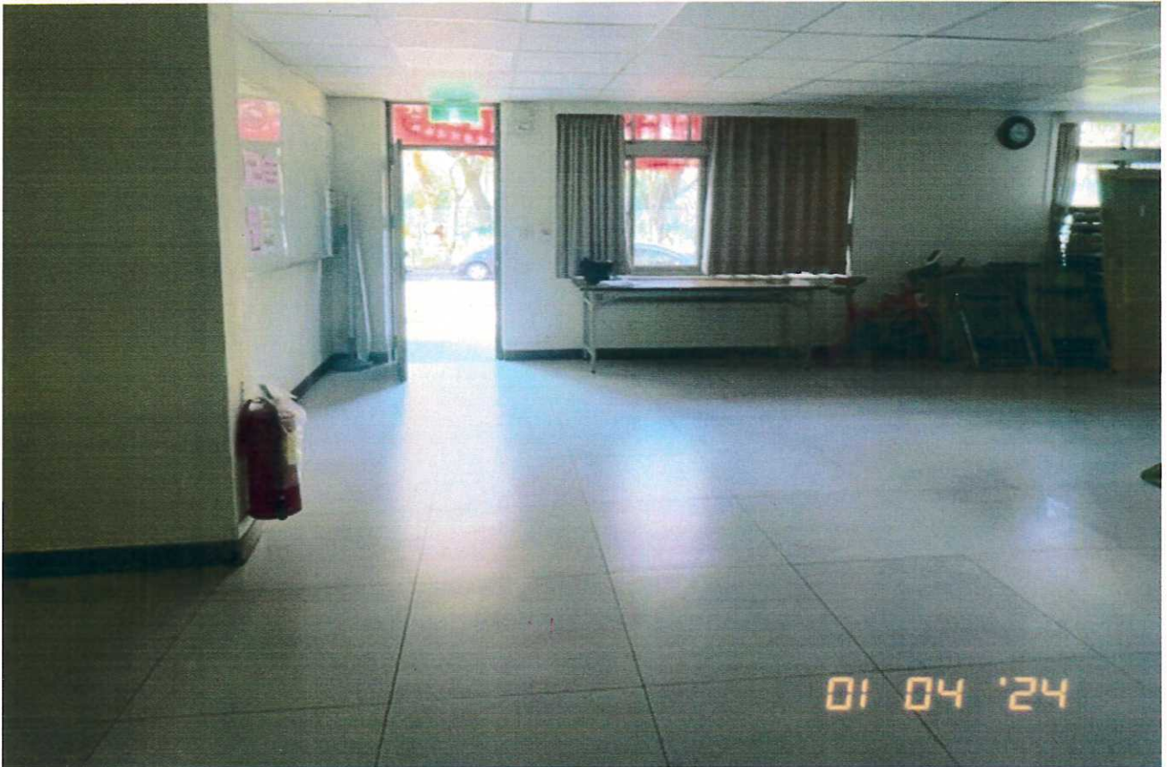
說明：教室1使用情形