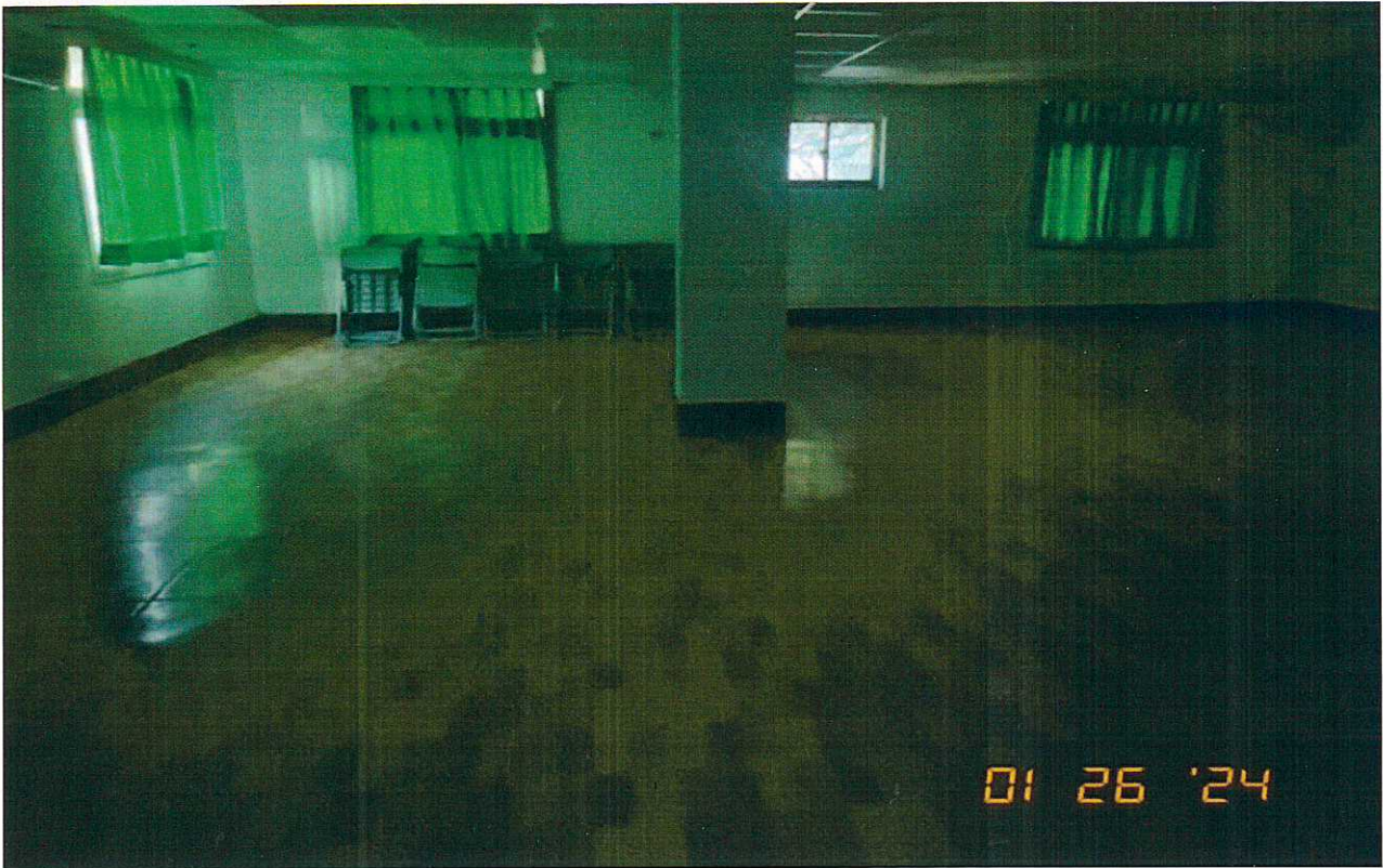
說明：教室2使用情形