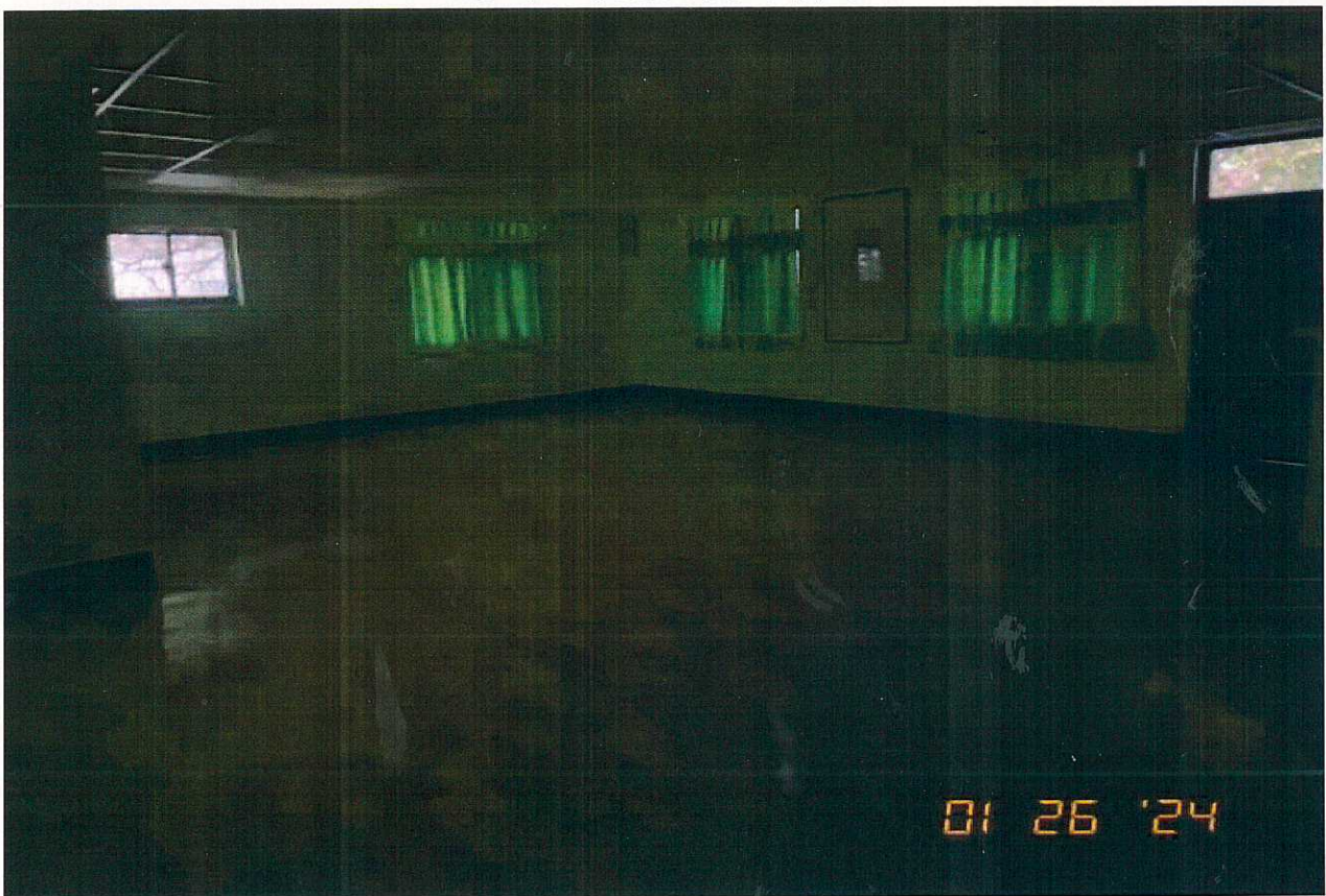
說明：教室2使用情形