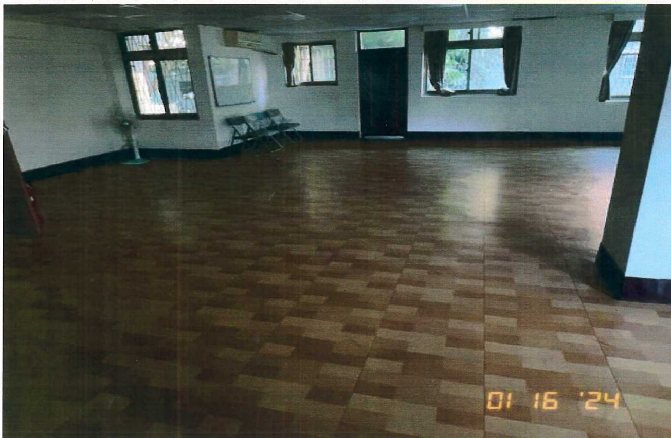
說明：教室3使用情形