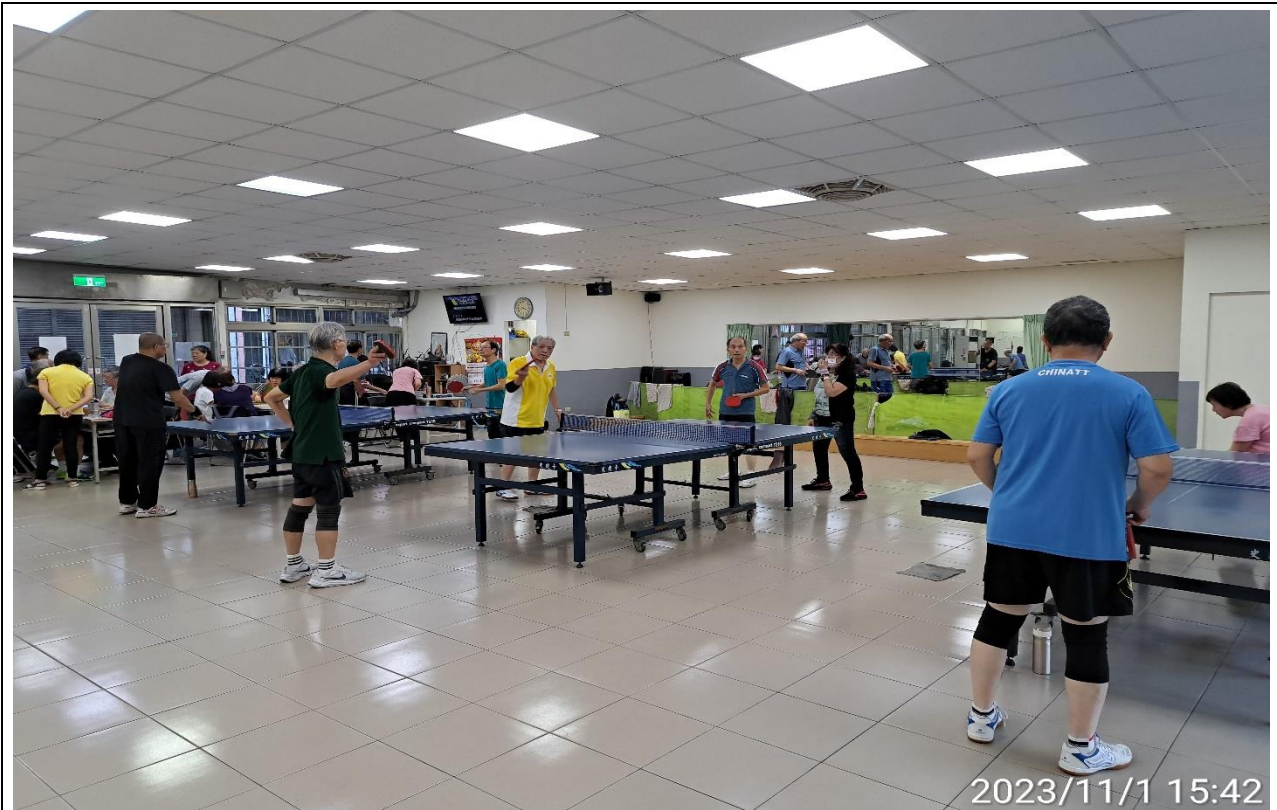
說明：萬大第二區民活動中心興德里長青會使用情形