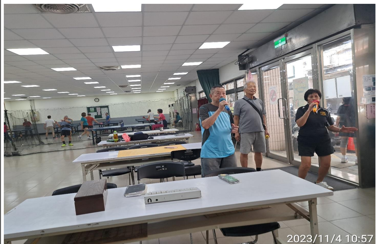
說明：萬大第二區民活動中心華中里長青會使用情形