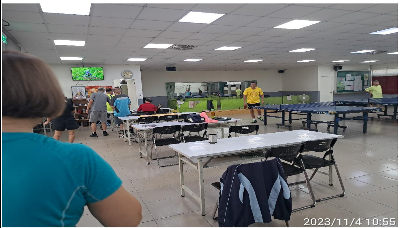
說明：萬大第二區民活動中心華中里長青會使用情形