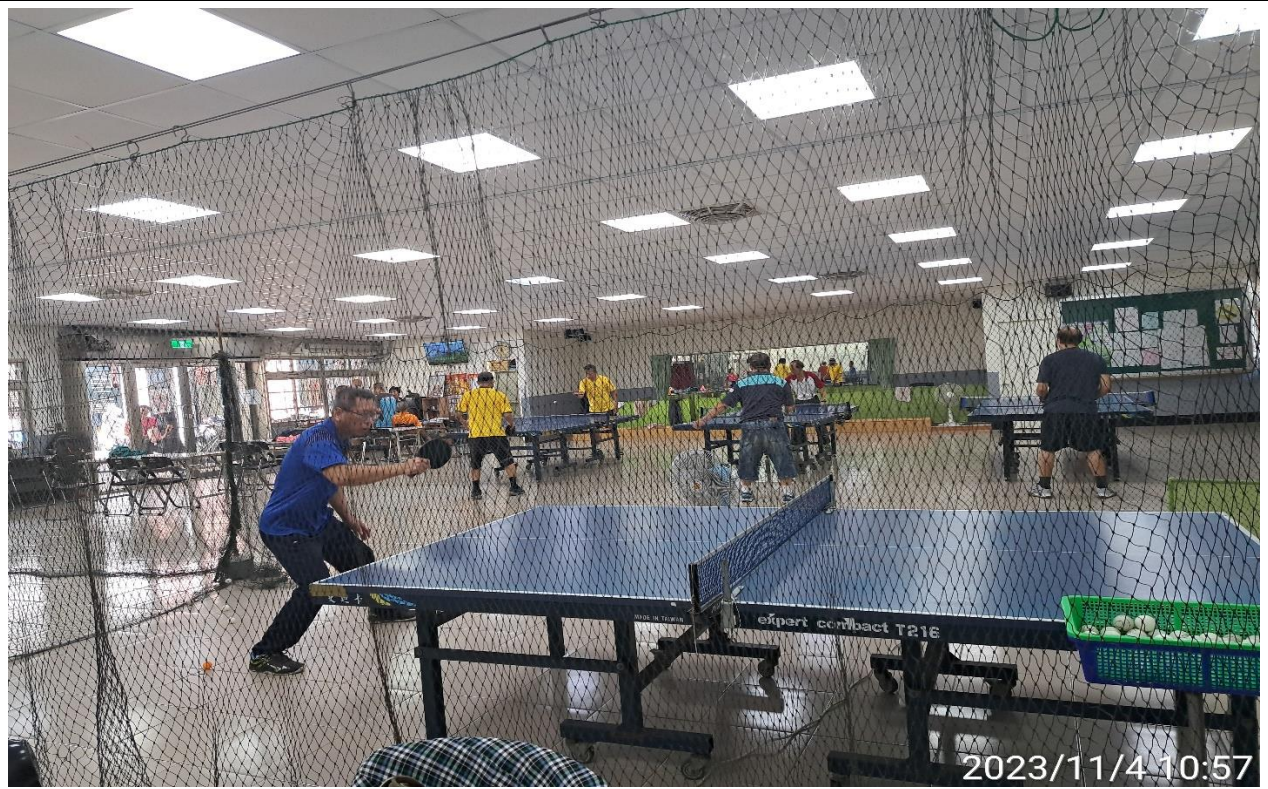
說明：萬大第二區民活動中心華中里長青會使用情形