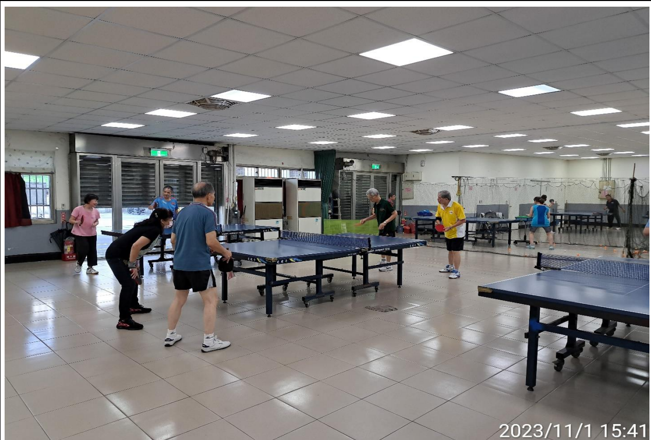
說明：萬大第二區民活動中心興德里長青會使用情形