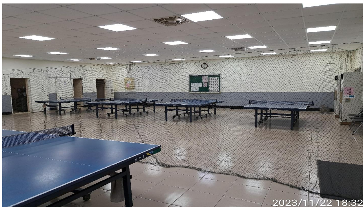
說明：無人使用情形