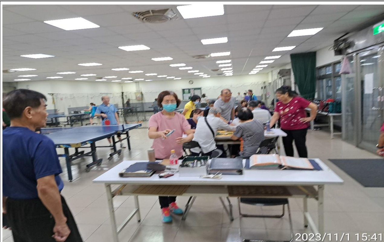
說明：萬大第二區民活動中心興德里長青會使用情形