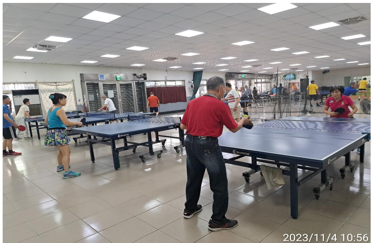
說明：萬大第二區民活動中心華中里長青會使用情形