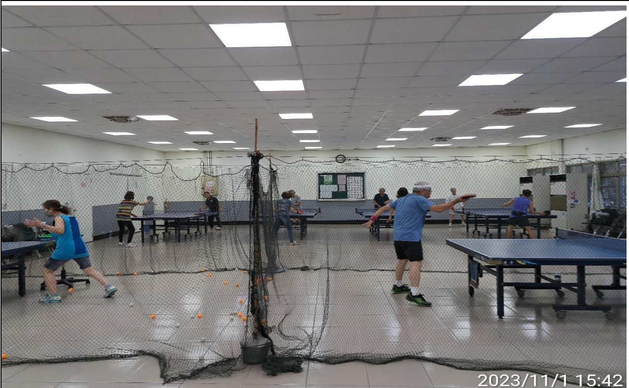
說明：萬大第二區民活動中心興德里長青會使用情形