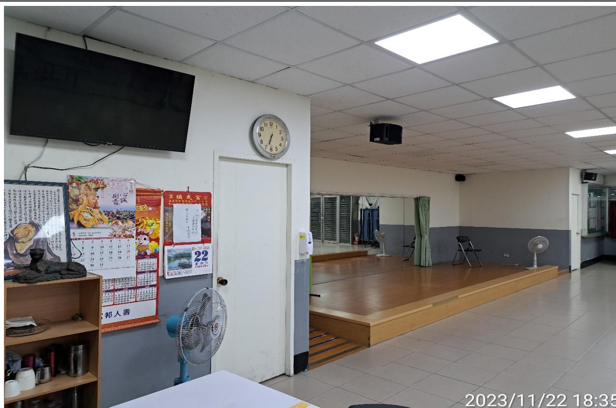
說明：無人使用情形