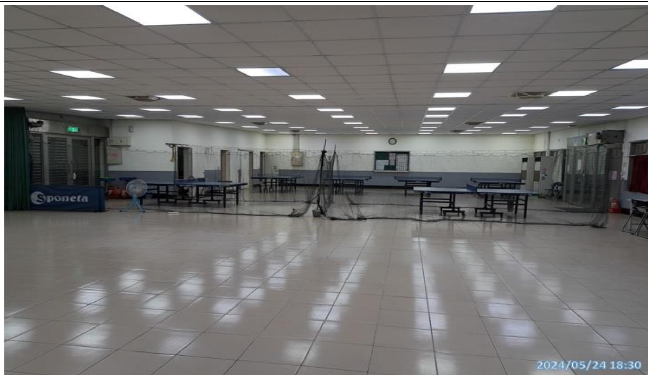
說明：無人使用情形