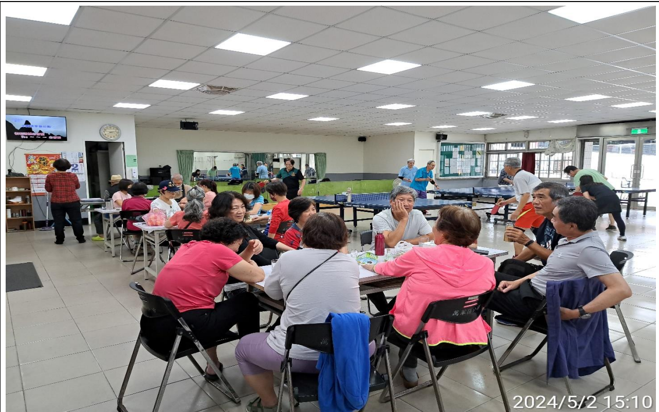
說明：萬大第二區民活動中心興德里長青會使用情形