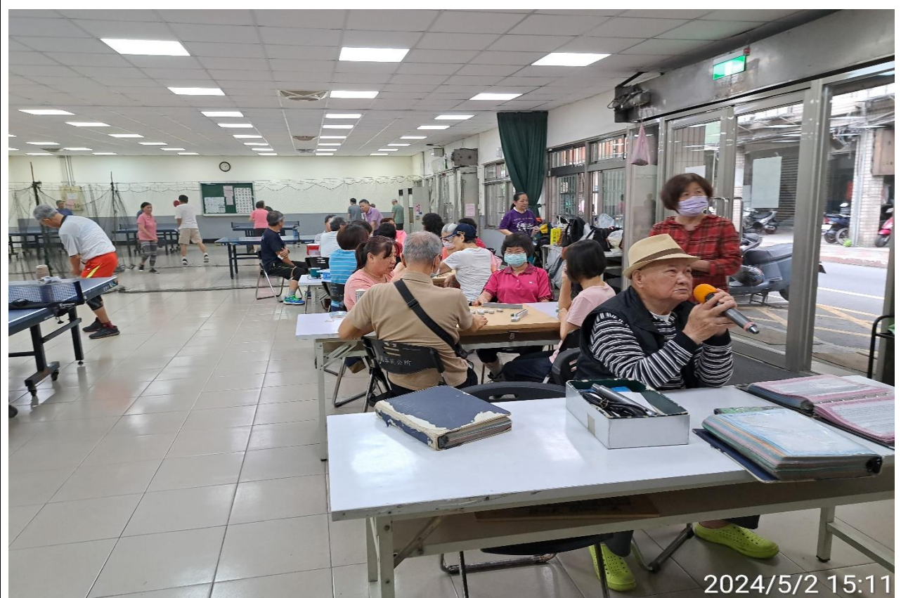
說明：萬大第二區民活動中心興德里長青會使用情形