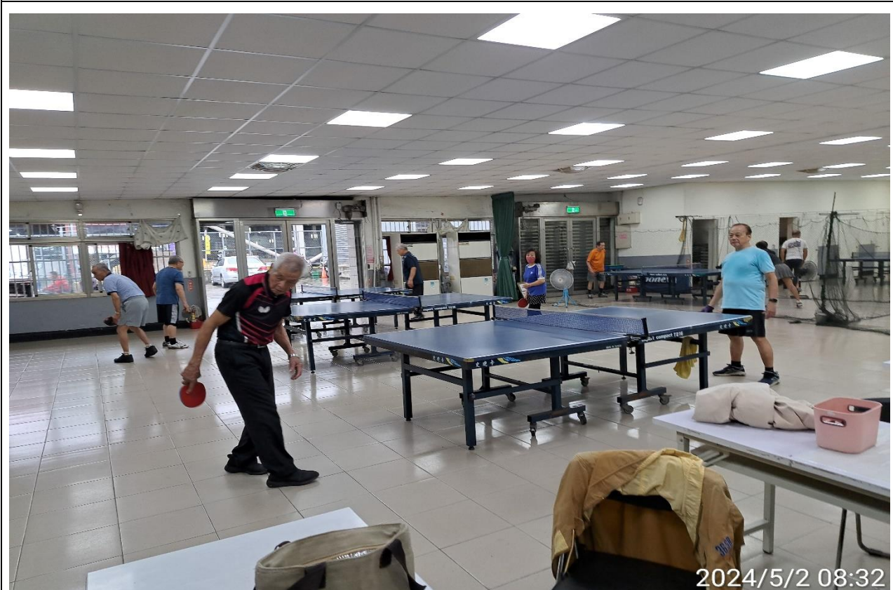
說明：萬大第二區民活動中心華中里長青會使用情形