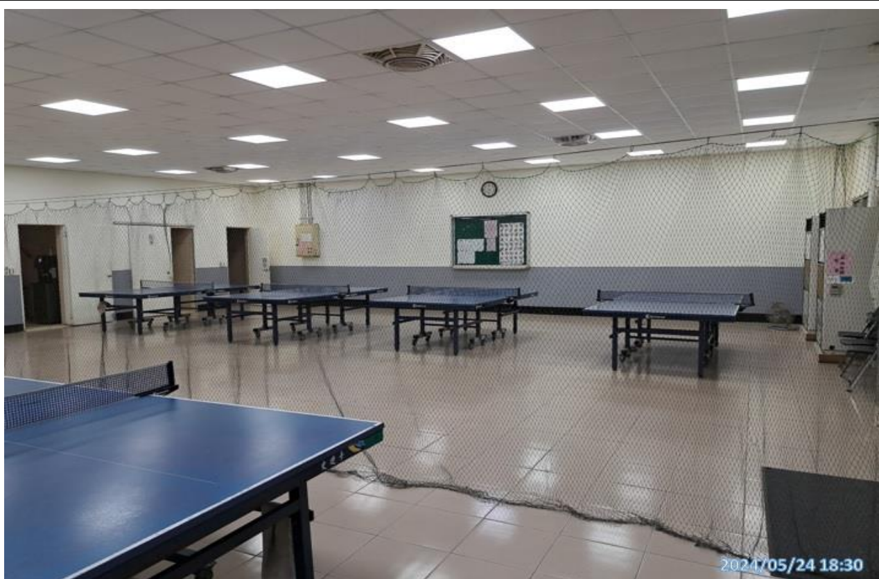
說明：無人使用情形