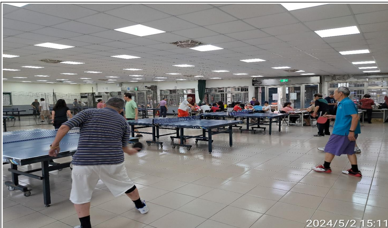
說明：萬大第二區民活動中心興德里長青會使用情形