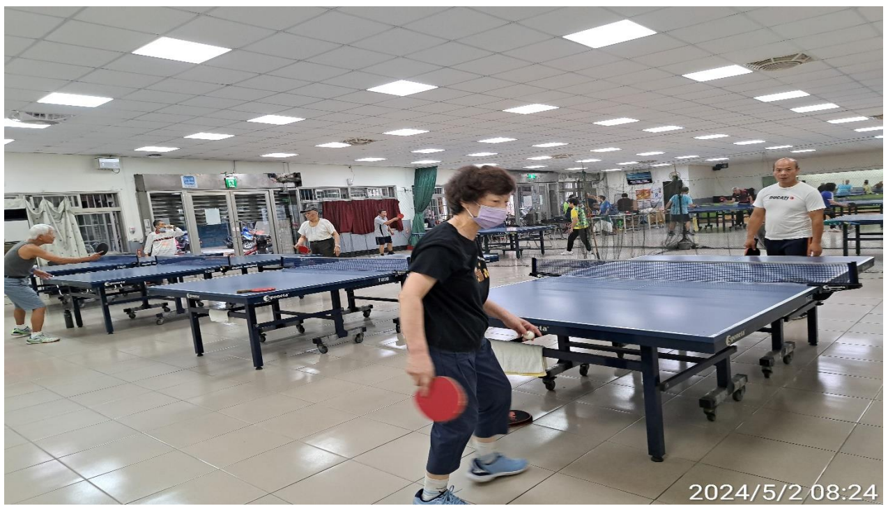
說明：萬大第二區民活動中心華中里長青會使用情形