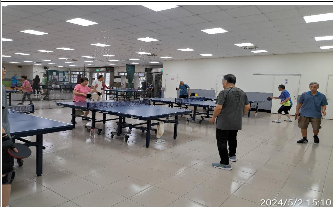
說明：萬大第二區民活動中心興德里長青會使用情形