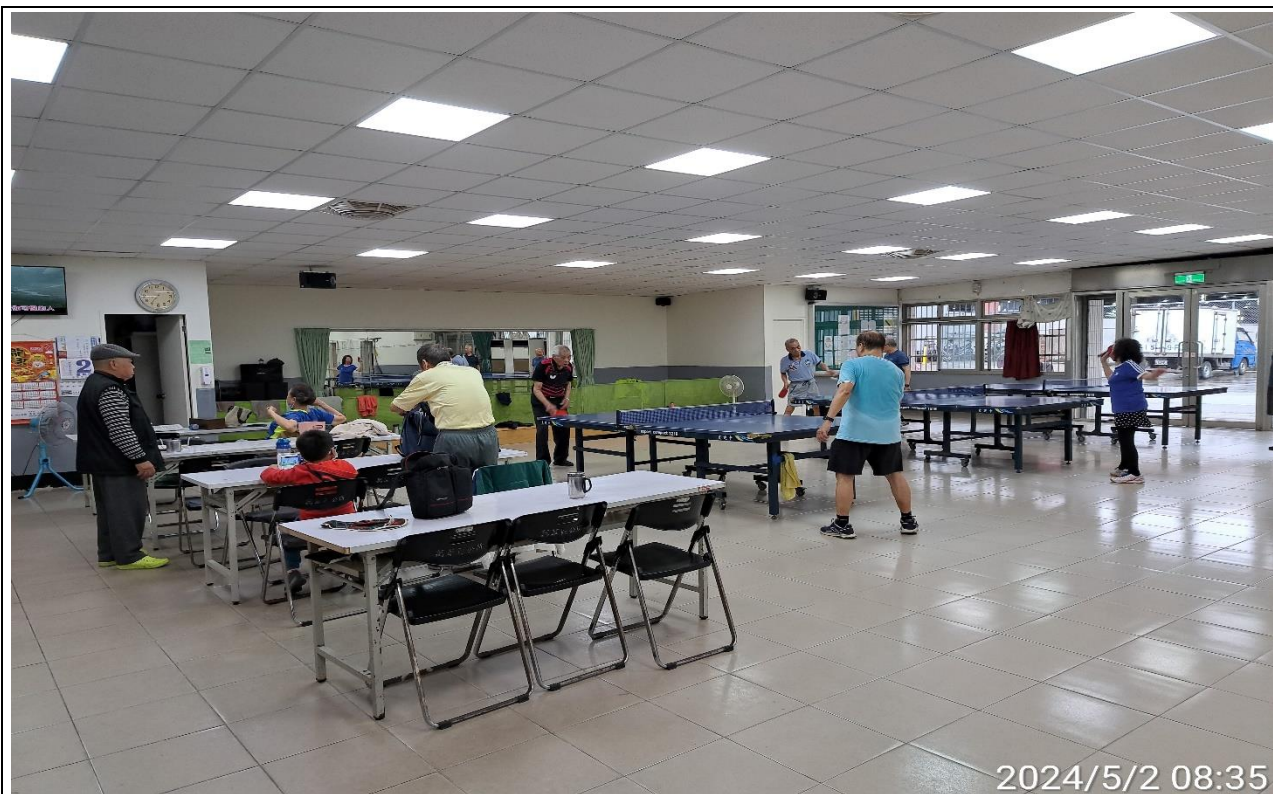
說明：萬大第二區民活動中心華中里長青會使用情形