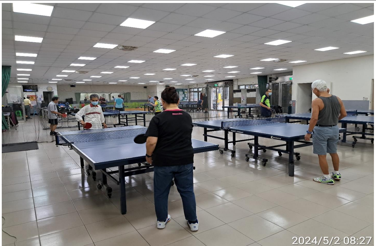
說明：萬大第二區民活動中心華中里長青會使用情形