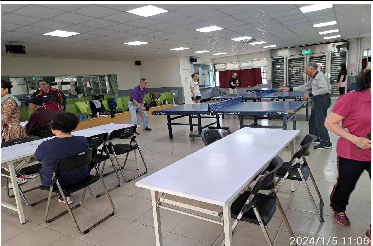
說明：萬大第二區民活動中心華中里長青會使用情形