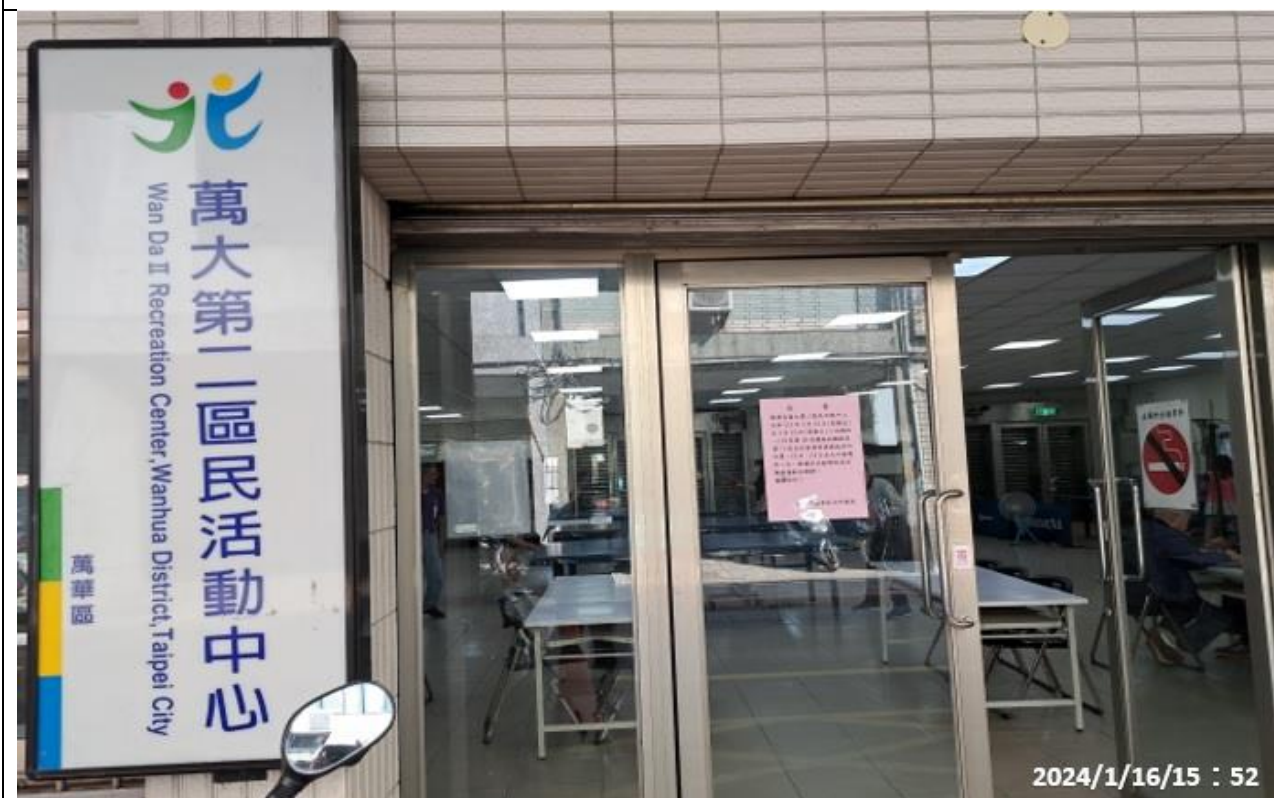
說明：萬大第二區民活動中心興德里長青會使用情形