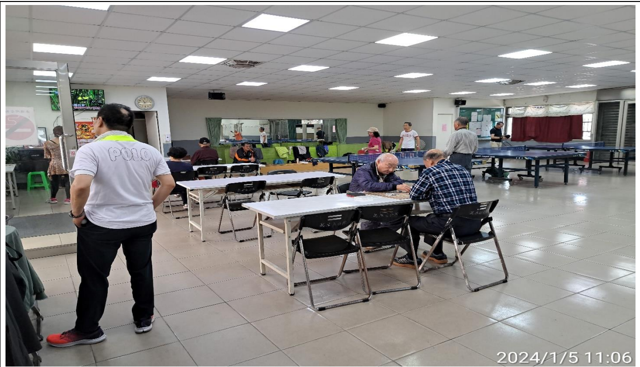
說明：萬大第二區民活動中心華中里長青會使用情形