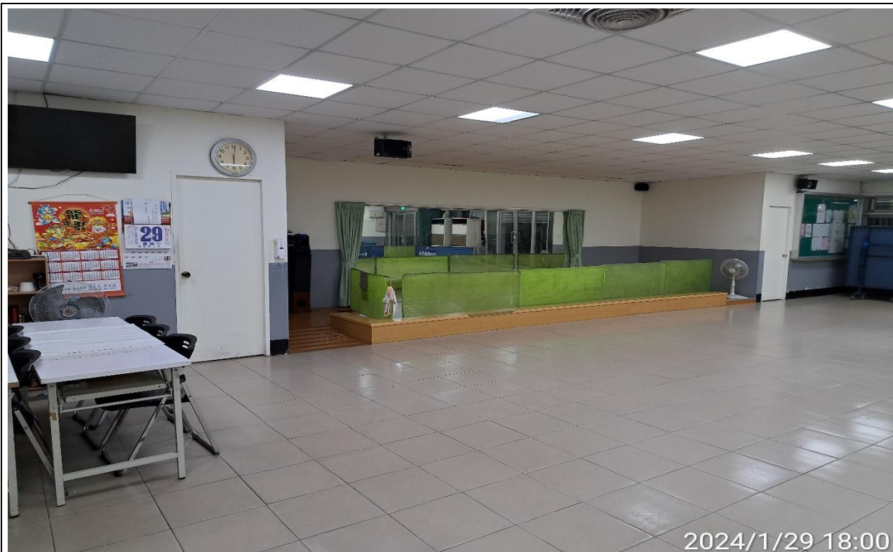
說明：無人使用情形