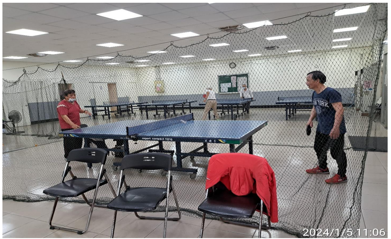
說明：萬大第二區民活動中心華中里長青會使用情形