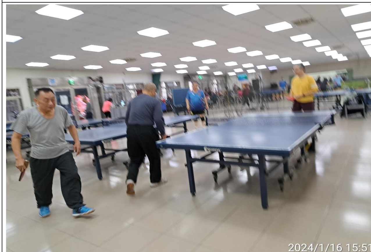
說明：萬大第二區民活動中心興德里長青會使用情形