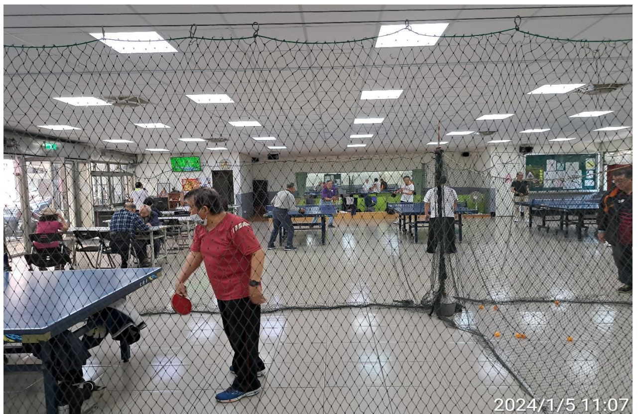
說明：萬大第二區民活動中心華中里長青會使用情形