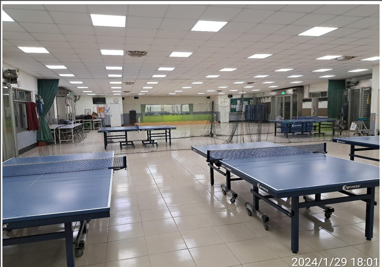
說明：無人使用情形