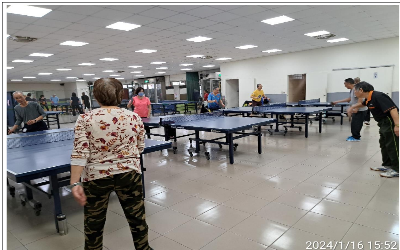
說明：萬大第二區民活動中心興德里長青會使用情形