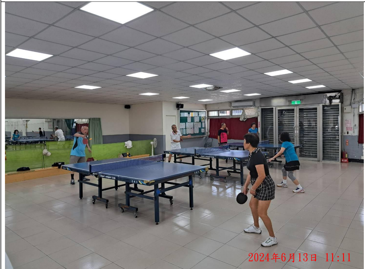
說明：萬大第二區民活動中心 華中里長青班隊 - 桌球