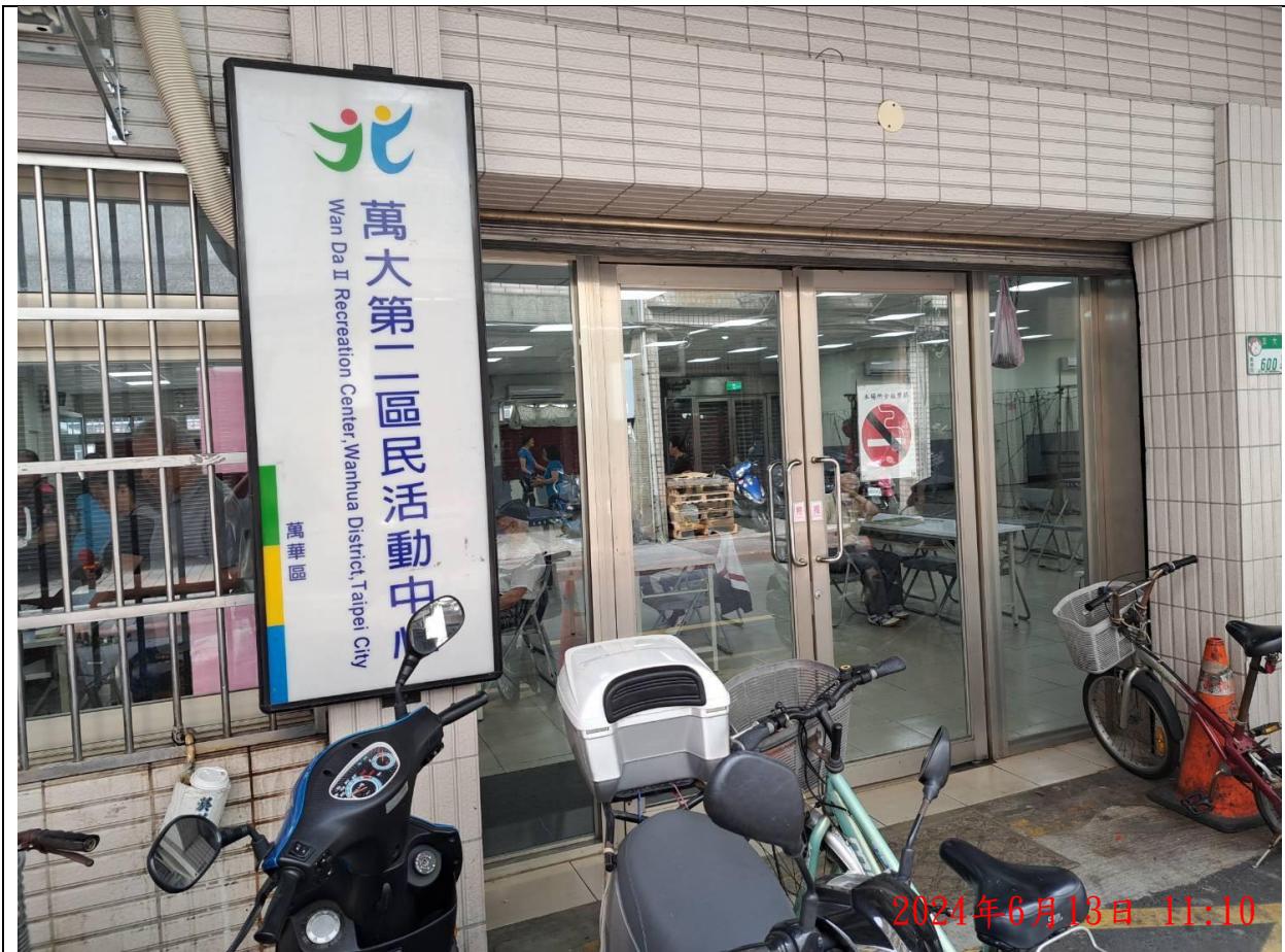
說明：萬大第二區民活動中心 門口