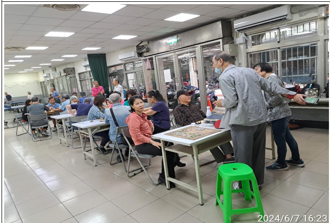
說明：萬大第二區民活動中心興德里長青會使用情形