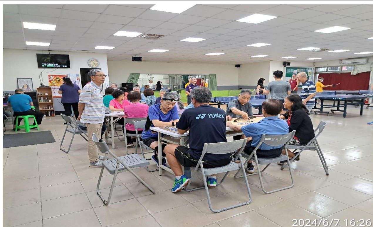
說明：萬大第二區民活動中心興德里長青會使用情形