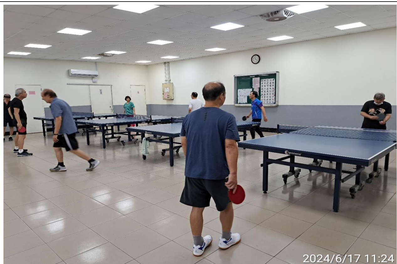
說明：萬大第二區民活動中心華中里長青會使用情形