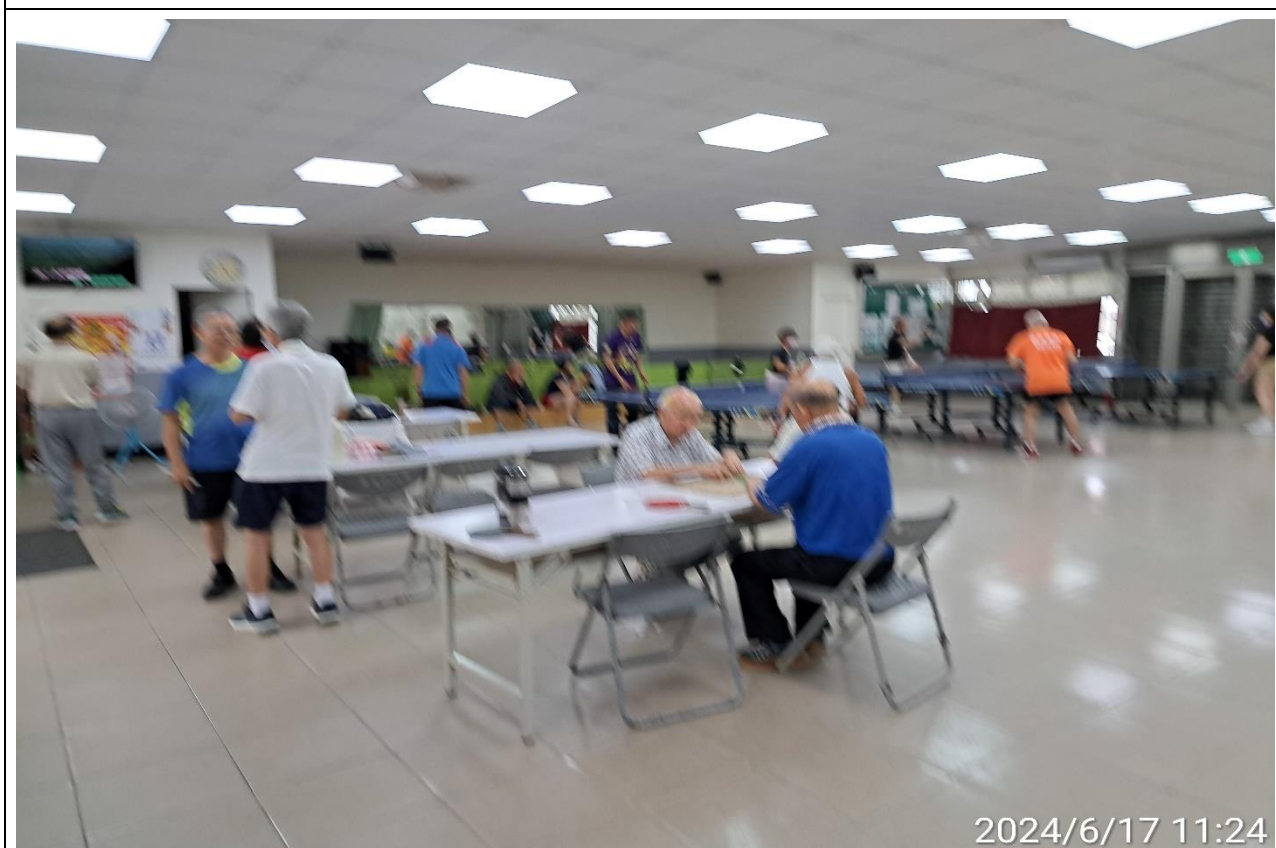
說明：萬大第二區民活動中心華中里長青會使用情形