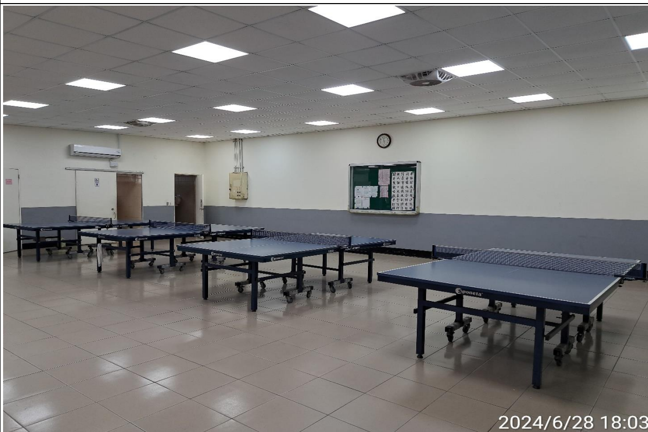
說明：無人使用情形