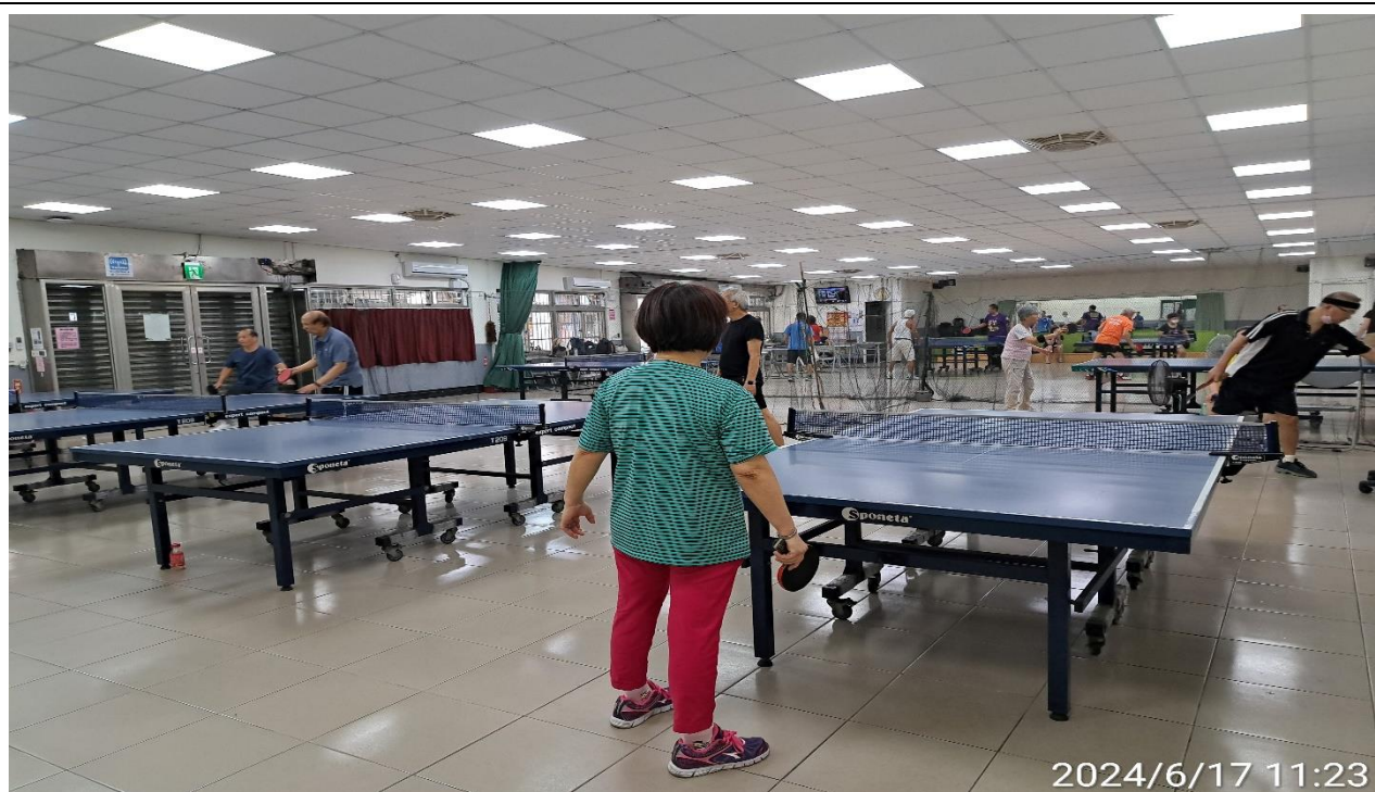
說明：萬大第二區民活動中心華中里長青會使用情形