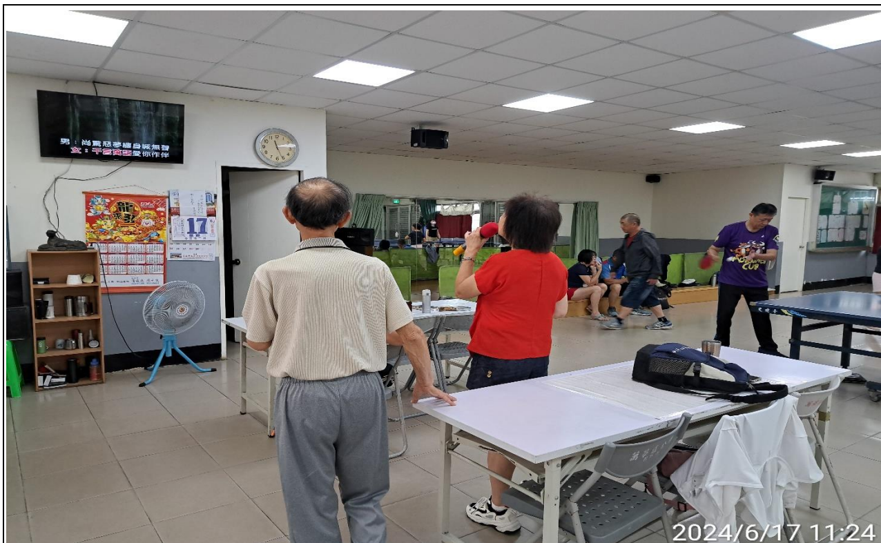
說明：萬大第二區民活動中心華中里長青會使用情形