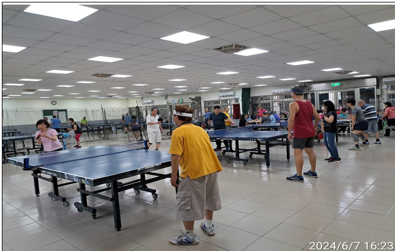
說明：萬大第二區民活動中心興德里長青會使用情形