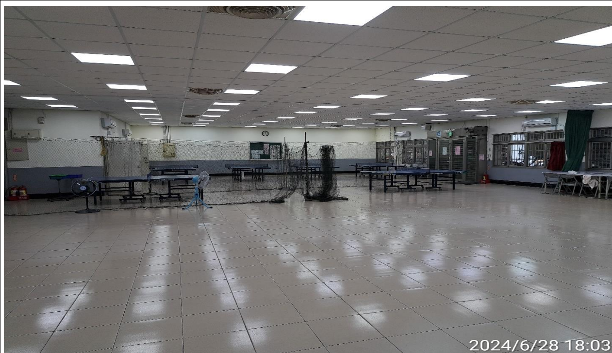
說明：無人使用情形