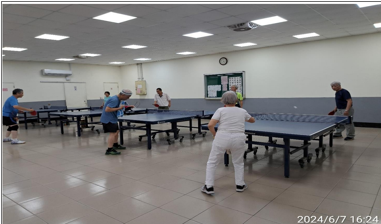
說明：萬大第二區民活動中心興德里長青會使用情形