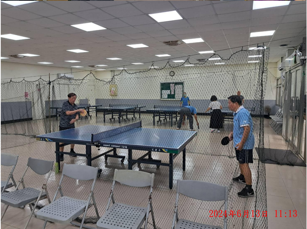
說明：萬大第二區民活動中心 卡拉OK 桌球活動