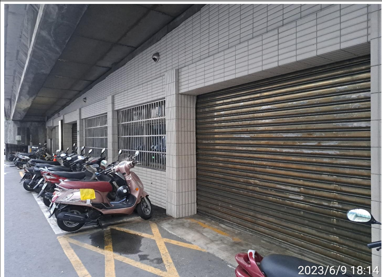
說明：無人使用情形