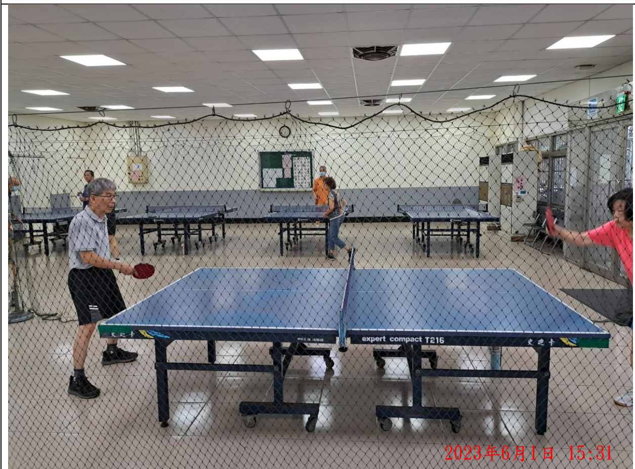
說明：萬大第二區民活動中心 興德長青班隊 - 桌球