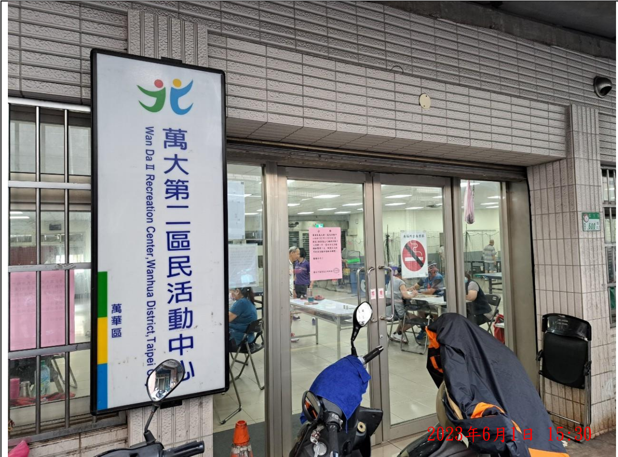
說明：萬大第二區民活動中心 門口