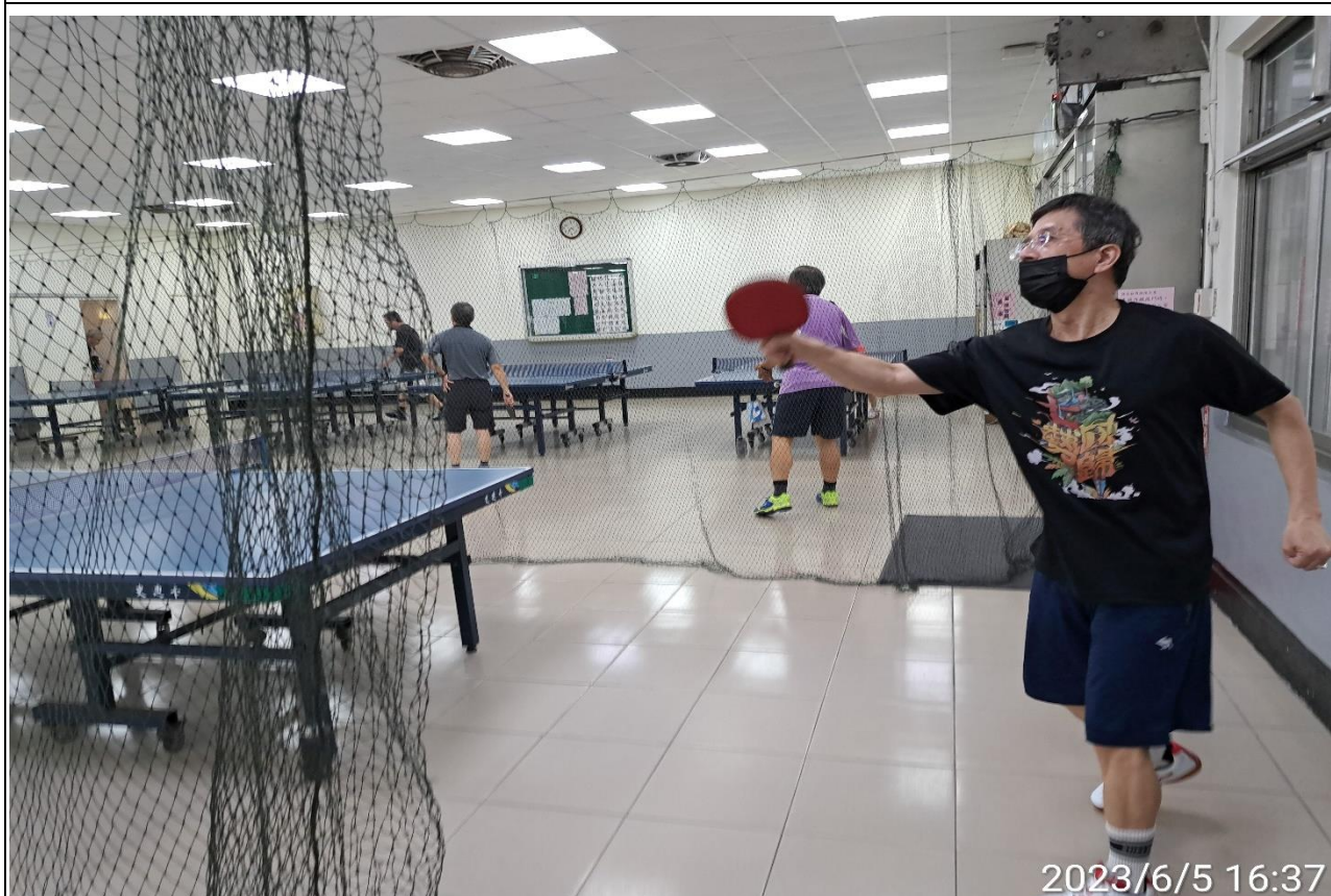
說明：萬大第二區民活動中心興德里長青會使用情形