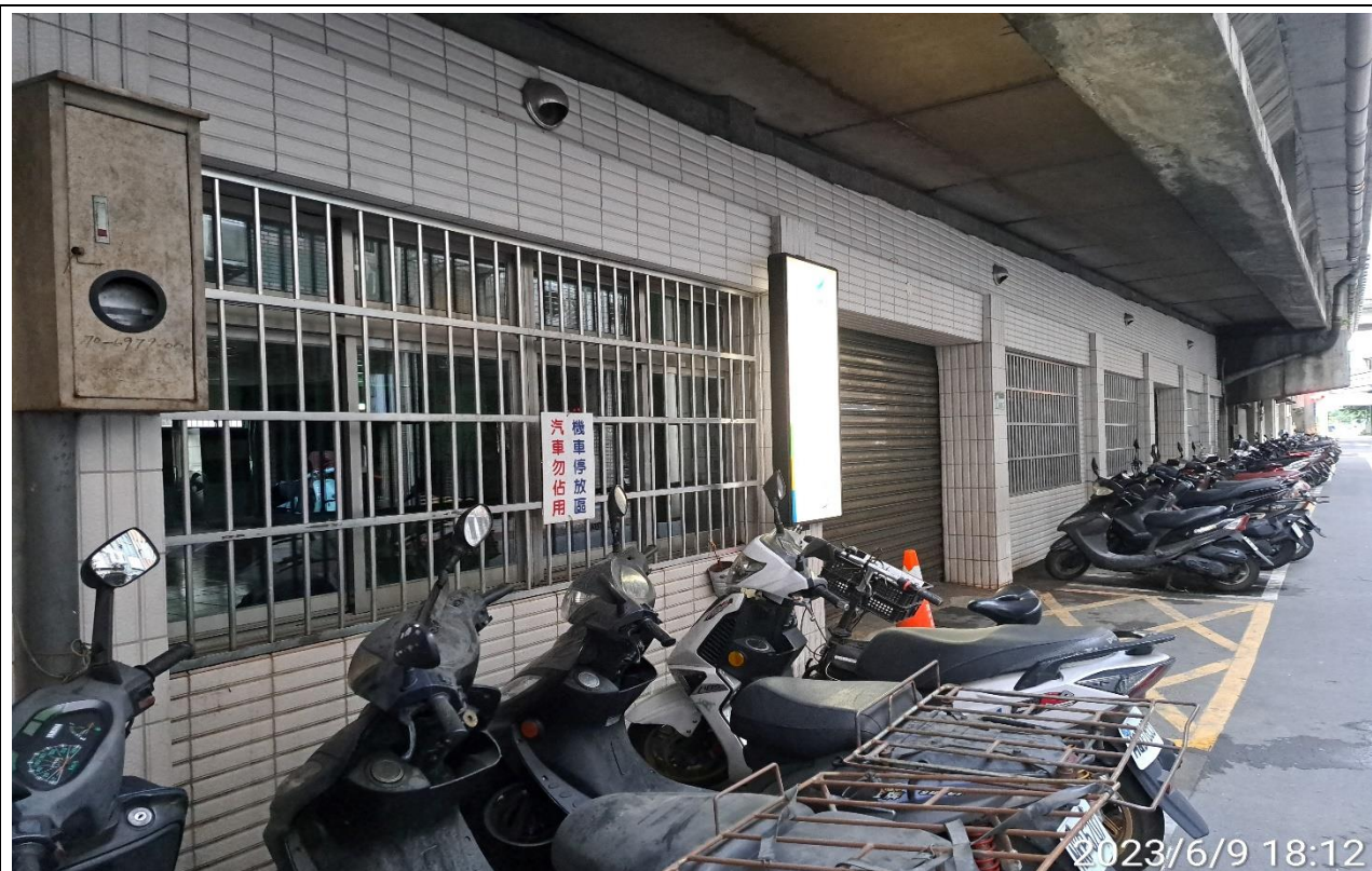
說明：無人使用情形