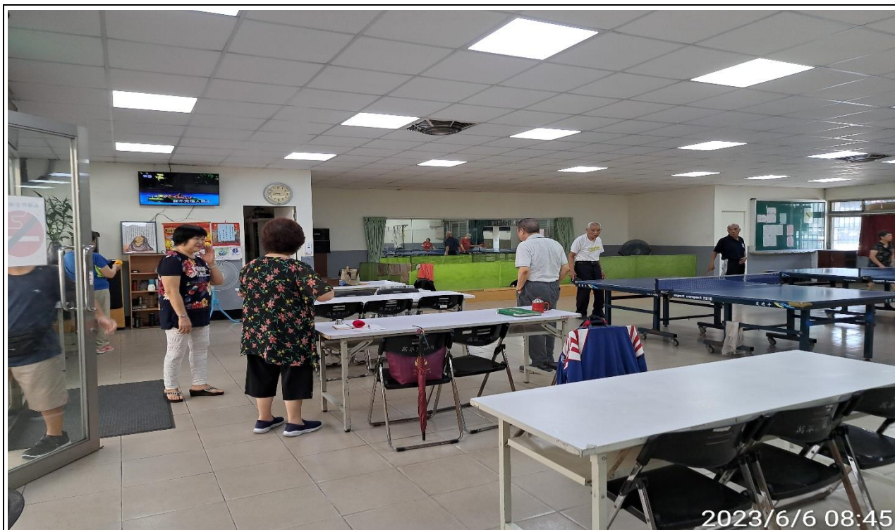
說明：萬大第二區民活動中心華中里長青會使用情形