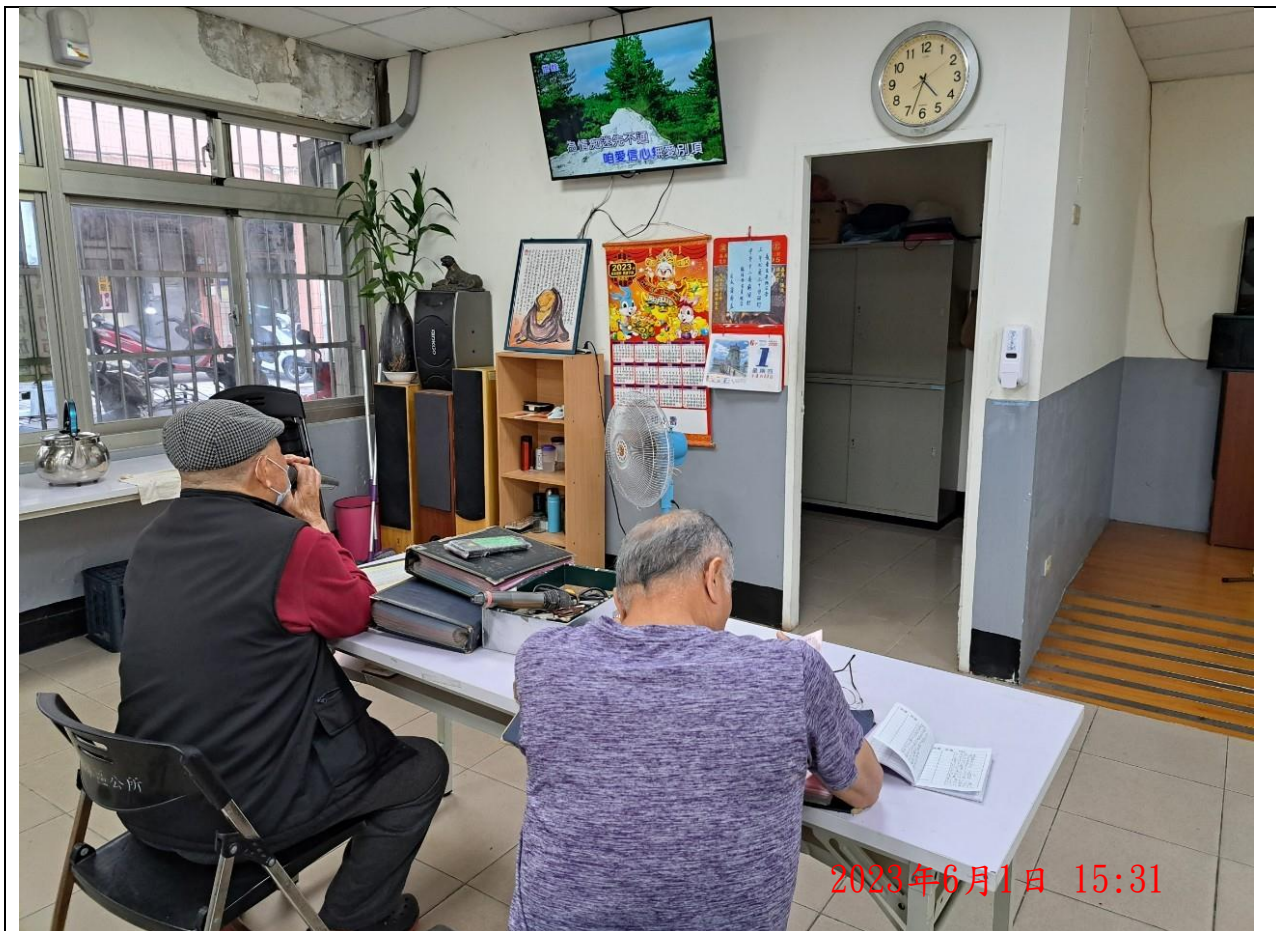
說明：萬大第二區民活動中心 卡拉OK