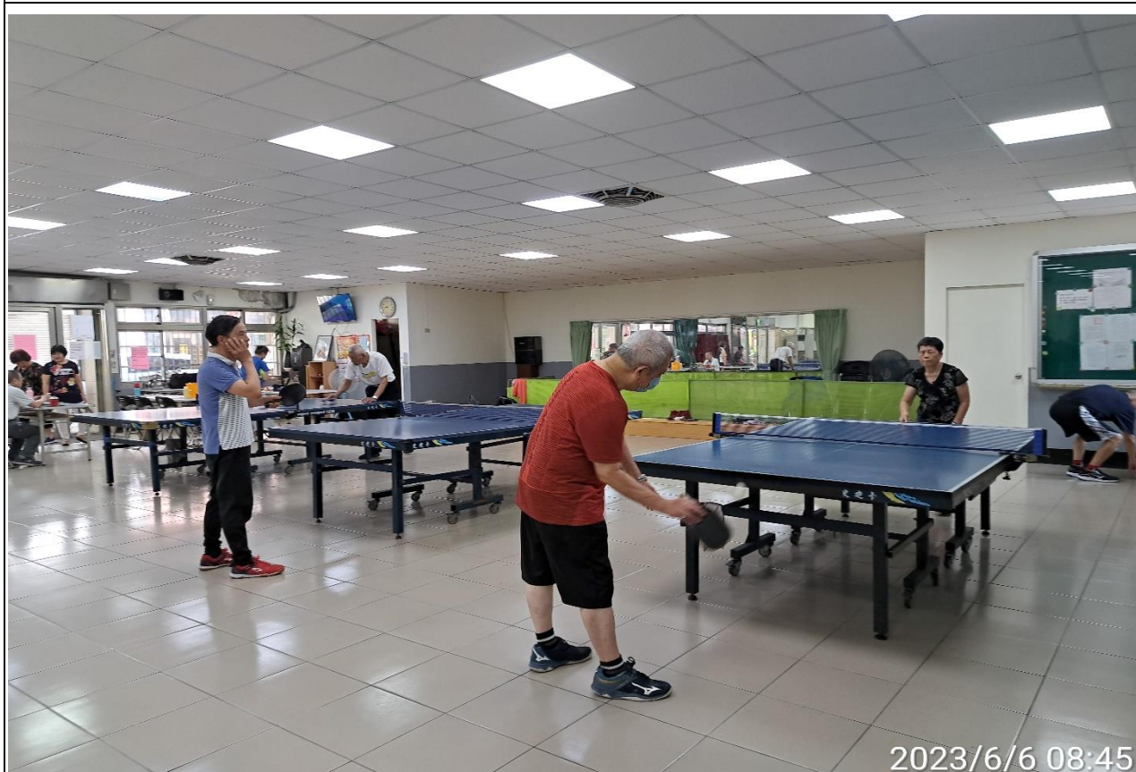
說明：萬大第二區民活動中心華中里長青會使用情形