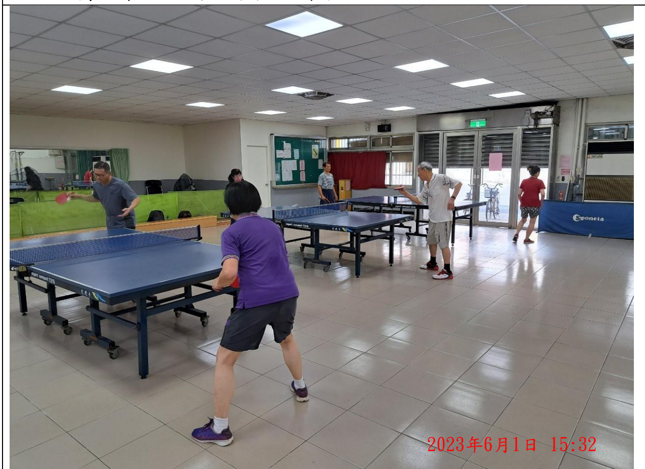
說明：萬大第二區民活動中心興德長青班隊 - 桌球