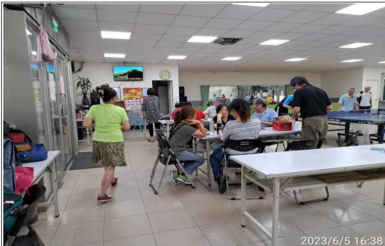
說明：萬大第二區民活動中心興德里長青會使用情形