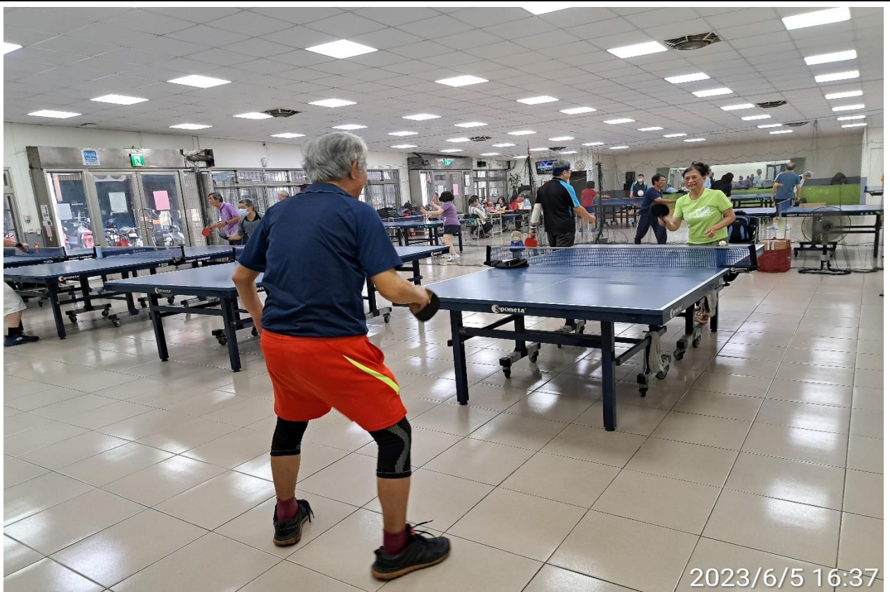
說明：萬大第二區民活動中心興德里長青會使用情形