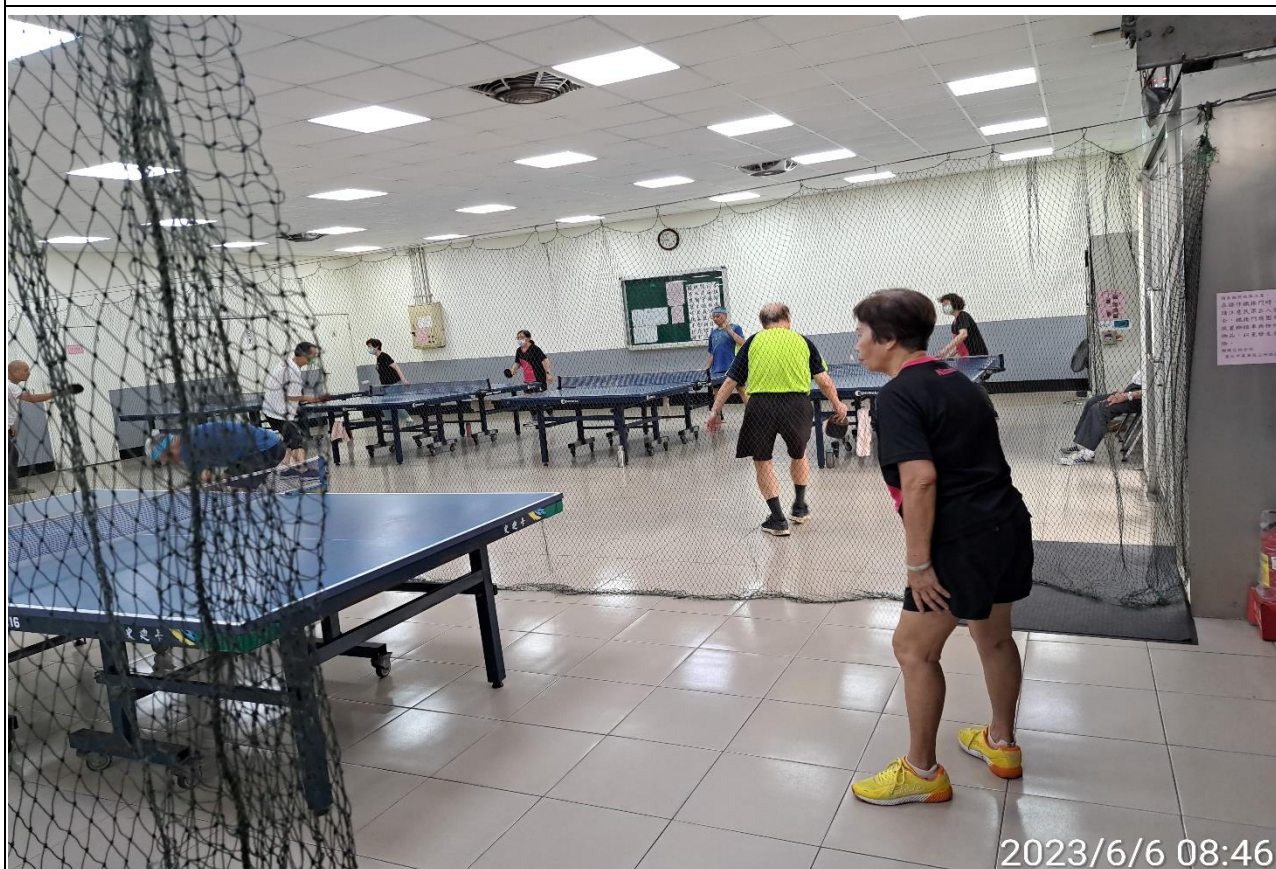
說明：萬大第二區民活動中心華中里長青會使用情形