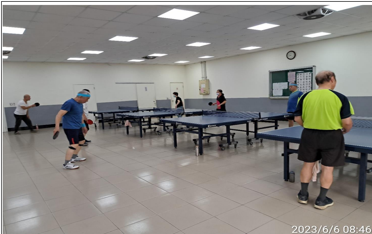
說明：萬大第二區民活動中心華中里長青會使用情形