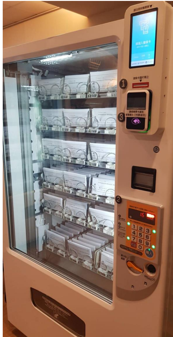
圖 2：大型販賣機一台可容納 230 份口罩