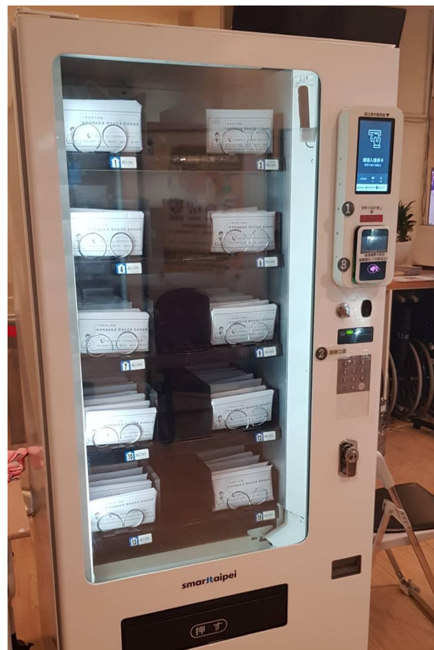
圖 1：中型販賣機一台可容納 80 份口罩

面對新冠肺炎所帶來的全球衝擊，臺北市將持續積極運用創新的科技力量，與中央共同防疫，並針對第一週的試辦與中央進行評估並討論可行規劃方式，再對 12 區健康服務中心擴展具體規劃，原則上分階段執行，並在中央的指導下，配合政策逐步調整擴增。