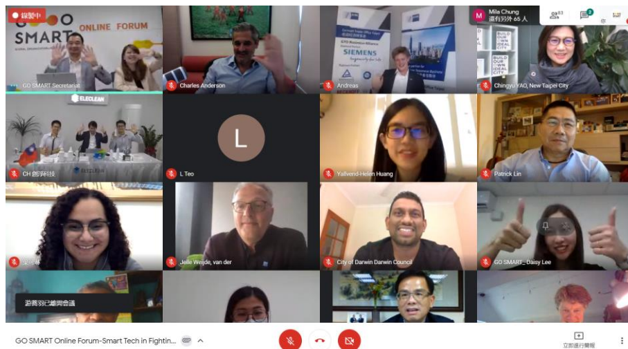
圖 4：GO SMART 首次辦理線上論壇，與會人員收穫滿滿