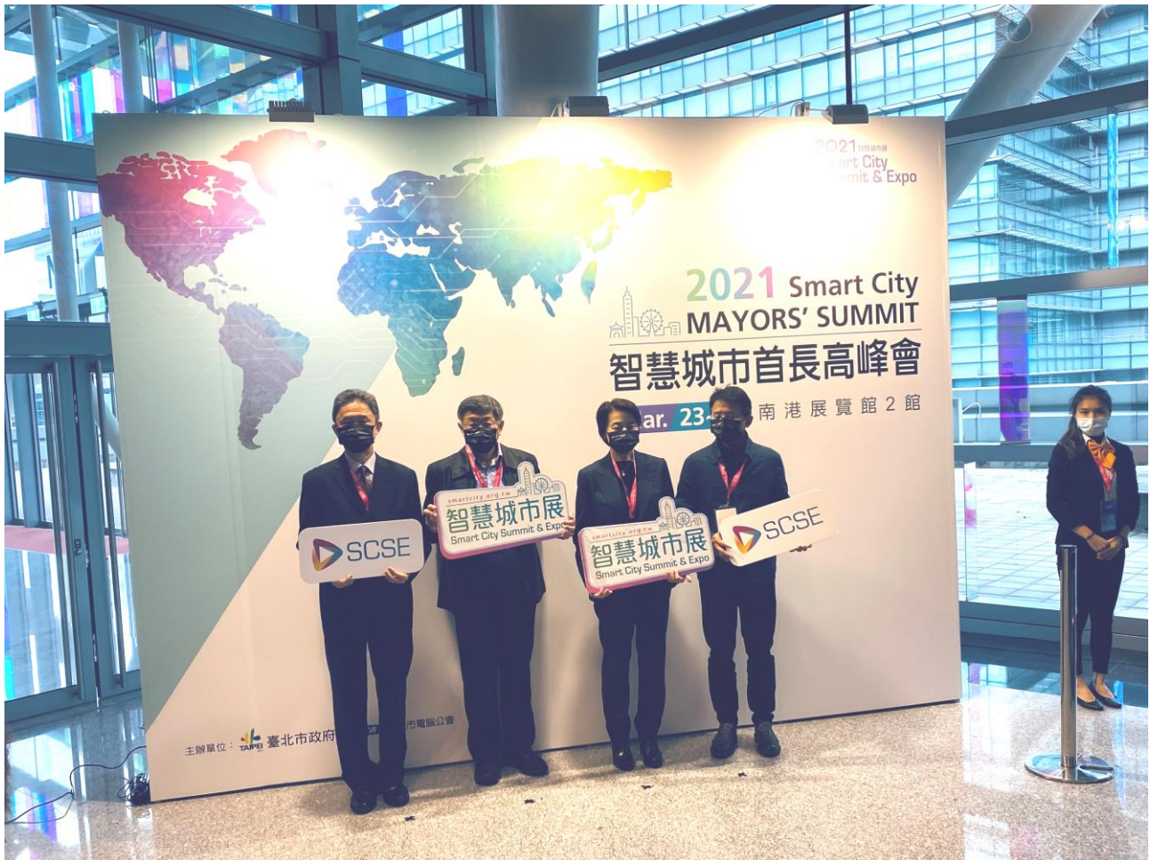
圖 3：2021 智慧城市首長高峰會大合照(左至右：市長室涉外事務總監周台竹、 臺北市長柯文哲、副市長黃珊珊、資訊局局長呂新科)