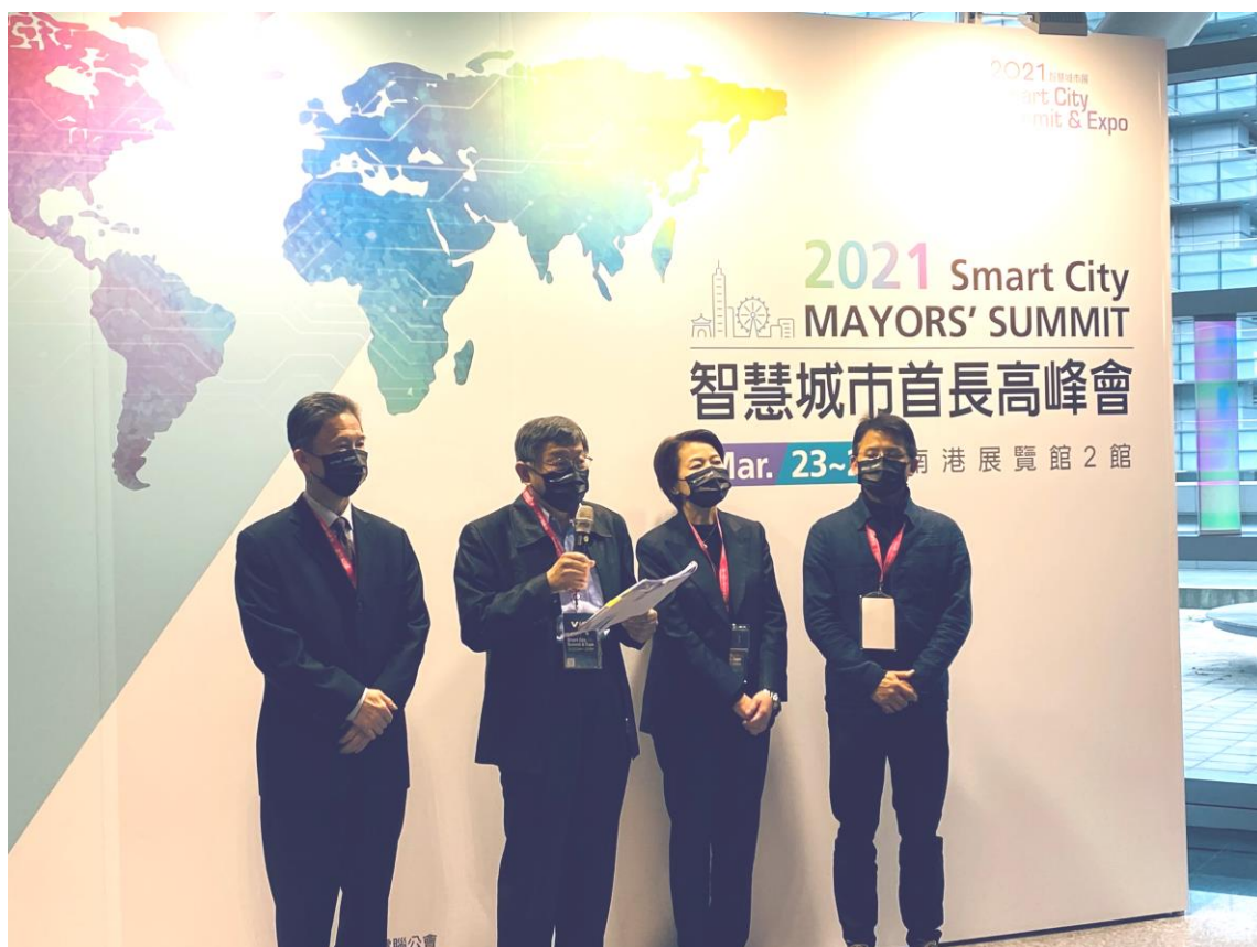
圖 2：2021 智慧城市首長高峰會-市長柯文哲致詞