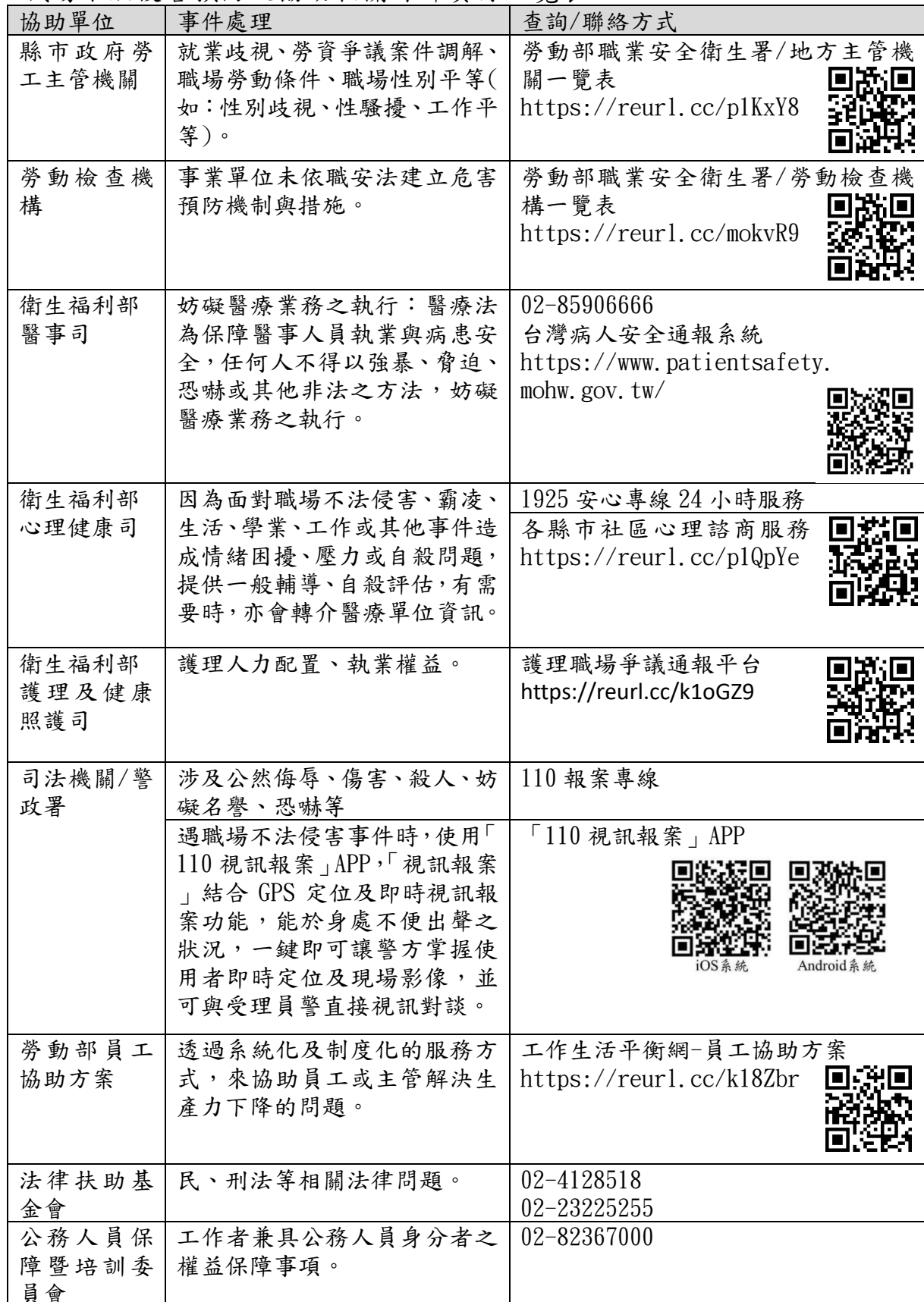
職場不法侵害預防及協助相關外部資源一覽表