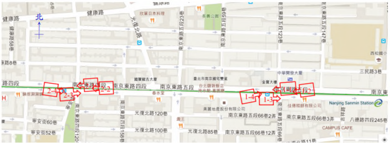
表 2(平面配置圖) 【範例】