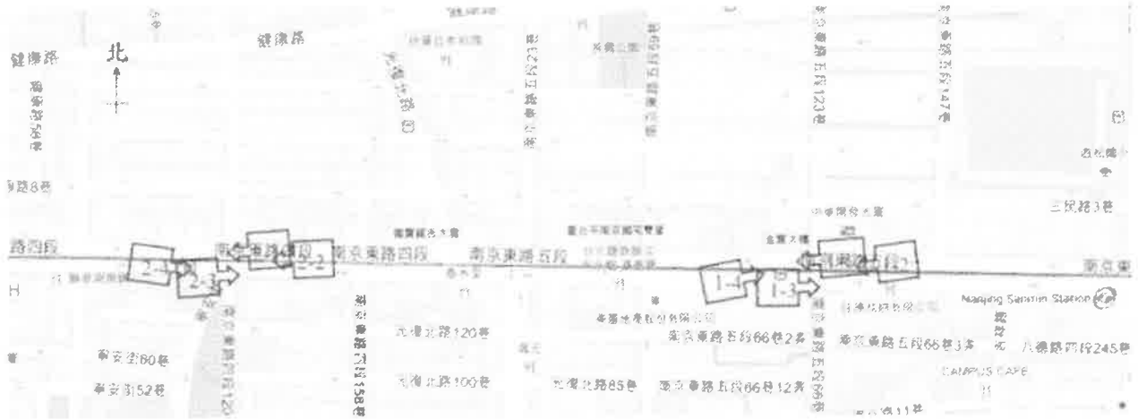
表 2(平面配置圖) 【範例】