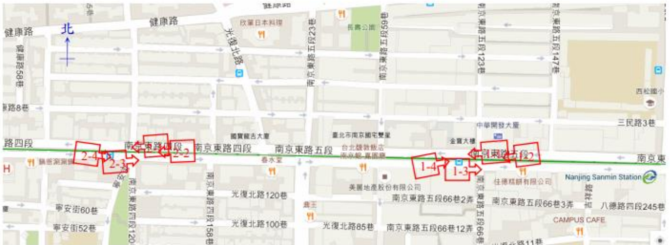
表 2(平面配置圖) 【範例】