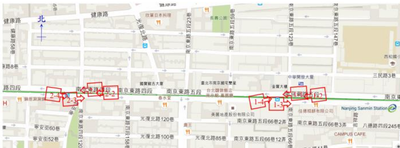
表 2(平面配置圖) 【範例】