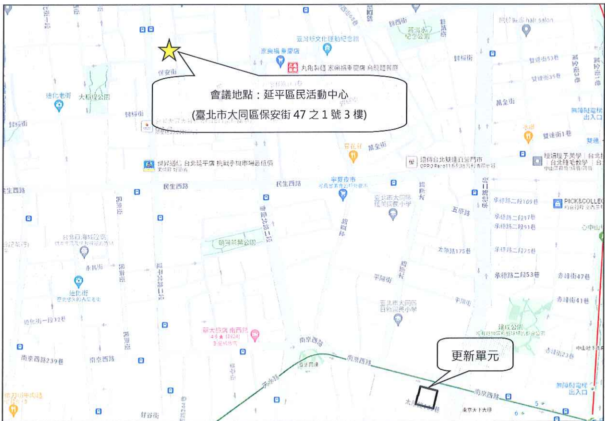
圖 2 開會地點示意圖