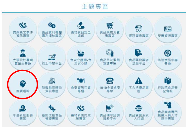
圖 1a. 食品業者進入食藥署官網下方主題專區，點選「我要通報」。