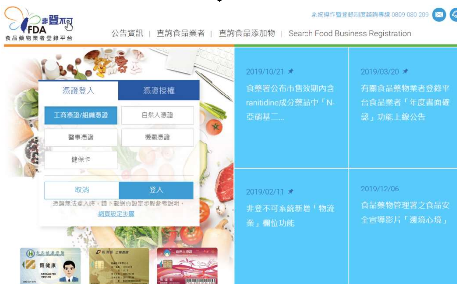
圖 3a. 食品業者以憑證方式登入「非登不可」系統。