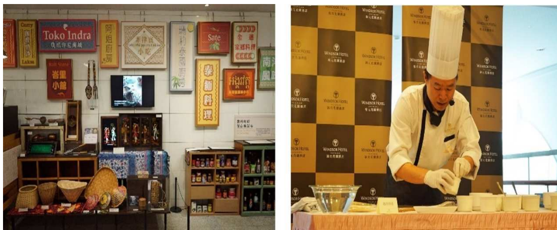
圖 8 《南洋味·家鄉味》特展展區與體驗活動

結，並營造出美好生活的想像，將近 20 位新住民投入撰寫多達 6 種的東南亞國家語言的導覽摺頁，並加入導覽的行列，充分表徵友善並提升新住民參與管道，讓臺灣民眾從飲食認識異國自然環境與文化，理解來臺新住民的多元文化，讓全民見證新住民在臺灣的貢獻與所創造的價值。