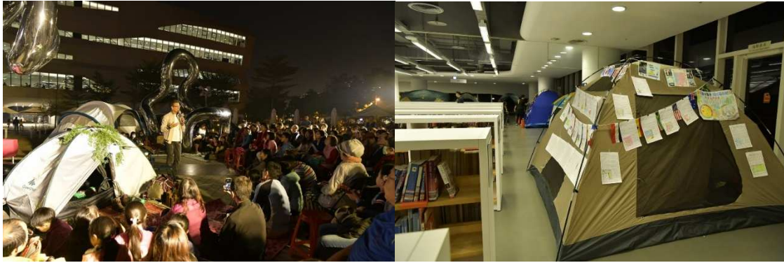
圖 6 2018 年臺灣閱讀節「不閱不睡」

作邀請到廠商迪卡儂贊助活動所需的商品如：露營的相關設備品並提供活動抽獎品。在宣傳期間以贊助廠商的帳篷商品圖書館運用策展的方法，布置成一座露營閱讀角區提供民眾立即的體驗和欣賞，不僅讓企業獲得直效的行銷提升品牌曝光度，官方也同時創造出活動的宣傳效益。