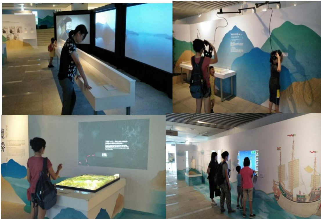
圖3 「水不在深-故宮數位文獻特展」文獻行旅展區

些將近數十萬件文獻類的展示品，是故宮較為缺乏「顏質」的文物。將故宮展品資訊解構、再重新組構，讓展件與圖書館的本質與資源相互呼應之新媒體藝術展現。這樣的過程使館員由被動轉變成主動、領導的角色，不僅讓故宮的文物更加平易近人，更使讀者體驗嶄新的閱讀模式，吸引大量參觀人潮，成為開發潛在讀者的另一種策略，重新詮釋經典圖書館的功能，更開啓國內博物館與圖書館合作之典範。