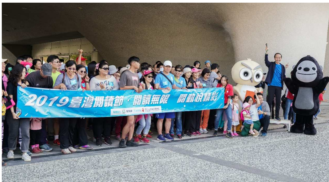
圖 7 2019 年臺灣閱讀節「閱動悅精彩」