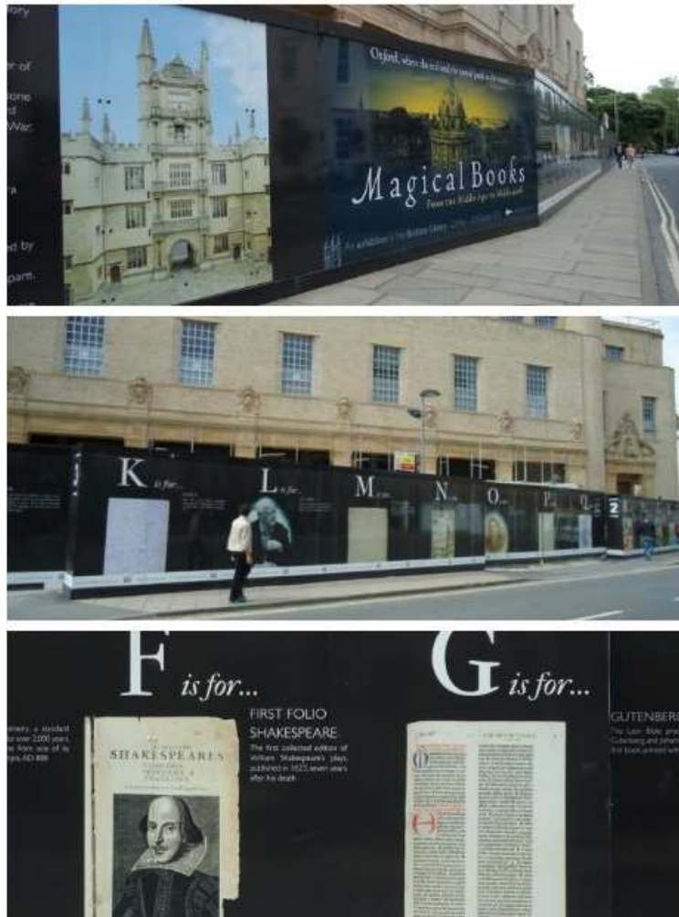
圖 1 「哈利波特：魔法的歷史」特展以字母順序介紹館藏

代流行的議題或物品創造話題，讓創新的活動為圖書館找到亮點，更是多元發展上的最佳呈現。並以圖書館非營利單位的形象為讀者尋找外部資源，提供讀者不一樣的文化視野。運用所有社會資源與圖書館合作，相信可以讓民眾深刻體會圖書館的好處與用心，也為圖書館創造不一樣的價值與成長（張宇樑、陳苑菁，2008）。