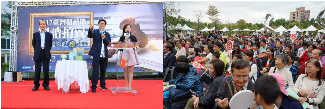
圖 4 2017 年臺灣閱讀節「閱讀拍賣會」

2017 年臺灣閱讀節-「閱讀拍賣會」(如圖 4)首創將「拍賣會」的概念和元素融入閱讀節慶活動裡，民眾運用閱讀點數取代現金的方式來競標閱讀拍賣品，用以提升民眾對活動參與的吸引力進而對閱讀產生興趣，館員在策劃閱讀活動時則須適時洞察時勢與流行事物，創新並非要無中生有，跳脫槽臼藉由轉換或改變形式開創不同新意都是創新的範疇，將閱讀獎勵機制改以拍賣會方式來作呈現就是一種創新，閱讀活動透過創意設計將閱讀與拍賣做結合，展現出臺灣閱讀節的創新模式與無限的可能性。閱讀拍賣會的整體活動執行流程將創新的服務措施及獎勵機制與館藏服務結合產生加倍效益。