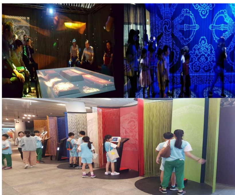
圖 2 「水不在深-故宮數位文獻特展」善本藝遊展區

「善本藝遊」展區根據故宮珍貴藏品《藏文龍藏經》 1 為策展主軸，利用圖書館場域的特色，設計出一座沉浸式的劇場，透過感測參與者的人數多寡而啟動相應的投影互動機制，展開循序漸進的三段變化體驗過程：從象徵善念的金色粒子的凝聚、經文與八吉祥彷彿流淌在劇場的空氣中，能親眼見聞卻無從抓取，到最後諸聖尊的顯像；透過沉浸式劇場見到龍藏經外、內護經板上的各種視覺元素，讓觀眾宛如在夢境中體會了龍藏經的藝術之美。劇場內以蒲團意象座椅模擬打坐沉澱的環境：民眾坐下後，地面會慢慢浮現出經文、八吉祥的動畫，且隨著停滯時間漸久，地面的動畫範圍便逐步擴展。讓觀眾透過數位互動裝置，認識《藏文龍藏經》善本繁複且講究的裝幀藝術與藏傳佛教的法典之美。