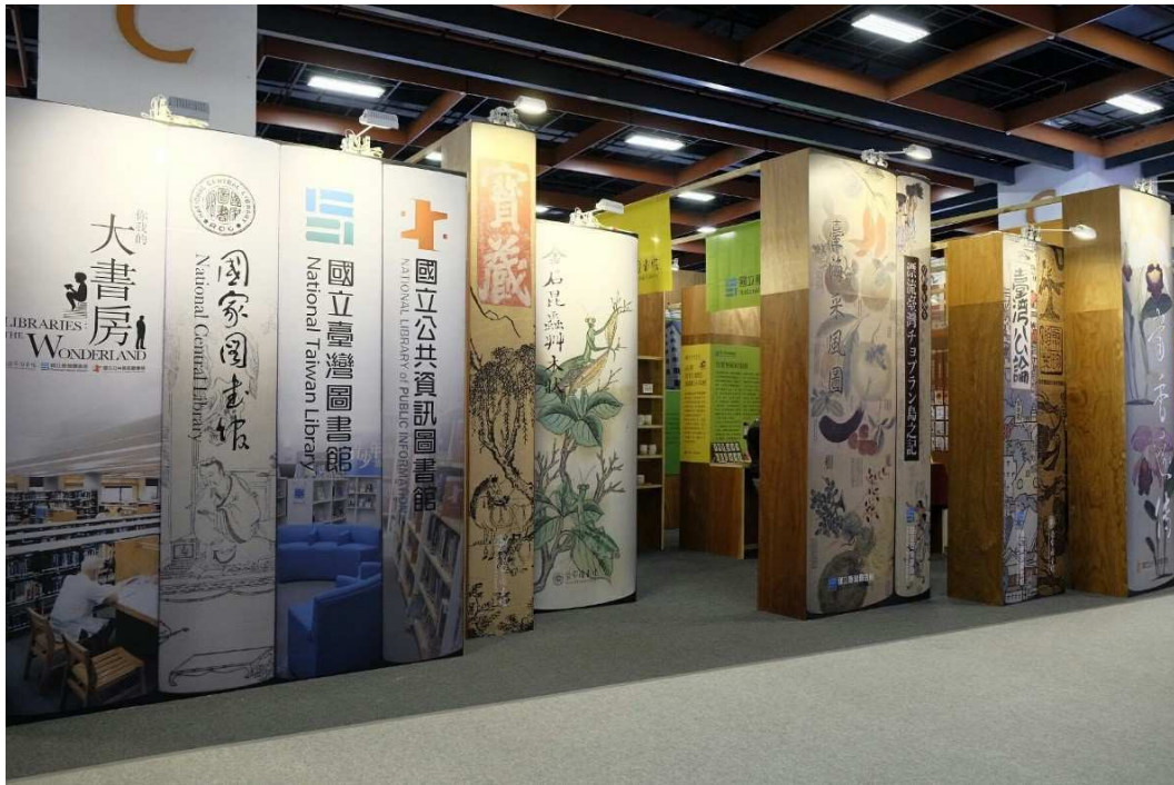
圖 5 國家圖書館、國立臺灣圖書館、國立公共資訊圖書館三館聯展「閱讀聯盟」

除跨機構、跨部門外，現代化的圖書館場域更需要跨界、跨領域為讀者開創資源的連結與延伸，進而創造讀者滿意度與忠誠度。2018 年臺灣閱讀節再度創新以「不閱不睡」為主題（如圖 6），將圖書館打造成一座與書為伍的露營場域，不閱不睡結合夜宿露營圖書館的型式，首創對外開放民眾報名到圖書館搭帳篷露營夜宿，活動從白天進行到晚上，邀請許多的閱讀團體、特色書店、文創單位前來共襄盛舉，到了晚上在圖書館戶外廣場將露營活動常會辦理的營火晚會型式轉換成一場「圍爐夜讀」活動取代營火晚會，邀請知名作家吳若權先生，近距離與讀者在戶外廣場上一起話閱讀，提供民眾讀者從白天到夜晚，體驗各種不同的閱讀方式與情境，讀享生活中每一刻的閱讀氛圍。參加夜宿露營的民眾則是在圖書館閉館後入住，將帳篷搭好後並為帳篷妝點上各式彩妝，整個露營閱讀區瞬間幻化成帳篷的 cosplay 展區。接著圖書館化身為尋寶場域每一組成員透過圖書館新開發的尋書導引 APP 軟體，穿梭在熄燈後的圖書館藏書區尋找著任務指定書本，以此展現一家人共同挑戰任務的凝聚力，同時也成功將圖書館創新的服務項目提供讀者體驗同時也直接進行服務行銷。同時進行跨域合