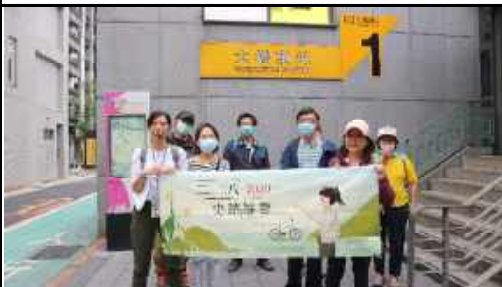
追思之路：以二二八事件相關為中心串連臺北地區相關人權地景，自時代背景闡述，延伸至事件爆發地點「天馬茶房」，仿1947年2月28日遊行路線，並結合現今人權地景規劃主題路線。