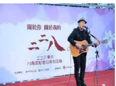
←吳志寧曲風民謠搖滾以溫暖的聲音述說著臺灣的故事