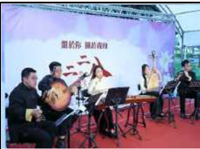
←新樂國樂團演奏台灣經典老歌，回顧1940年代的228歷史記憶