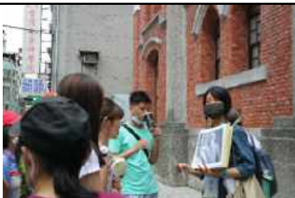
自由之路：以台北二二八紀念館為中心串連附近人權地景，包含人權地標、人權地景等，由各個景區述說著臺灣在人權的各個層面奮力爭取的軌跡，藉此說明人權自由得來不易，後人應