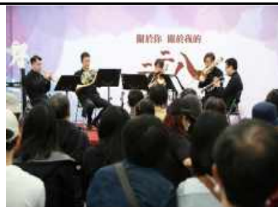
←銅管五重奏以不同組合帶來精采精緻的經典曲目，內容橫跨古典、爵士、流行