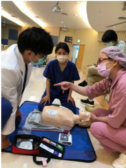
B L S 急救技能訓練