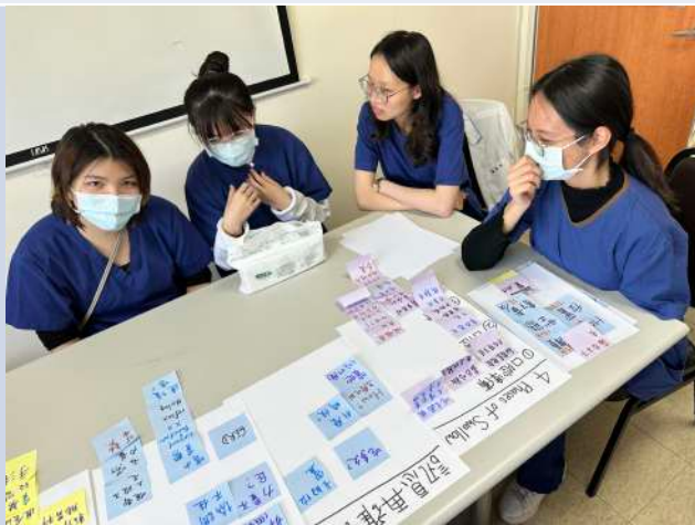
藥物劑型與吞嚥障礙