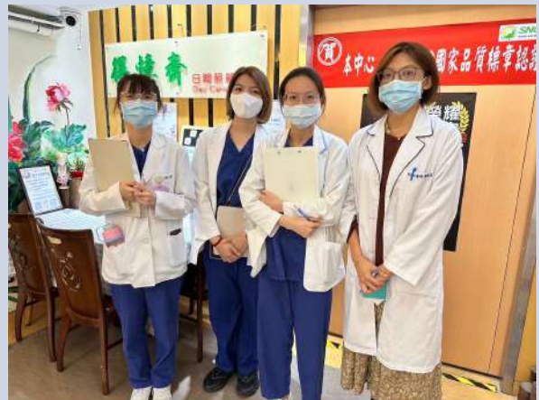
失智症及輕度失能日間照護團體治療與活動