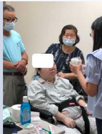
其他不定期課程：特殊口腔照護