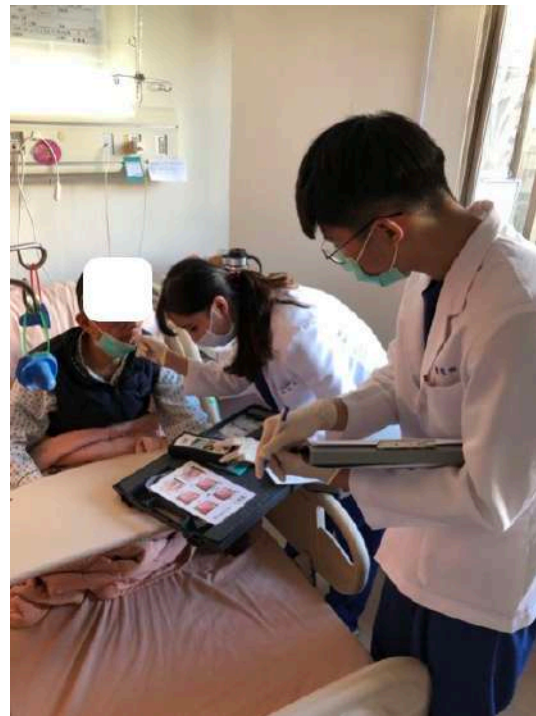
吞嚥障礙儀器介入