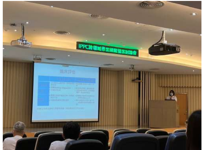
I P P C 跨專業案例討論