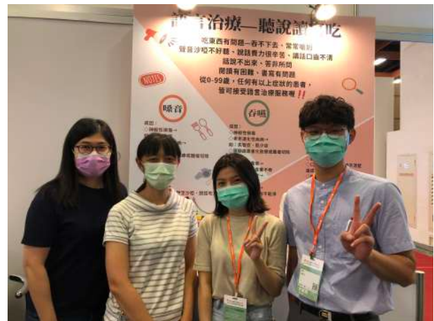
北市公會專業推廣