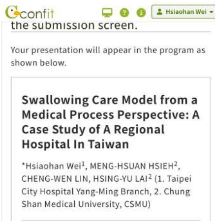
臨床專題研究寫作