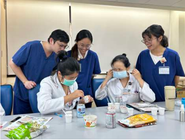
問題導向學習專題