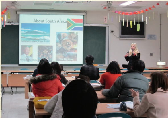
▲外籍英語教師與本國英語教師進行英語教材交流