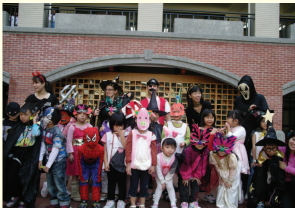
▲大家千奇百怪的裝扮參與西洋萬聖節

廣續推動國民教育階段身心障礙資賦優異教育試辦計畫，並擇定市立教育大學附小、建安、永安、興雅、石牌、萬大、龍安、東門等及仁愛國中、中正國中等計10校為試辦學校，經試辦學校徵得家長同意後計提供28名身心障礙資優學生適性教育輔導措施，試辦期間並安排資深身障類教師及資優類教師巡迴輔導，提供專業建議並協助各校調整辦理方式，進而提升資優教育服務品質。