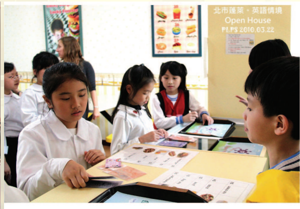
▲想吃點什麼好呢？請說英語才能點餐喔