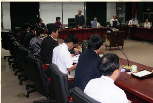
▲ 中國大陸淮南市教育參訪團來訪