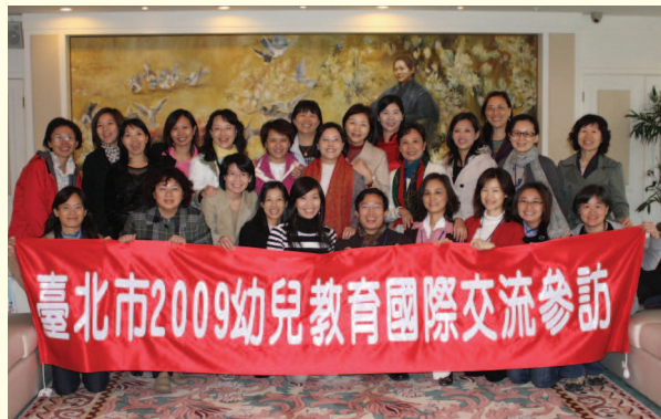
▲ 參訪上海宋慶齡幼兒園

2. 本市幼稚園園長、教師於98年11月1日至7日至中國大陸上海、蘇杭進行交流參訪，參訪地點包括上海國家重點示範幼兒園。此次參訪成果對於臺北市未來幼托整合、優質幼兒園之理想規劃，具有「他山之石」之參考價值。