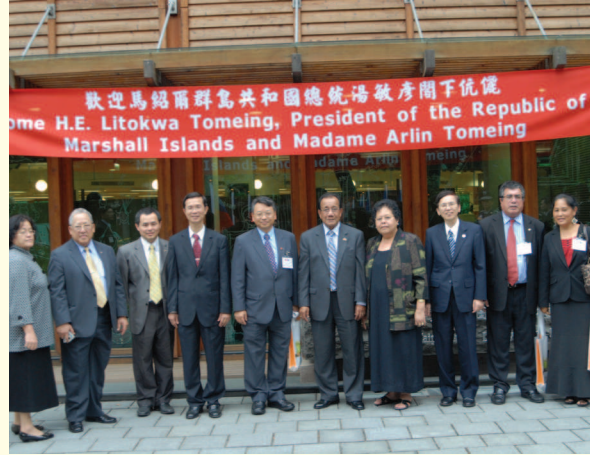
▲ 馬紹爾總統伉儷參訪市圖北投分館