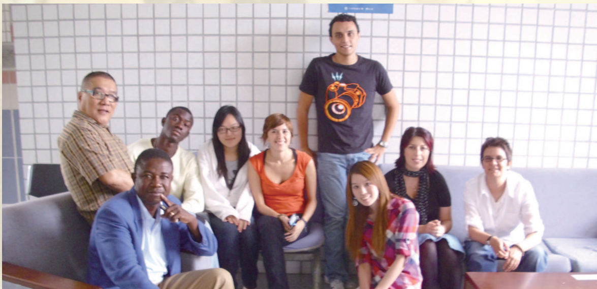
▲ 外國人學習中文補助金獲獎學員