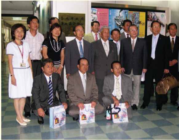
▲ 日本茨城縣坂東市議會議員來訪