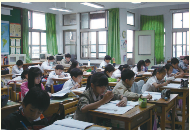
▲ 預試學校學生英語檢測作答情形