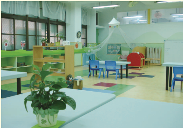
▲ 學校校舍空間活化再利用

臺北市由南區銘傳國小、北區由大湖國小試辦推動，由學校釋出可適用教室空間，並進行基本設施的改善，再委外辦理，經公開招標，並通過評審委員會的評核後，銘傳國小由上禾托兒所、大湖國小由何嘉仁寶貝托兒所得標，另收費部分朝介於現行公托和私托之間的價位。位於大湖國小內的何嘉仁寶貝托兒所業於98年9月完成立案招生作業，並於9月26日舉行開幕典禮，當日並安排幼生表演、參觀環境、茶會、大湖寶貝童樂會（遊戲、說故事）等活動。位於銘傳國小於內的上禾托兒所亦於99年2月9日舉行開幕典禮。