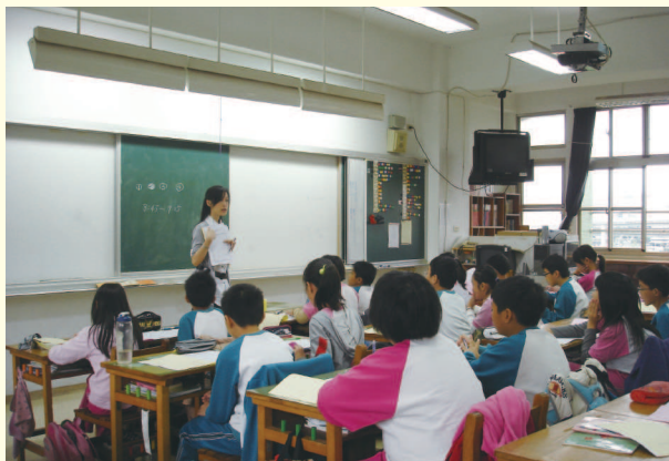
▲ 教師對受測學生進行預試答題說明

98年度基本學力檢測結果，僅將各校學生通過機率與全市受測學生通過機率的對照圖，提供各校參考，不對外公布，不進行校際比較，亦不會公布學生個人成績。