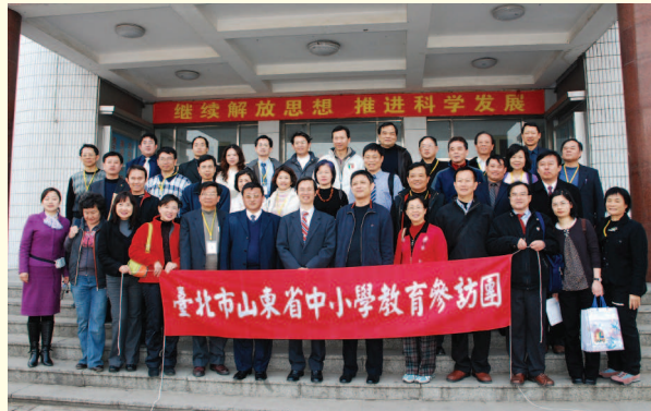
▲ 中國大陸山東省中小學教育訪問團

1. 於98年3月10日至17日辦理「98年度大陸山東省中小學教育訪問團」，至中國大陸山東省等地進行兩岸中小學教育交流訪問。透過座談了解兩岸中小學教育政策及發展現況，俾能提升臺北市教育行政及教學品質，計有中小學校長及教師31人參加。