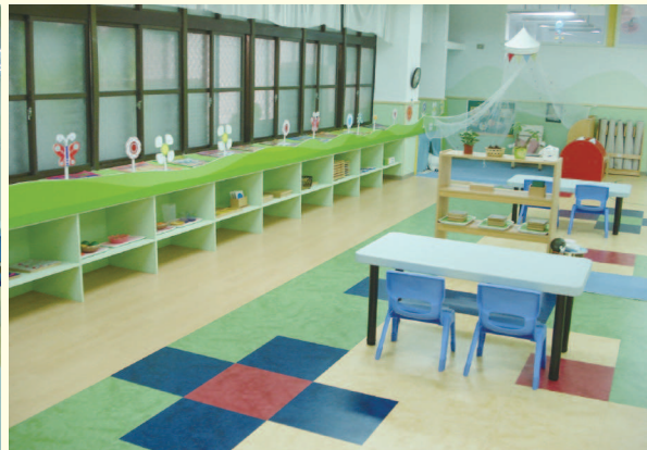
▲ 空餘教室提供民間試辦托兒所