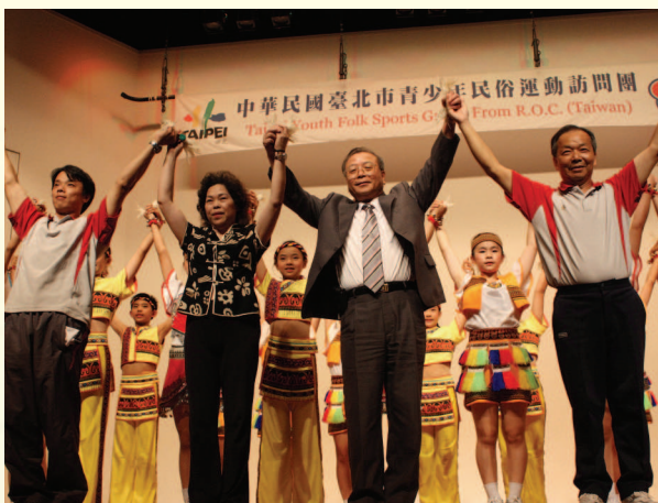
▲ 98年青少年民俗團東京謝幕