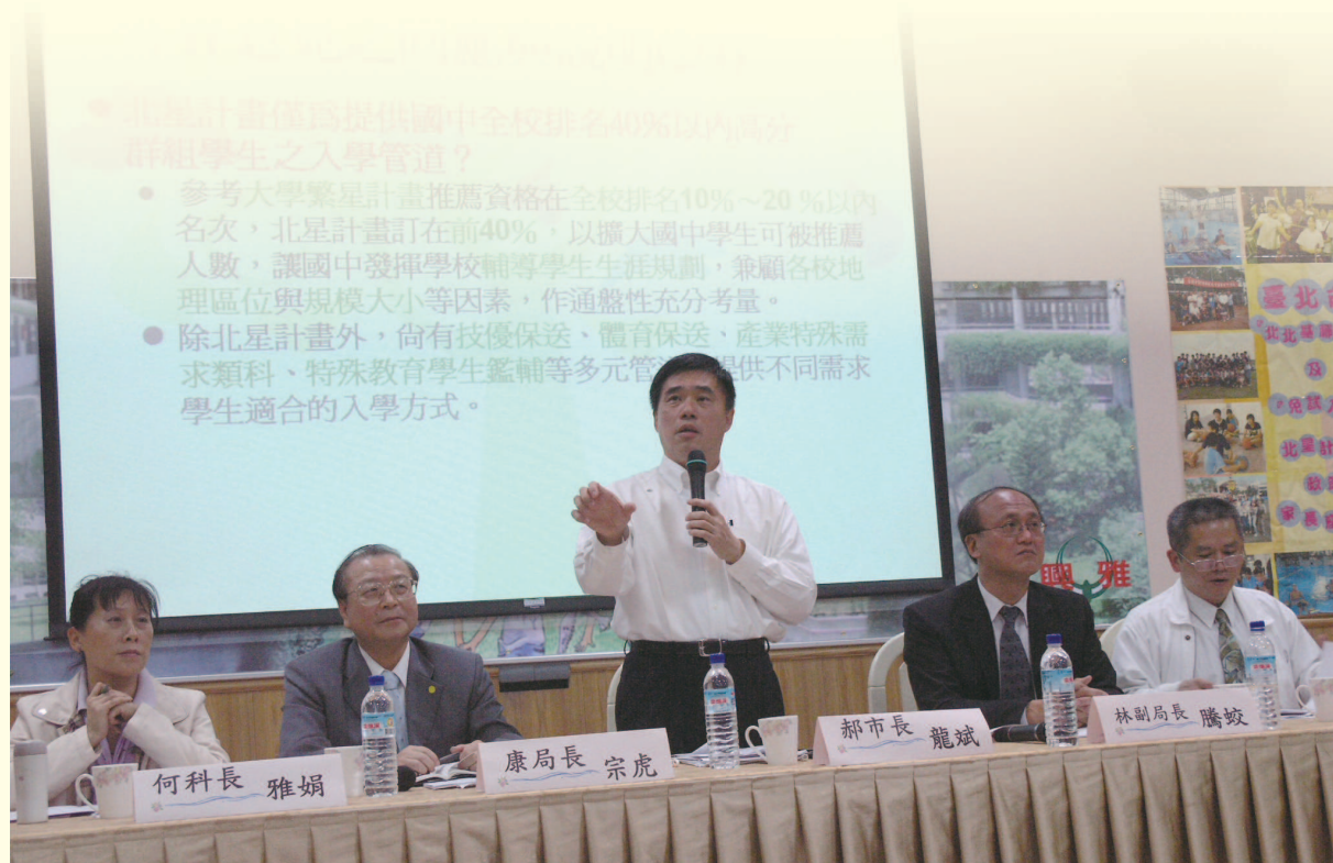
▲臺北市「北北基聯測」政策市長與家長座談會（信義區）

另為使臺北市轄屬公私立國民中學了解北北基聯測試辦計畫，除於98年9月29、30日辦理2場學校說明會外，另自98年11月26日起依行政區分別辦理12場「北北基聯測」政策市長與家長座談會，以使本市家長更了解及支持此政策，並釋各界疑慮。