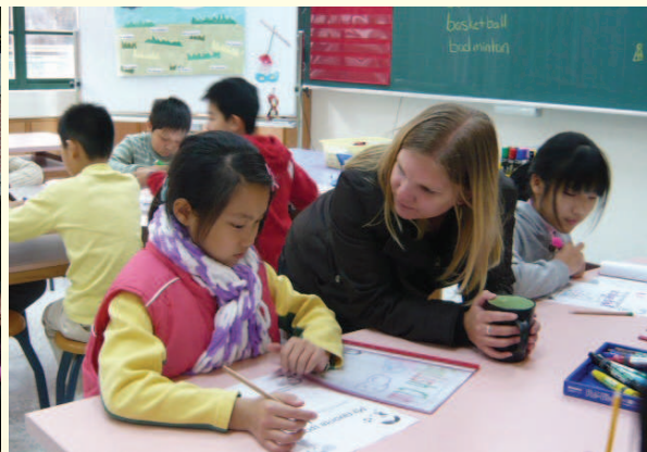
▲外籍英語教師指導學生填寫作業單