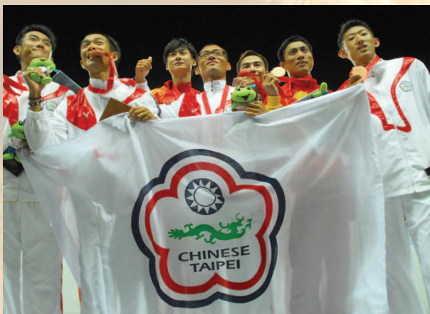
▲ 中華臺北健兒屢創佳績