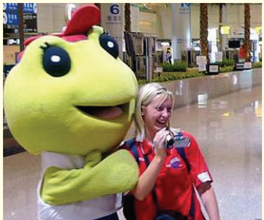
▲ 大會吉祥物迎接外國選手到來

為了迎接多達3,000多位國際人士來臺，並且妥善服務來自世界各國的聽障選手，這一次也是臺北市有史以來，募集最多志工的活動，當中除了社會人士外，社會團體的支援與大專院校的學生也是重要志工來源，讓此回志工的人數一口氣上達9,700人，再加上8,000多名幕後工作人員與1,000多位的外語志工，總動員人數超過2萬人，遠超過國際聽奧總會要求志工人數至少達到每2位選手配1位志工的門檻。據他國的參賽選手及隊職員表示，臺北聽奧志工的效率超好，每個問題均能快速解決，這是他們過去參加聽奧比賽時不曾見過的效率。