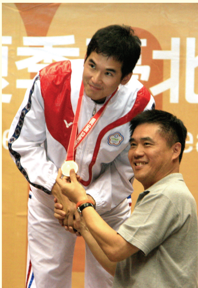
▲ 郝市長龍斌頒獎給獲獎選手

本次臺北聽奧閉幕式突發奇想，有別於以往的鋪陳安排，採用「辦桌」方式，在會場上席開360桌，端出臺灣美食，慰勞這些遠道而來的選手、教練及裁判，將閉幕式營造成聽障選手們互相交流的嘉年華會。