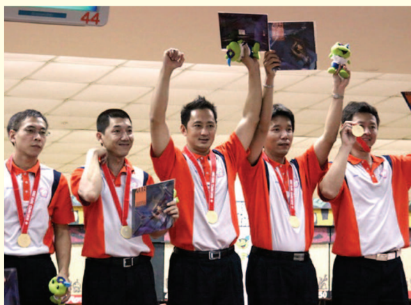
▲ 中華臺北保齡球項目奪得團體金牌