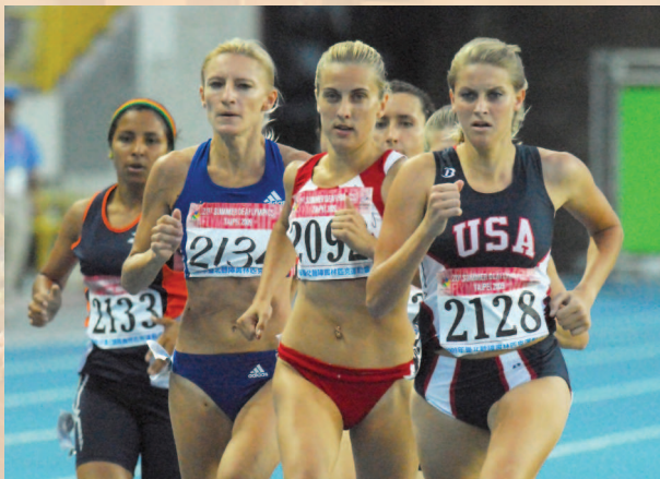
▲ 田徑場上各國選手齊聚一堂