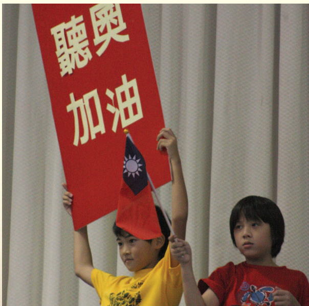
▲ 場邊小朋友搖旗吶喊為選手加油

本次賽會親善工作，承蒙親善團88所學校校長（1所總召集學校及87所親善學校）及行政團隊大力支持與協助，及各校參與同學賣力付出，以親善關懷