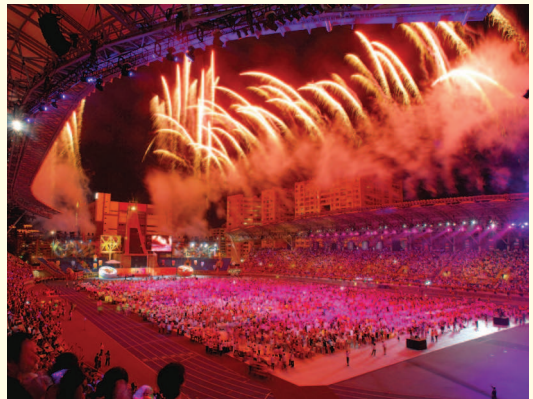
▲ 開幕式壓軸煙火秀

本屆聽障奧運開幕式的壓軸煙火秀「聽奧子午線」沿線臺北田徑場、臺北體育館、臺北社教館、國父紀念館、松山菸廠，再到臺北101大樓等6個地點同時點燃煙火的璀璨華麗，象徵著「臺北走出去、世界走進來」的意義，也讓「亞洲第一次」揚名國際。