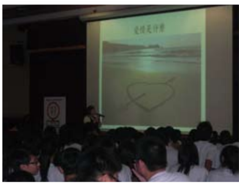
99年3月5日 華興中學 主題：正確兩性關係與交友應注意事項