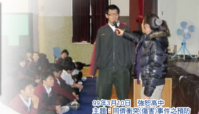
99年3月10日 強恕高中 主題：同儕衝突(傷害)事件之預防