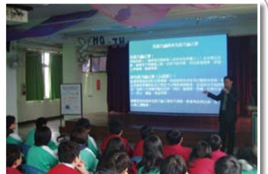
99年3月10日 民權國中 主題：網路犯罪與預防

99年3月期間，本隊少輔組社工及校訪小隊員警到各區國、高中及小學進行犯罪預防宣導，針對毒品、校園霸凌、竊盜、兩性交往、網路安全等相關法令與預防方法與學校老師及同學分享，以收犯罪預防及自我保護之效；另本隊每月分析當月少年偏差及犯罪行為概況，針對重點主題加強宣導，3月份重點宣導主題為「傷害與暴力」，共計進行26場次。