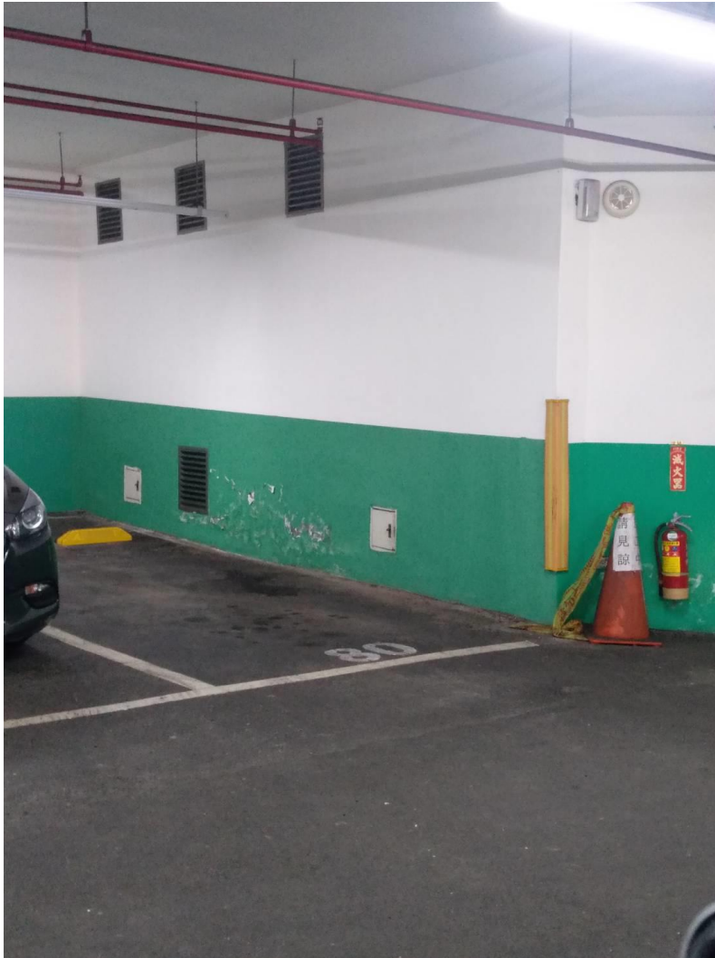
圖2、B3層綠色油漆重漆（如下圖範例）