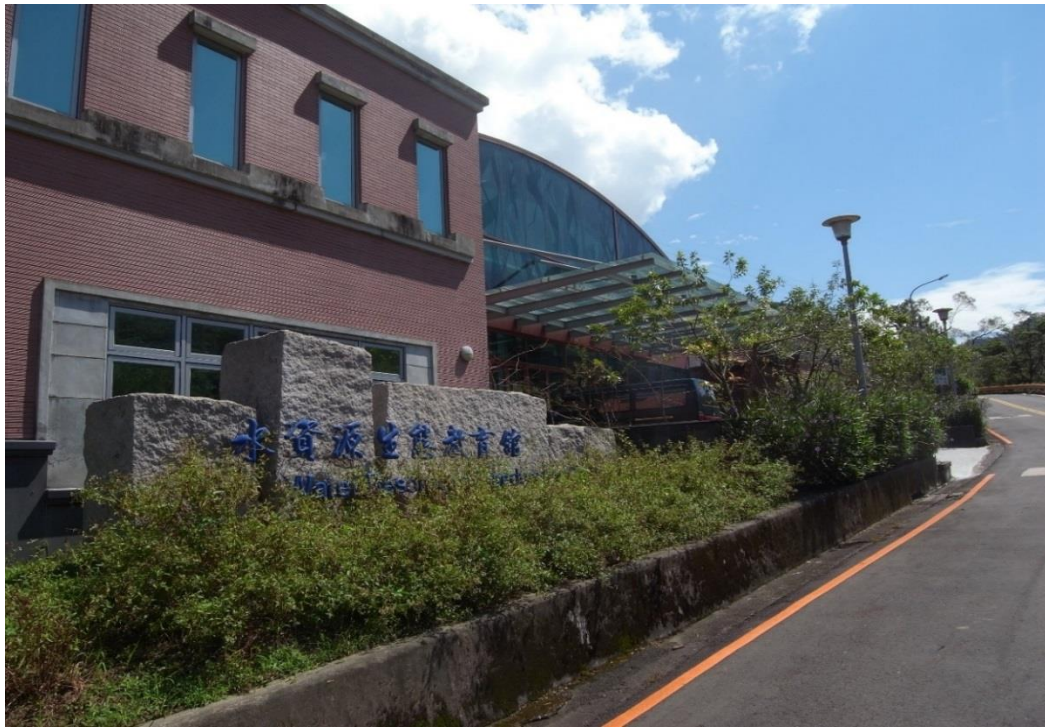
翡翠水庫水資源生態教育館