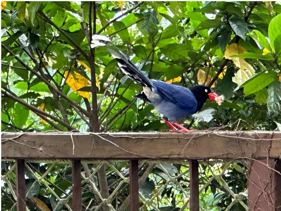
翡管局行政辦公區的臺灣藍鵲，陪同員工上班