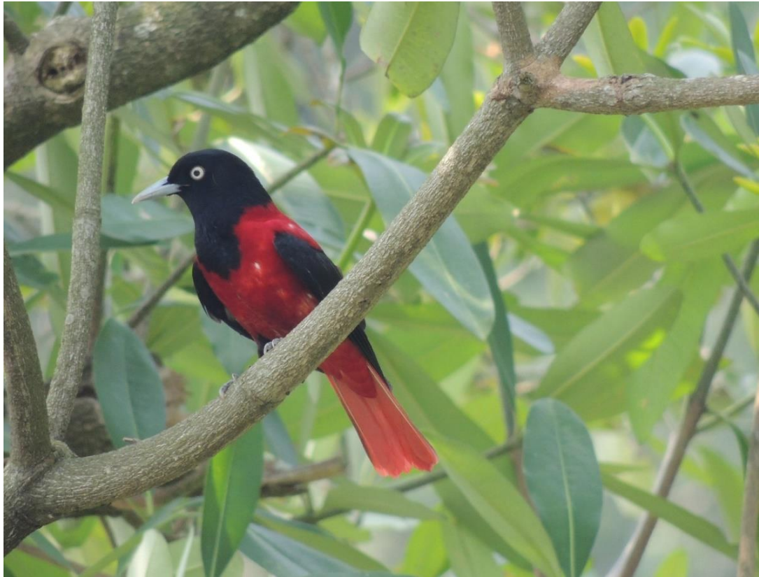
朱鸕公鳥(稀有保育類)