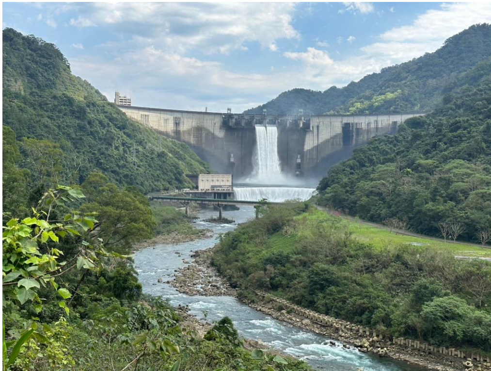
翡翠水庫優質水環境