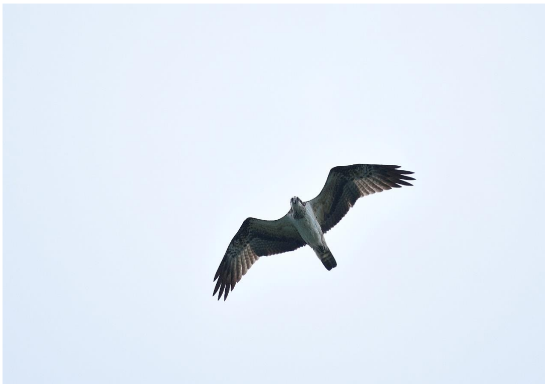
魚鷹(稀有保育類)可俯衝入水捕食魚類