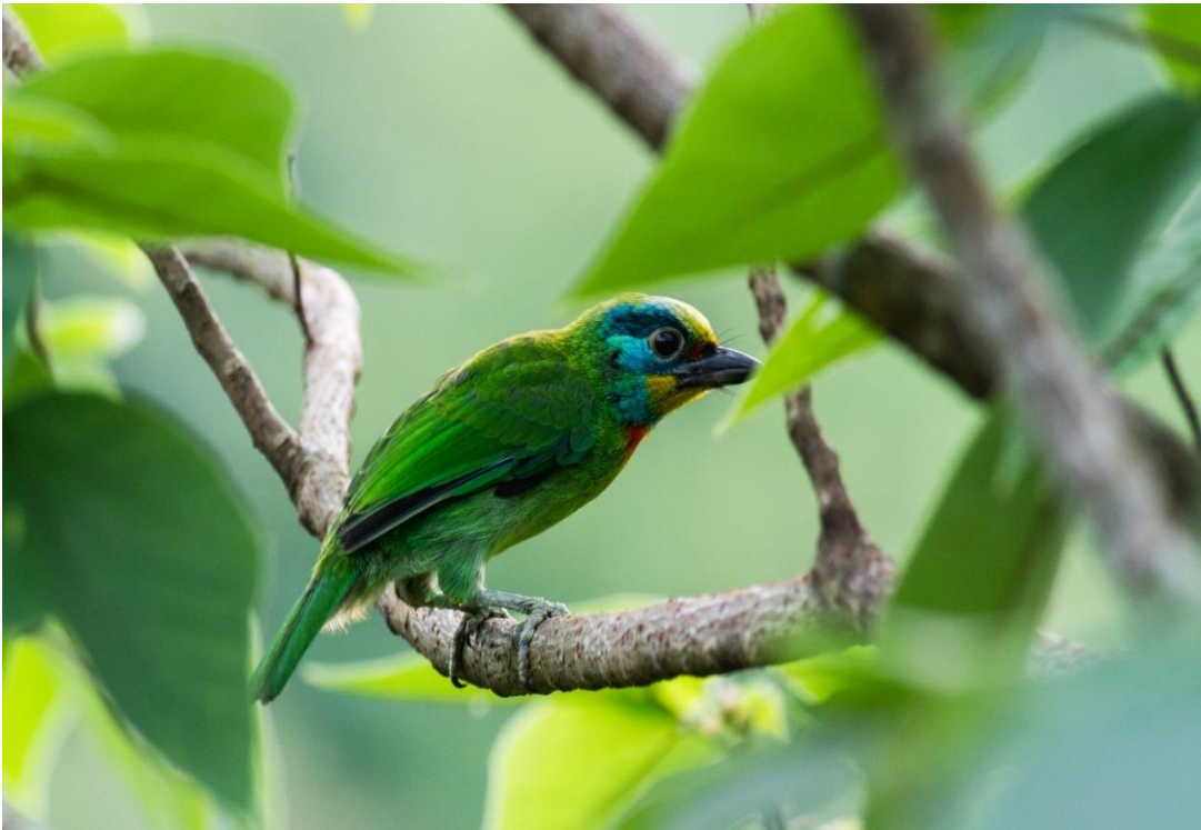
水庫常見「五色鳥」，身上有紅黃藍綠黑五色，因而得名，求偶聲如敲木魚，又名「花和尚」