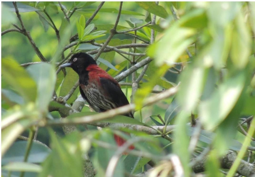
朱鸕母鳥(稀有保育類)腹部有縱向黑色斑紋，與公鳥有別