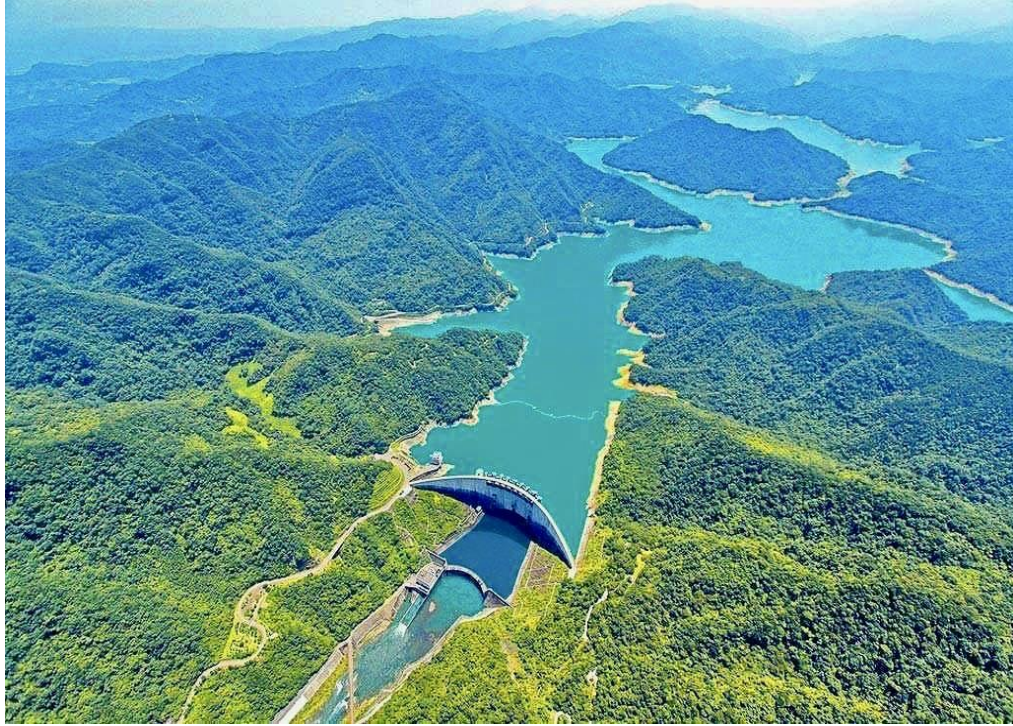
翡翠水庫優質水環境