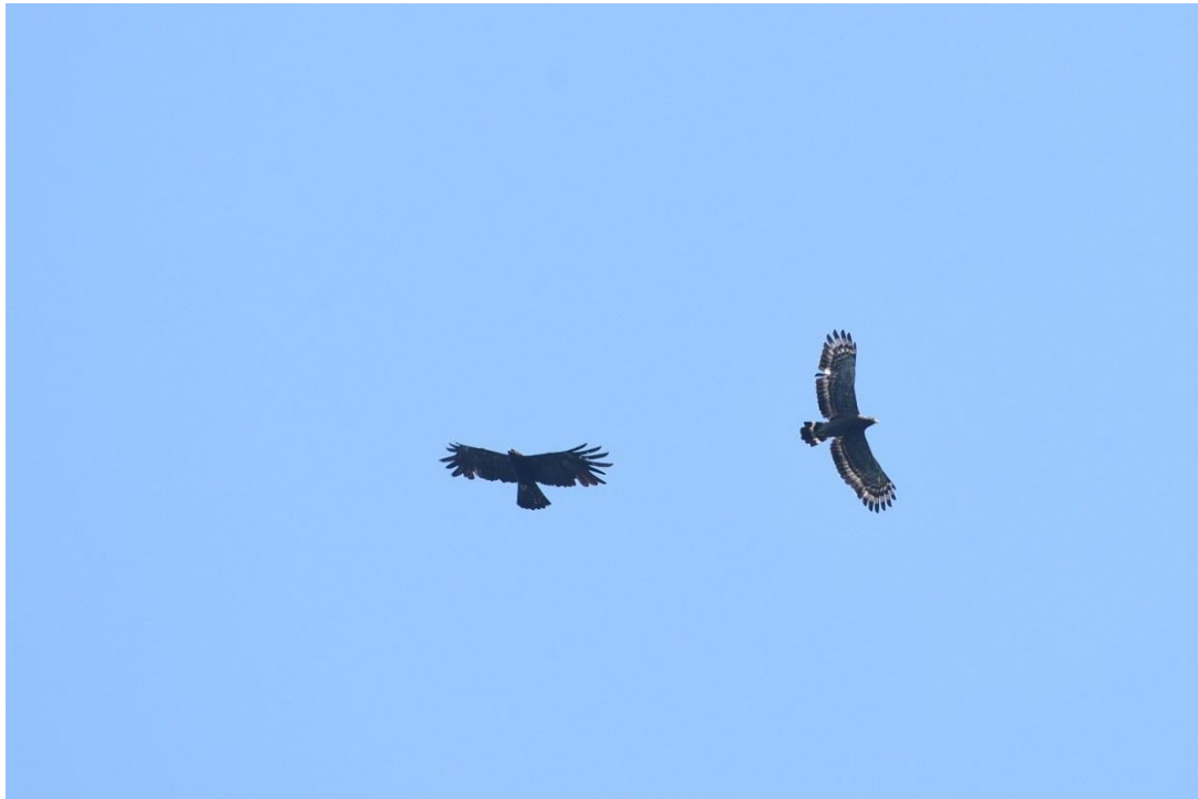
林鵟(左)、大冠鷲同框，翱翔翡翠上空