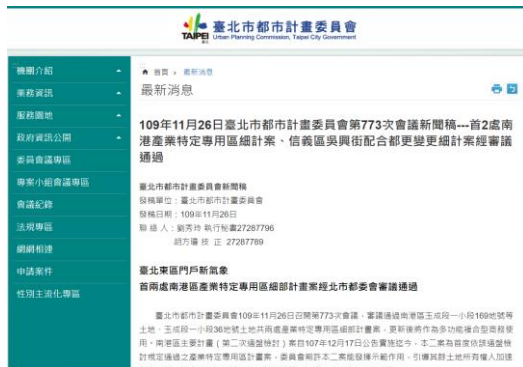
▲本會網站(最新消息)(會後新聞稿)