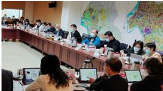
▲委員會議開會情形(委員討論)