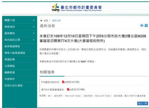
▲本會網站(最新消息)(會議訊息)