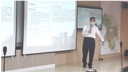
▲委員會議開會情形(民眾發言)