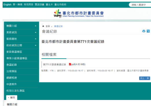
▲本會網站(會議紀錄)