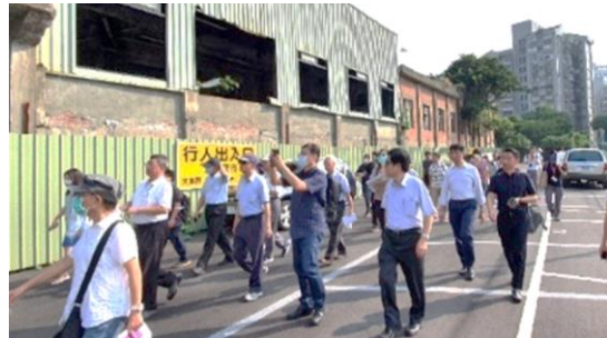
▲委員會現勘(士林區細計通檢案)