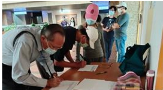
▲委員會議開會情形(民眾登記發言)