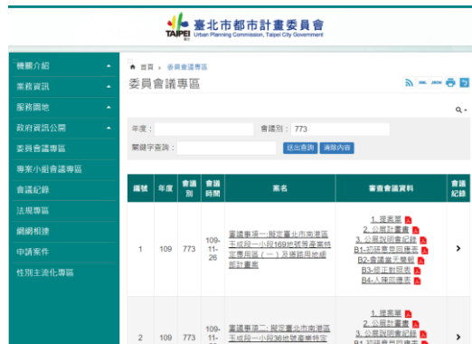
▲本會網站(委員會會議專區)