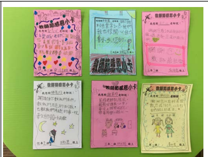
02 感恩敬師小卡，表達謝師心意。