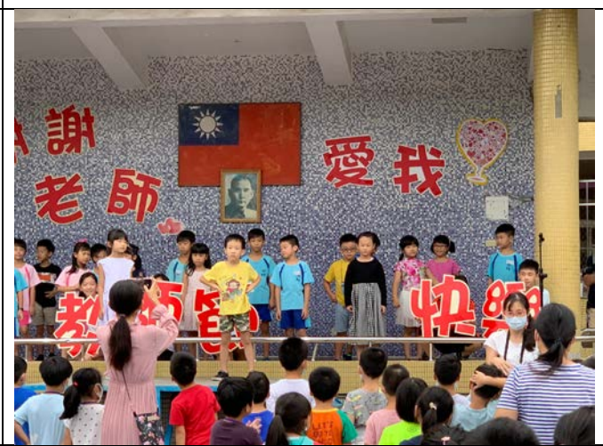
04 教師節慶祝大會，學生為老師歡唱表演。