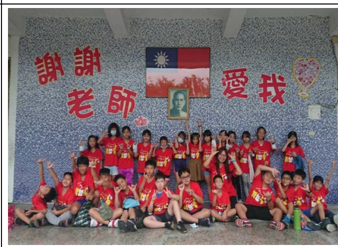
06 謝謝老師，愛我！祝福老師~教師節快樂！！