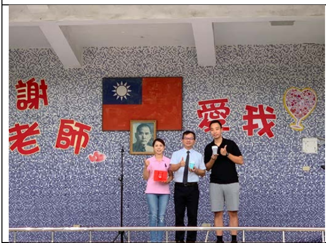
03 家長會長代表致贈敬師禮物，感謝老師辛勞！