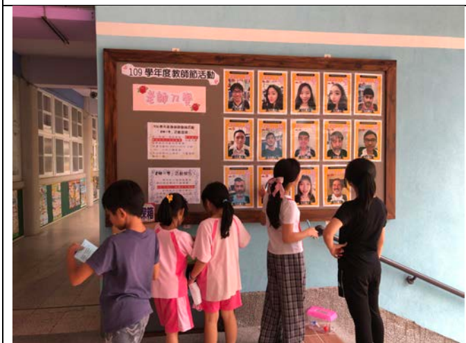
05 特別行動-<教師 72 變>，猜猜我是誰？