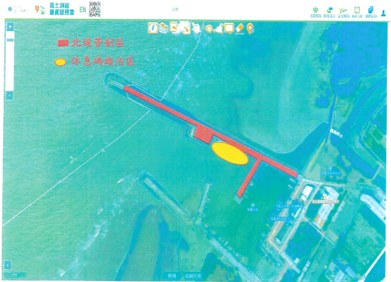
龍鳳漁港北堤休息碼頭管制範圍圖