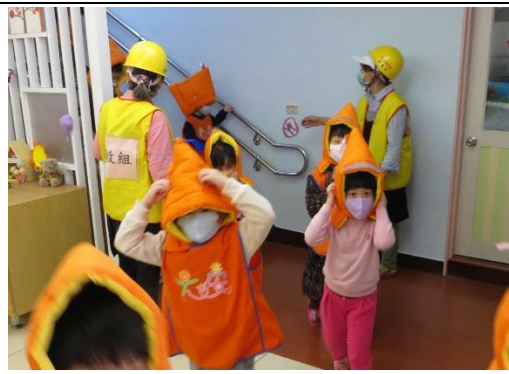
遵守不推、不跑、不語