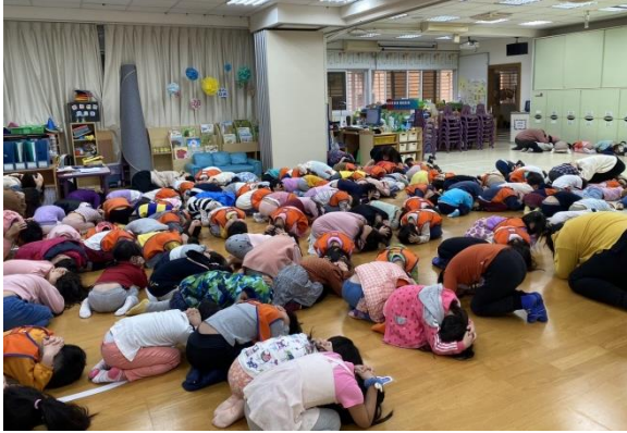
全園活動時間聽到警報，立即掩護