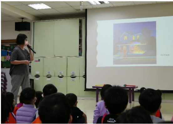
防災繪本-媽媽的紅沙發