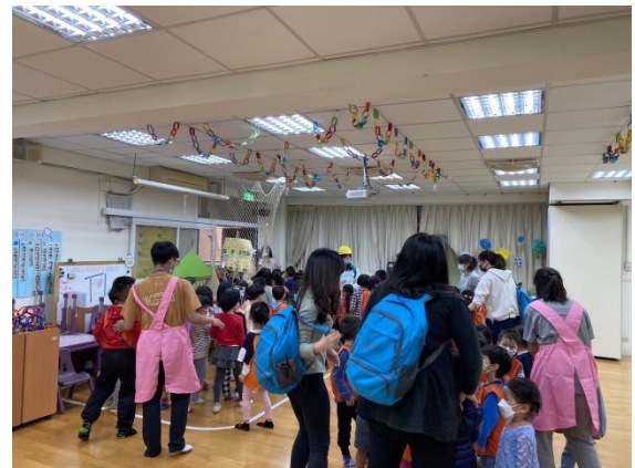
遵守不推、不跑、不語