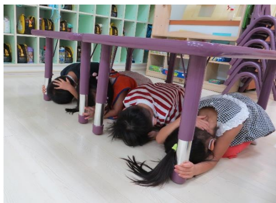
聽到警報，立即掩護