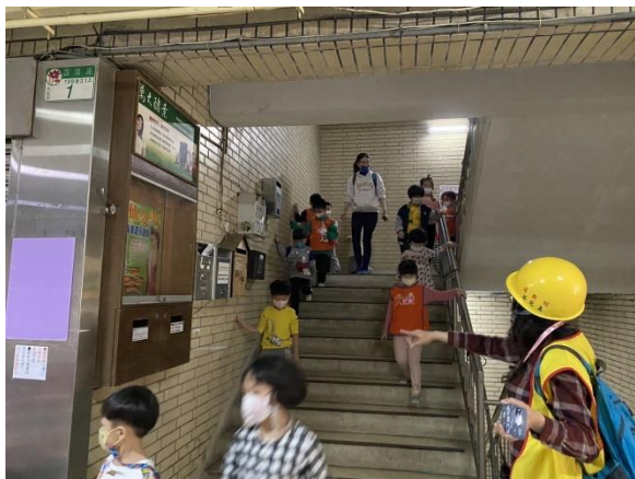
遵守不推、不跑、不語