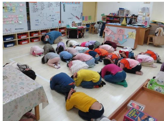
聽到警報，立即掩護