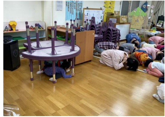
聽到警報，立即掩護