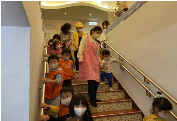
小幼班跟隨老師至戶外