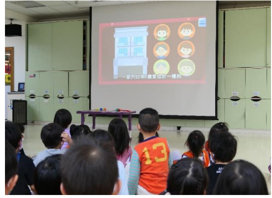
防災影片-遇到火災怎麼辦？