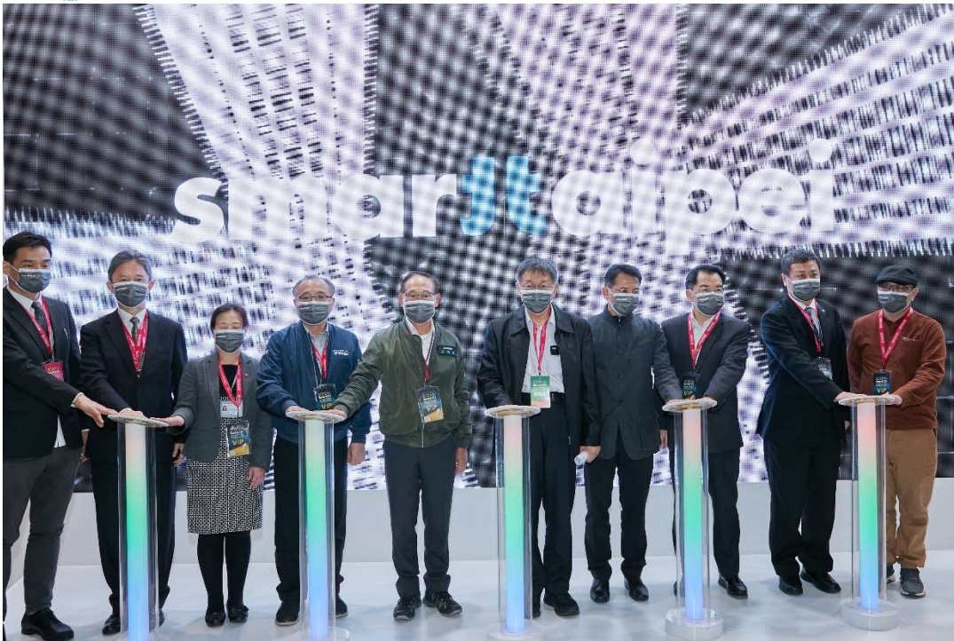
圖3：臺北願景館開幕儀式大合照