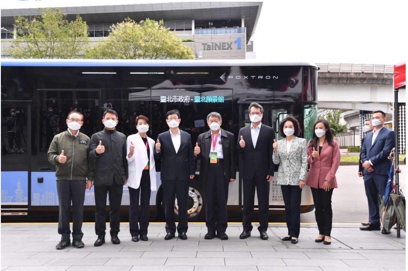
圖1：電動智慧巴士為北市府願景館揭開序幕