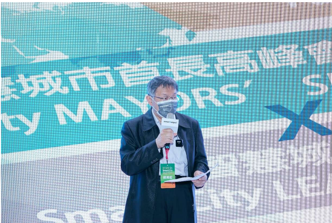
圖2：柯文哲市長為2022智慧城市臺北願景館及首長高峰會暨女性領袖峰會開幕致詞