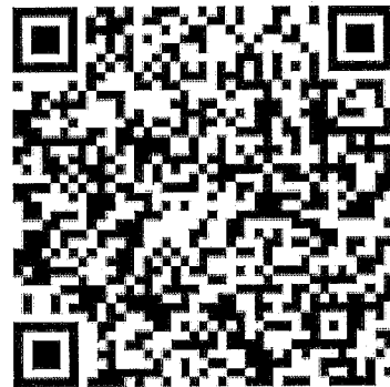
都更五箭常見問答