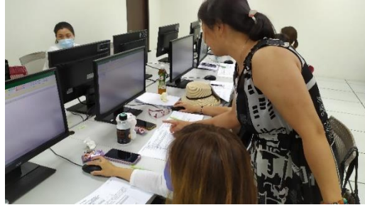
教學相長相互學習