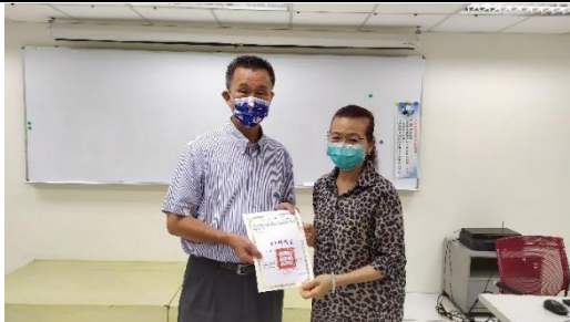
李副區長頒發研習證書