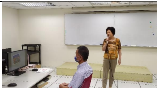
學員製作家鄉景點介紹，分享成果