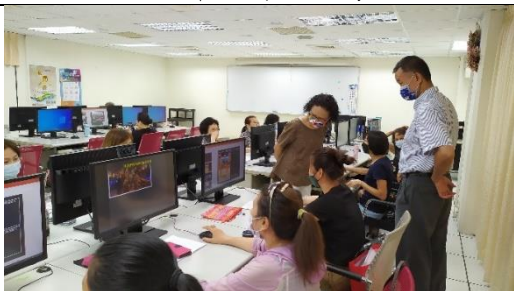
李副區長觀摩學員學習成果