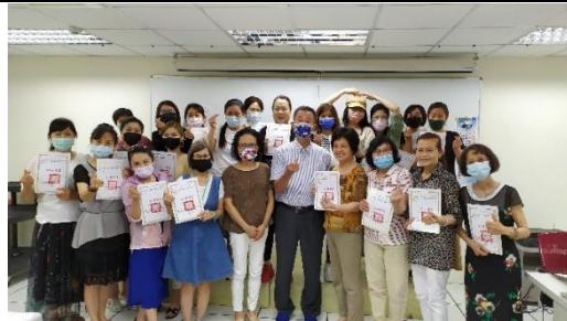
期待明年再一同學習