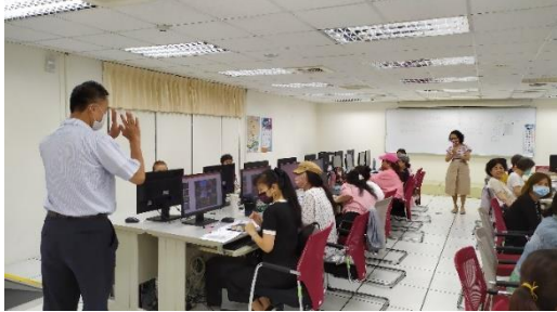
李副區長前來開課勉勵大家

臺北市大安區公所連續 11 年藉由電腦課程的開辦，課程內容除了基本電腦知識，為提升新移民生活適應能力，讓新移民學習進階的電腦檔案管理、Powerpoint 簡報及 Excel 精選實用技巧等資訊課程，採循序漸進教學方式，協助新移民熟練電腦技能，期許學員培養第二專長，應用在日常生活及未來工作上。