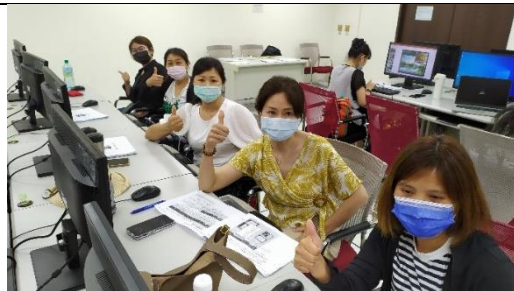
電腦進階班好棒棒