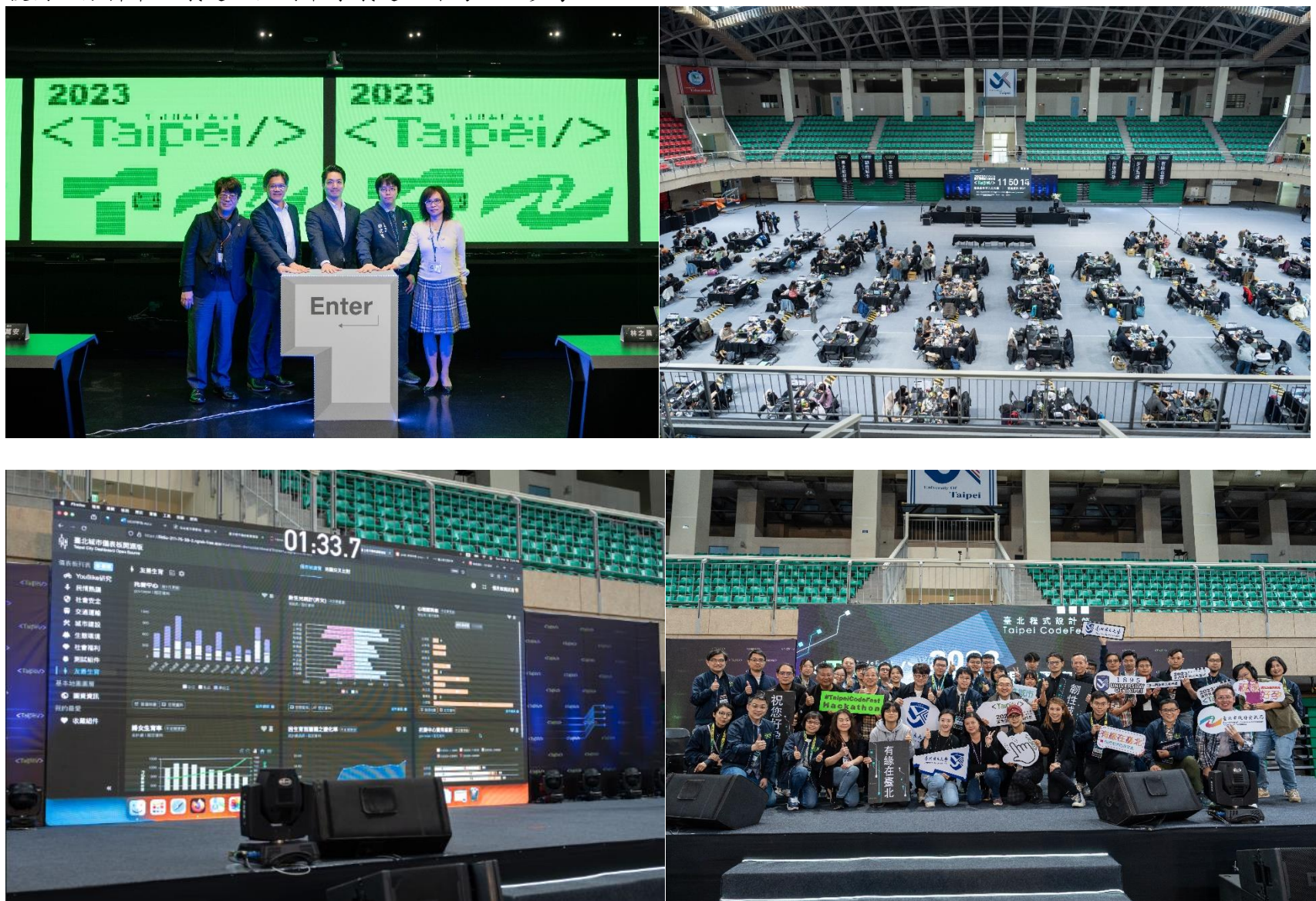
▲ 2023臺北程式設計節-城市儀表板大黑客松活動照片

本局於112年辦理「2023臺北程式設計節-城市儀表板大黑客松」，以民間角度解決市政問題，其中議題包含「有緣在臺北、步步為銀、祝您好孕、宜居台北、韌性城市、臺北歡迎您」等6大主題，其中「有緣在臺北」有助於推動性別主流化，「祝您好孕」更與女性息息相關，吸引女性關注。本次競賽以不分性別的方式，打破性別框架、共同運用資料整合及技術，分析市政議題及性別平等議題並作為施政參考。