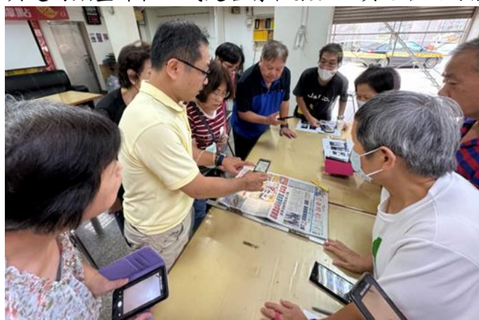
▲ 數位平權推動計畫相關照片

本局委託資訊專業服務廠商辦理「臺北市民免費數位訓練」，並結合社會局、民政局資源，深入社區、里鄰等特定場地，提供在地學習，減少學習者奔波，縮短因為交通所造成的學習機會障礙，並針對銀髮族、原住民、新住民、婦女開設客製化資訊課程。112年本局依據各地區需求或族群特色，開設1至3小時之多元數位課程，開設內容主題包含：手機上網輕鬆學、玩轉社群愉快交朋友、行動購物支付便利通、攝影及影音編輯和網路識讀安全等。112年總計開班130班，參訓人數為2,676人，男性為592人（22.12%），女性為2,084人（77.88%）；後續將評估如何提升男性之參與率，如開設男性較感興趣的類型課程，或是否有和數位工具結合之可能性，以吸引男性參與。