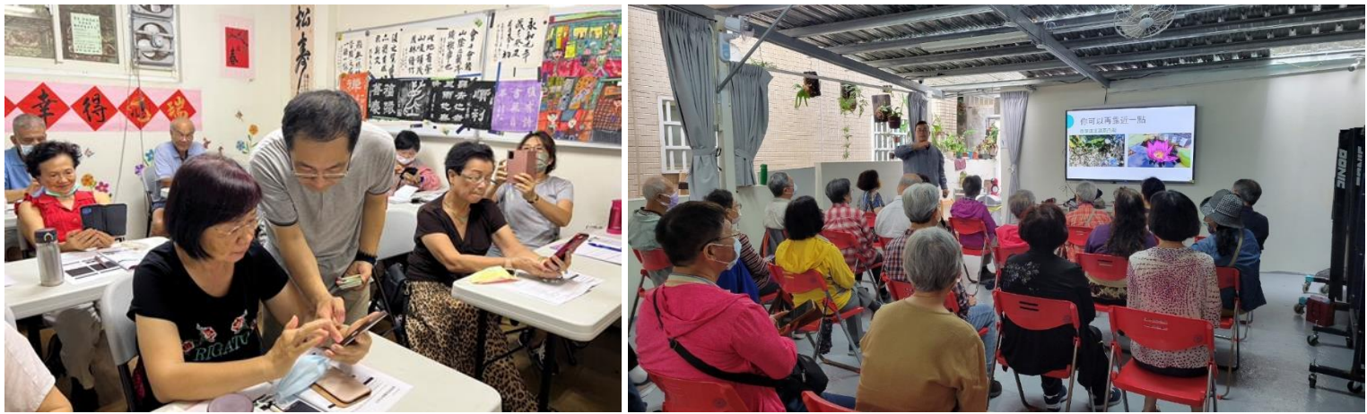
▲ 數位平權推動計畫相關照片

數位平權推動計畫針對銀髮族、原住民、新住民等不同市族群提供多樣化、更貼近需求的客製化數位課程，亦開設女性專班，教授多元資訊相關課程，使其能夠具備基本數位使用能力及素養。另因應近年假訊息等詐騙手法層出不窮，為加強長者在社群軟體上，具備基本辨識不實謠言之能力，在課程中適度融入資安及性別平等議題，透過資訊教育的管道讓更多長者或其他族群認識且認同性別平等的概念，鼓勵共同學習，參與學習新知的過程，藉以破除固有之性別刻板印象。