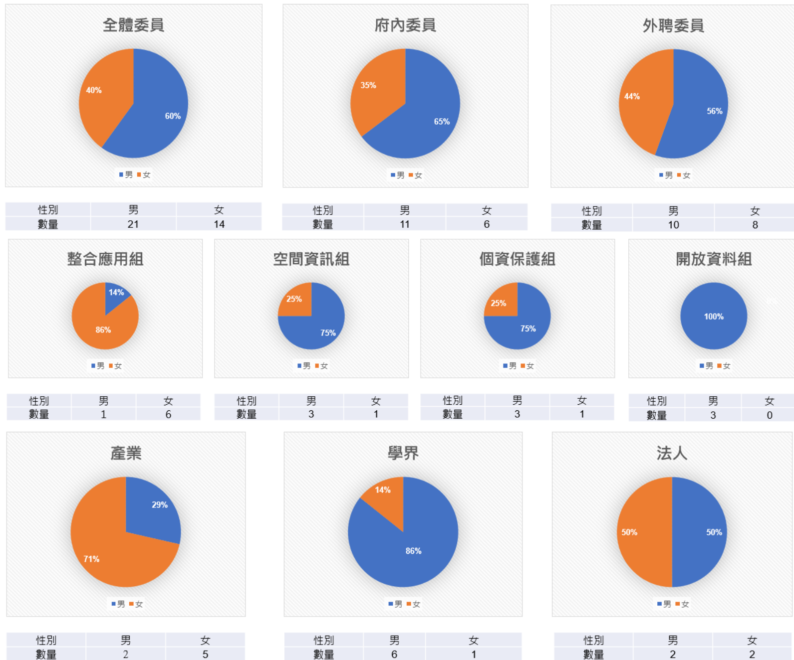
▲ 第2屆資料治理委員會委員性別統計圓餅圖

間團體代表及本府相關機關代表組成；依據111年9月6日修正有關委員性別規定為任一性別以不低於全體委員總數三分之一為原則，進行第2屆委員遴選，外聘委員男性比例為56%、女性比例為44%，府內委員男性比例為65%、女性比例為35%，全體委員男性比例為60%、女性比例為40%，符合相關規定。