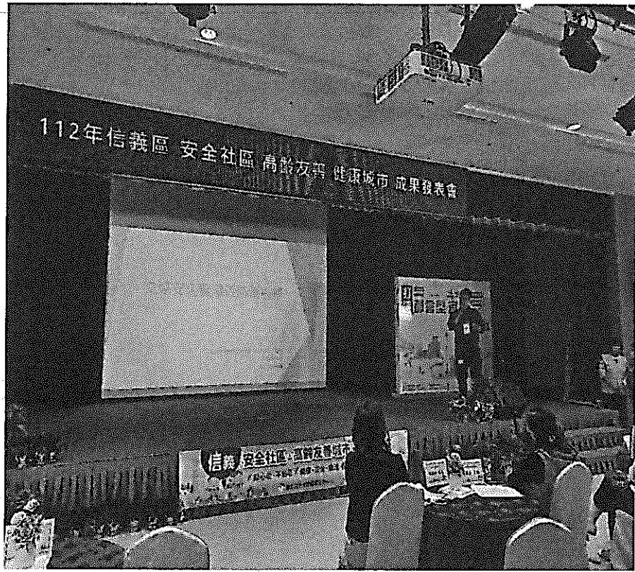
說明：高齡交通安全宣導