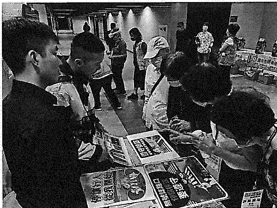
說明：高齡交通安全宣導