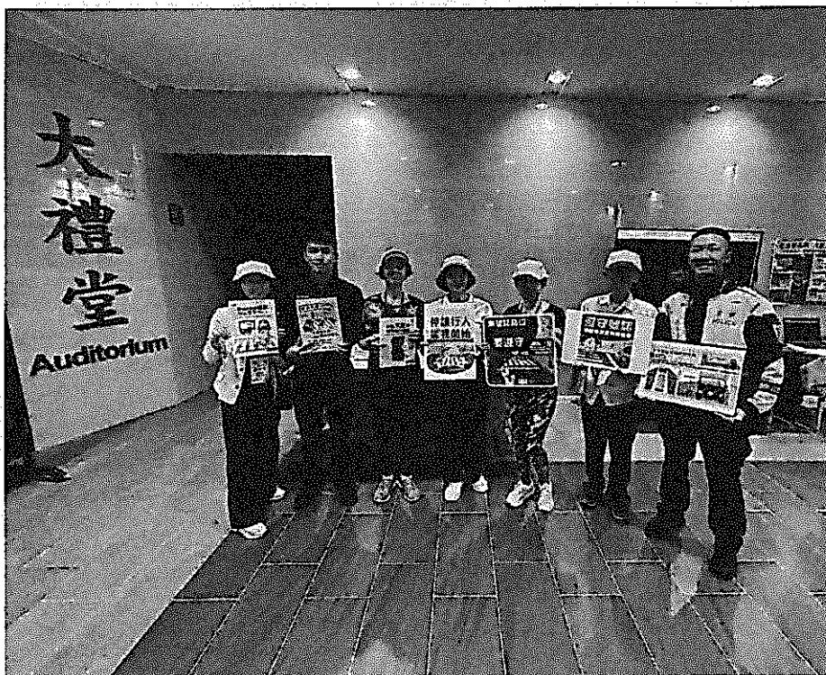
說明：高齡交通安全宣導