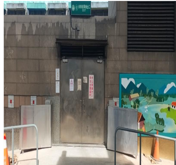
家戶擺動式防水閘門