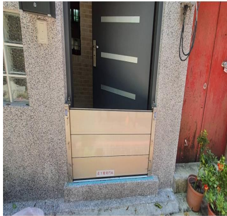
家戶組合式防水閘門