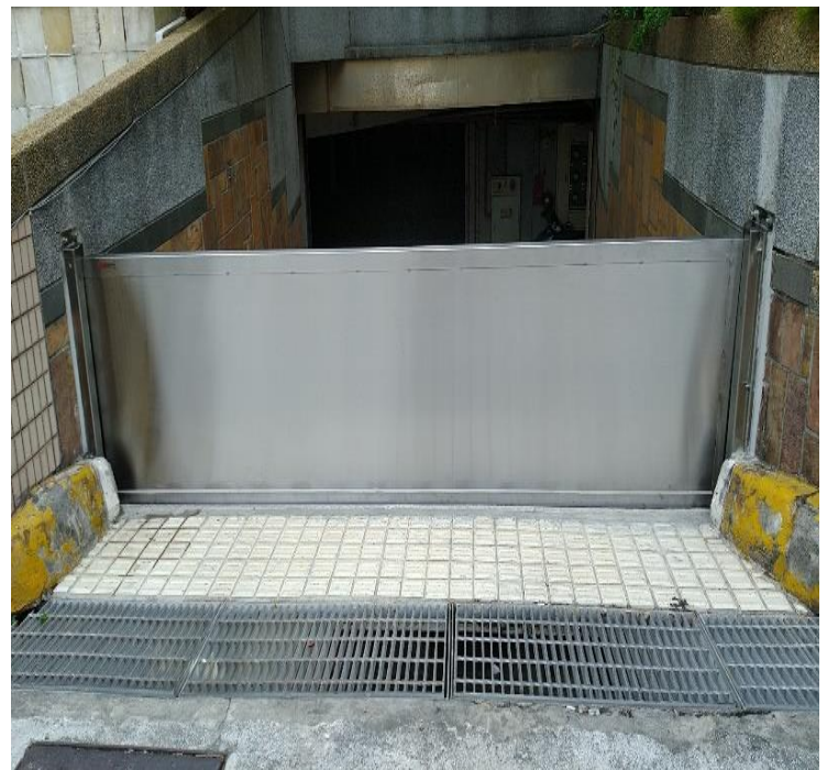
車道擺動式防水閘門