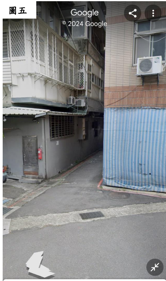
圖五 8 木柵路一段238巷 2年前 · 查看更多日期 >