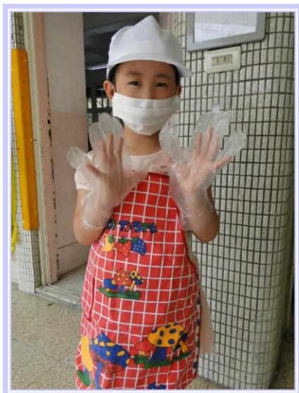
12.1-1 班級打菜小天使預先穿戴整齊準備。