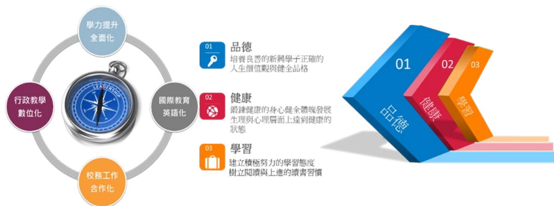
圖 1：新興國中辦學四大經營方向與三核心價值

四年前新任新興國中校長時，我以「全人教育多元發展，賞識孩子激勵成功，建立自信主動學習，拓展國際視野提升學力」的教育理念，希望來培養具思考表達的學生，並透過尊重與共榮的態度來組織專業合作分享的教師團隊，以建立永續經營的學習型學校。實際接任校長後，再上述教育理念耕耘下，更貼近實務發展以「 品德、健康、學習 」為辦學三核心，並凝聚團隊共識訂定四大經營方向，以「 學力提升全面化、國際教育英語化、校務工作合作化、行政教學數位化 」為推動校務主軸，與時俱進，並在全校教師團隊用心付出下，新興國中有了新的氣象。