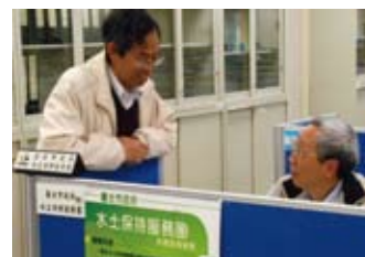
▲水土保持服務團提供民眾諮詢服務