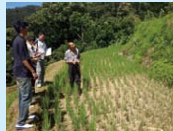
▲大地工程處與水土保持服務團技師 親至現場勘查協助規劃