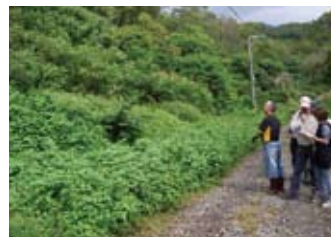
▲專業技師現場會勘輔導，坡地安全有保障