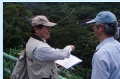
▲水土保持服務團技師專業又熱心，為農友 解決不少水土保持疑問

臺北市政府水土保持服務團成立於民國94年5月，成員由臺北市土木技師公會、臺北市大地工程技師公會、臺北市水土保持技師公會與臺北市水利技師公會四大團體，推薦具有熱誠且經驗豐富的專業技師組成，現有團員33人，凡是對農地開發利用水土保持有疑問的農友，都可免費申請技術指導。