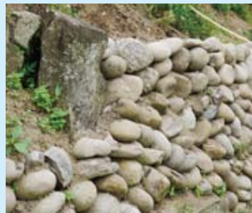
▲農地水土保持相關問題都可申請 免費技術諮詢