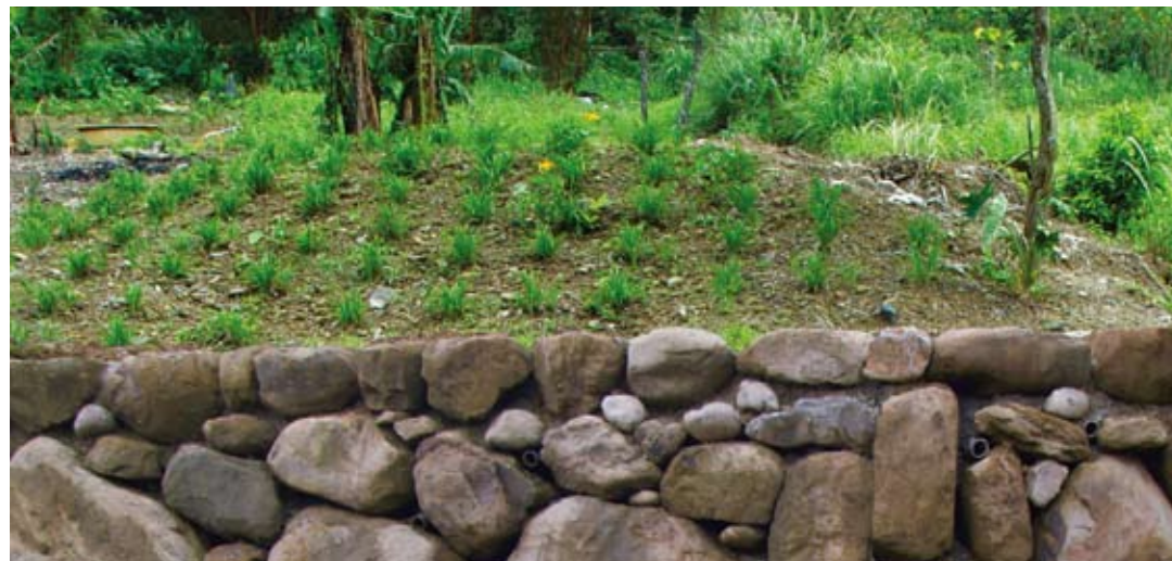
▲駁坎砌石堆疊，兼顧生態保育又可增添古樸風味

臺北市大地工程處於99年1月28日成立後，將輔導農民實施農地水土保持列為施政重點，在照顧農民與協助合理農業開發的原則下，以往繁瑣的申請流程都簡化辦理。農友有需求，即可向臺北市大地工程處申請輔導，臺北市大地工程處將邀請水土保持服務團專業技師現場會勘輔導施工，歡迎農友多加利用。