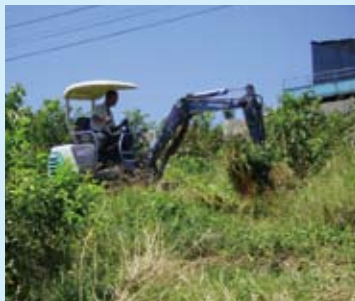
▲機具開挖坡地須事先申請